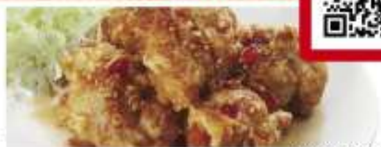
写真は名物旨から!です