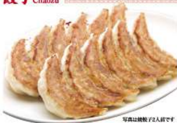
写真は焼餃子2人前です