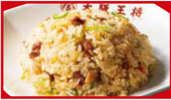
五目炒飯 560円(税込) 五目炒飯(小) 430円(税込)