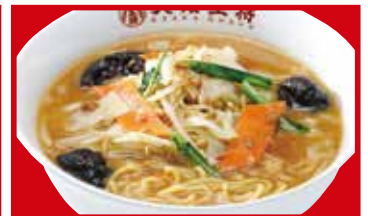
味噌ラーメン 820円(税込)