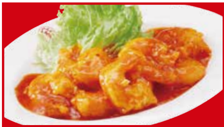
海老のチリソース 890円(税込) 海老のチリソース(小) 450円(税込)