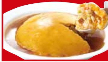
ふわとろ天津炒飯 820円(税込)