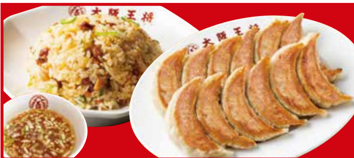
餃子W&炒飯セット 1,100円(税込) 餃子12ヶ・五目炒飯・スープ