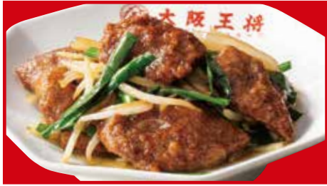
レバニラ炒め 760円(税込) レバニラ炒め(小) 450円(税込)