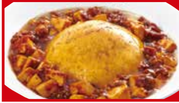
ふわとろ麻婆天津飯 890円(税込)