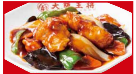
酢豚 820円(税込) 酢豚(小) 450円(税込)