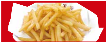
フライドポテト 500円(税込)