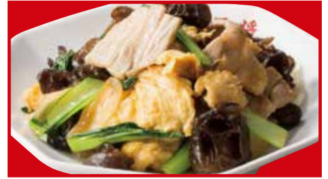
豚肉と木耳の卵炒め 760円(税込) 豚肉と木耳の卵炒め(小) 450円(税込)