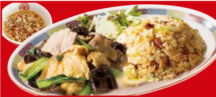
ムーシーロー&炒飯セット 990円(税込) ムーシーロー(小)・五目炒飯・スープ