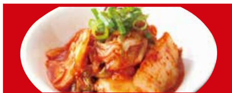
白菜キムチ 295円(税込)