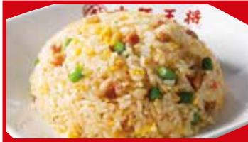
ニンニク炒飯 680円(税込)