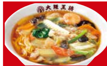
五目うま煮そば 790円(税込)