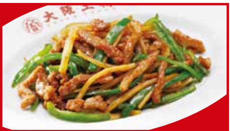
チンジャオロース 850円(税込)