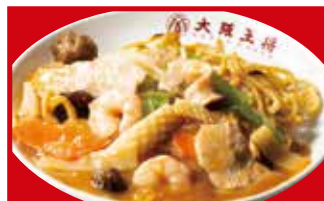
五目あんかけ焼きそば 820円(税込)