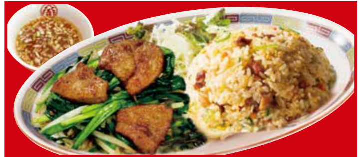
レバニラ&炒飯セット 990円(税込) レバニラ炒め(小)・五目炒飯・スープ