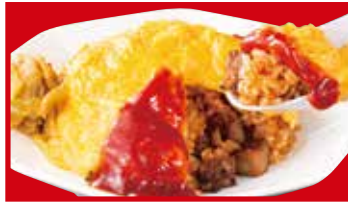
オムライス 820円(税込)