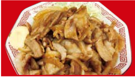
豚の生姜焼き 760円(税込) 豚の生姜焼き(小) 450円(税込)