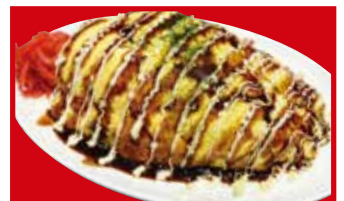
そばロール 790円(税込)

※写真はイメージです。価格は店内飲食の税込価格です。お持ち帰りの際は金額が異なります。