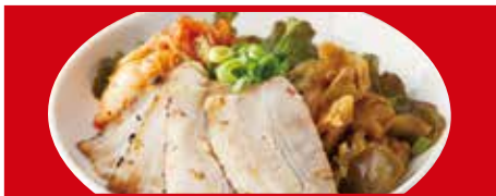
おつまみ3種盛り 590円(税込) ザーサイ・キムチ・チャーシュー