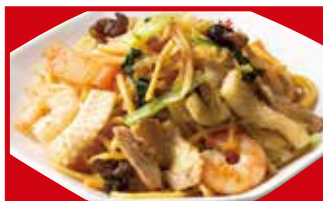
炒め焼きそば 790円(税込)