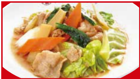
肉と野菜炒め 760円(税込) 肉と野菜炒め(小) 450円(税込)