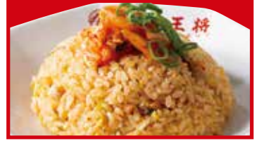
キムチ炒飯 680円(税込)