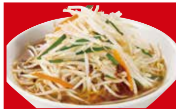
もやしそば 790円(税込)