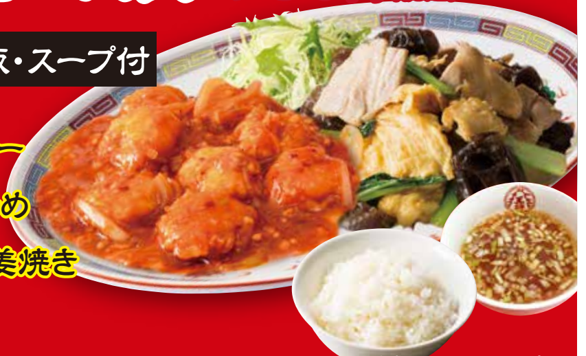
※画像は海老チリとムーシーローです。 おかずは逸品(小)サイズです。※写真はイメージです。