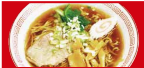
中華そば 610円(税込) 中華そば(小) 430円(税込)