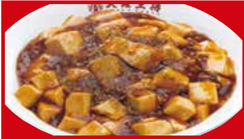
四川麻婆丼 730円(税込)