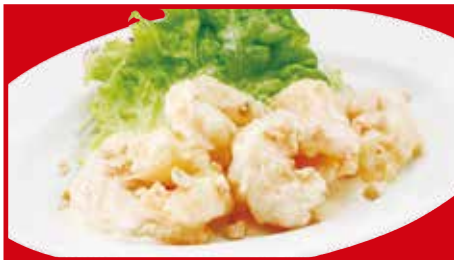
海老マヨネーズ 820円(税込) 海老マヨネーズ(小) 450円(税込)