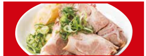
チャーシュー 490円(税込)