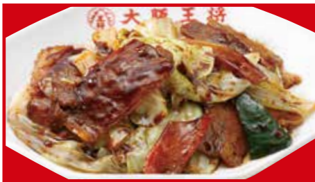
ホイコーロー 760円(税込) ホイコーロー(小) 450円(税込)