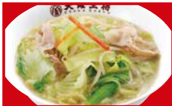
野菜たっぷりタンメン 790円(税込)