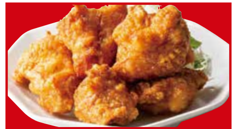
鶏の唐揚げ(5ヶ) 760円(税込) 鶏の唐揚げ(小) 470円(税込)