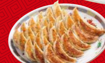
メガ盛焼餃子 30個 税込1,490円