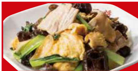
豚肉と木耳の卵炒め 税込760円