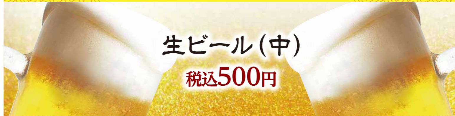
生ビール(中) 税込500円