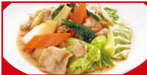
肉と野菜炒め 税込680円