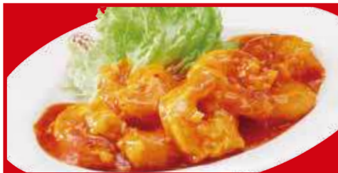
海老のチリソース 税込880円