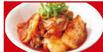
白菜キムチ 税込290円