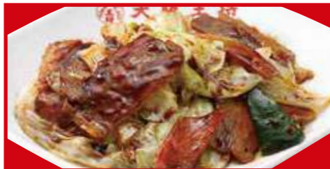
ホイコーロー 税込760円