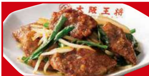
レバニラ炒め 税込700円