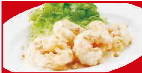
海老マヨネーズ 税込820円