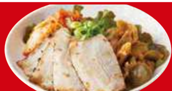
おつまみ3種盛り ザーサイ・キムチ・チャーシュー 税込680円