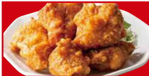
鶏の唐揚げ 税込700円