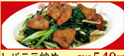
レバニラ炒め 税込540円