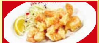
小エビの天ぷら 税込490円