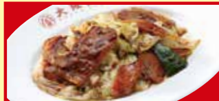
ホイコーロー 税込590円