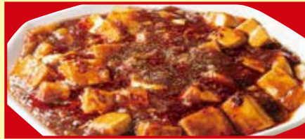
四川麻婆豆腐 税込690円