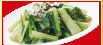
青菜のガーリック炒め 税込490円