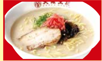
とんこつラーメン 税込790円