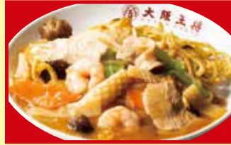
五目あんかけ焼きそば 税込890円