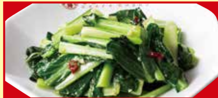
青菜のガーリック炒め 税込590円