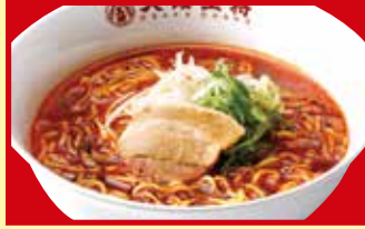
炎のラーメン 税込690円