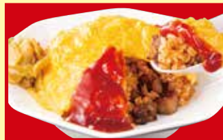
オムライス 税込790円