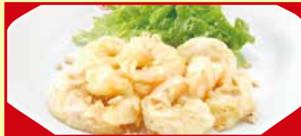
海老のマヨネーズ 税込990円