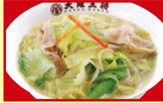
野菜たっぷりタンメン 税込790円