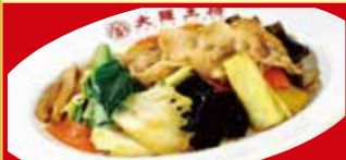
肉と野菜炒め 税込490円