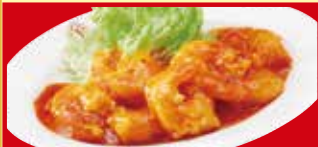
海老のチリソース 税込690円