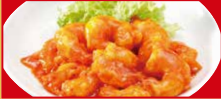
海老のチリソース 税込990円