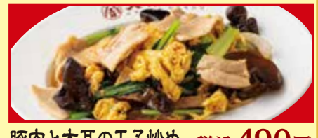
豚肉と木耳の玉子炒め 税込490円