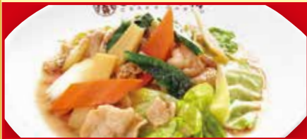
肉と野菜炒め 税込690円