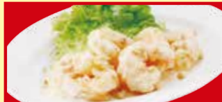
海老のマヨネーズ 税込690円