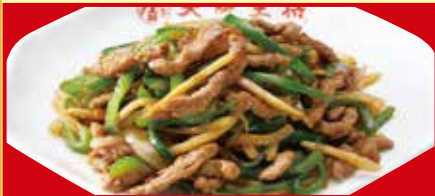
チンジャオロース 税込890円