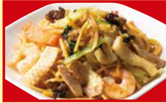
炒め焼きそば 税込790円