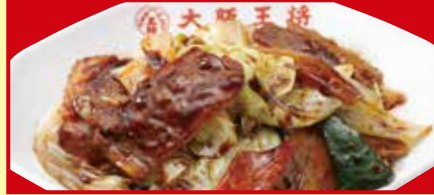
ホイコーロー 税込790円