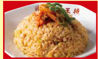
牛ムチ炒飯 税込690円