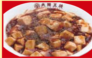
四川麻婆丼 税込690円