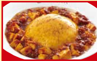
ふわとろ麻婆天津飯 税込790円