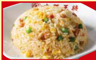
ニンニク炒飯 税込690円