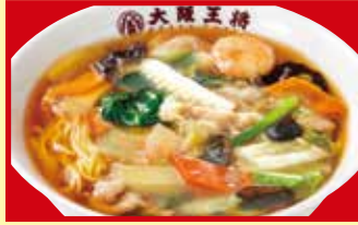
五目あんかけラーメン 税込790円