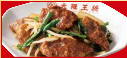
レバニラ炒め 税込740円