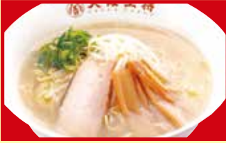
塩ラーメン 税込590円