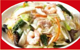
海鮮皿うどん 税込790円