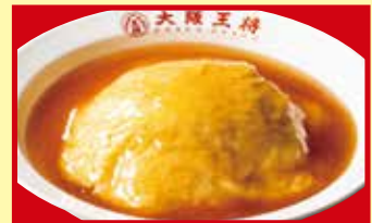
ふわとろ天津飯 税込540円