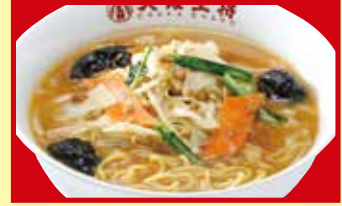
味噌ラーメン 税込890円