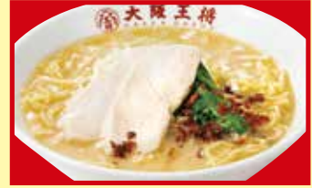
鶏白湯ラーメン 税込690円