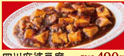
四川麻婆豆腐 税込490円