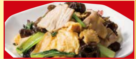
豚肉と木耳の玉子炒め 税込690円