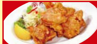
鶏のから揚げ 税込490円