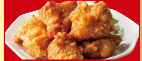
鶏のから揚げ 税込690円