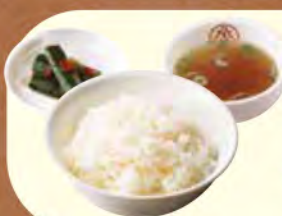
ご飯セット ご飯・スープ・漬物 +260円 (税込)