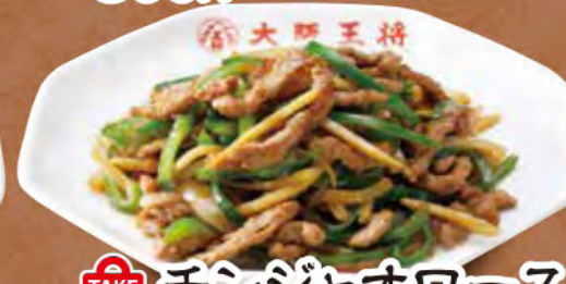
TAKE OUT チンジャオロース 780円 (税込)