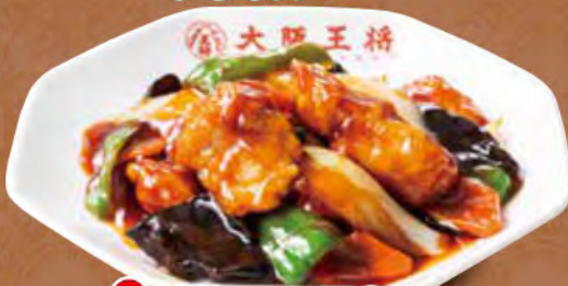
TAKE OUT 酢豚 780円 (税込)