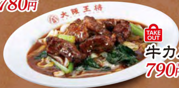
TAKE OUT 牛カルビ炒め 790円 (税込)