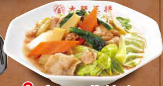
TAKE OUT 肉と野菜炒め 620円 (税込)