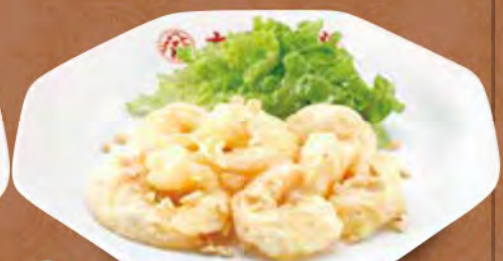
TAKE OUT 海老マヨネーズ 780円 (税込)