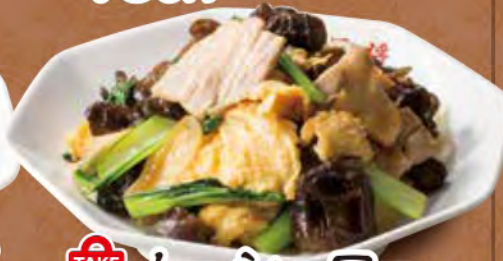
TAKE OUT ムーシーロー 730円 (税込)