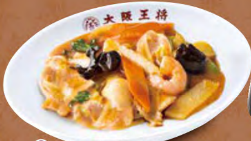
TAKE OUT 八宝菜 780円 (税込)