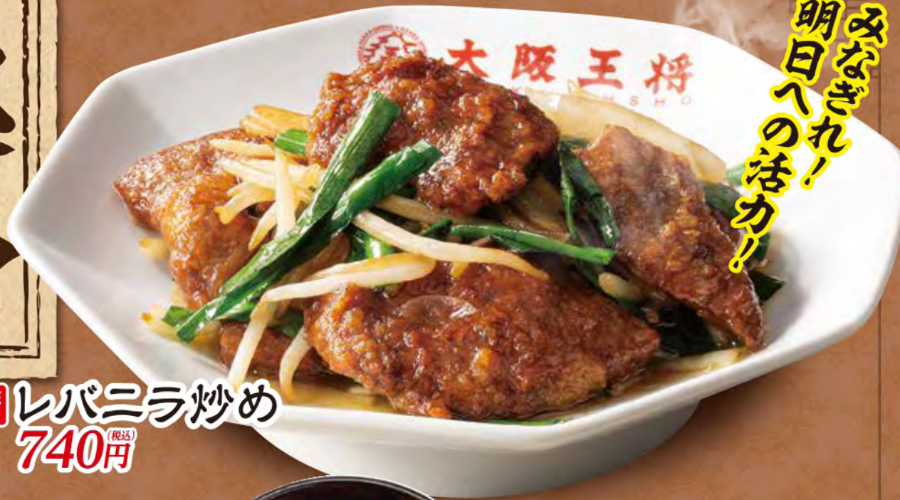
TAKE OUT レバニラ炒め 740円 (税込)