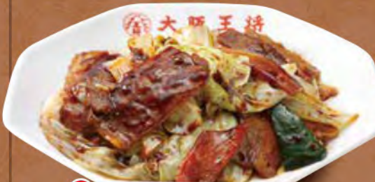
TAKE OUT ホイコーロー 780円 (税込)