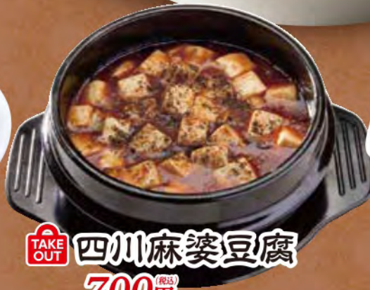
TAKE OUT 四川麻婆豆腐 700円 (税込)