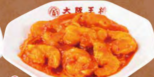
TAKE OUT 海老のチリソース 800円 (税込)