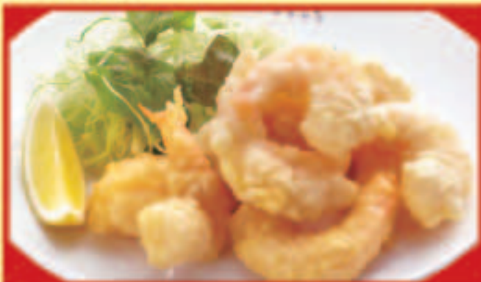
小エビの天ぷら 税込790円