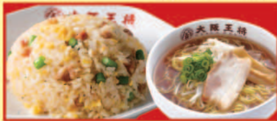
ニンニク炒飯&half中華そばセット ニンニク炒飯・ half中華そば 税込990円