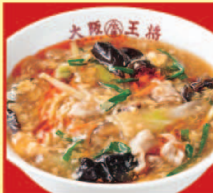
スーラータンメン