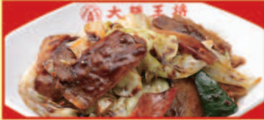
ホイコーロー 税込790円