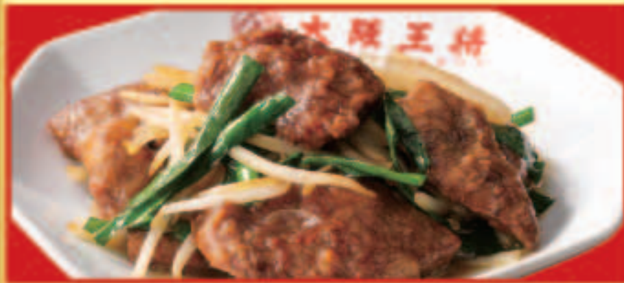
レバニラ炒め 税込740円