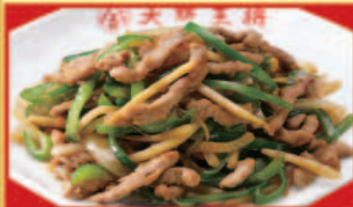
チンジャオロース 税込890円