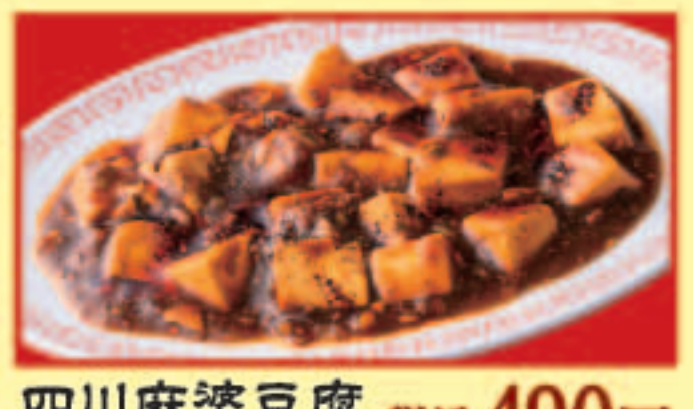
四川麻婆豆腐 税込490円