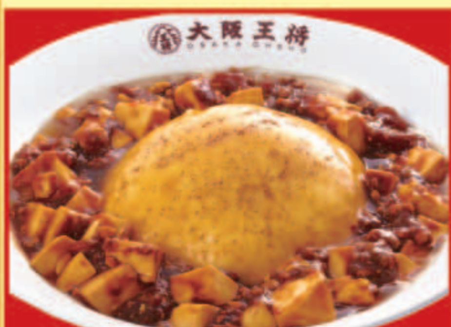
ふわとろ麻婆天津飯