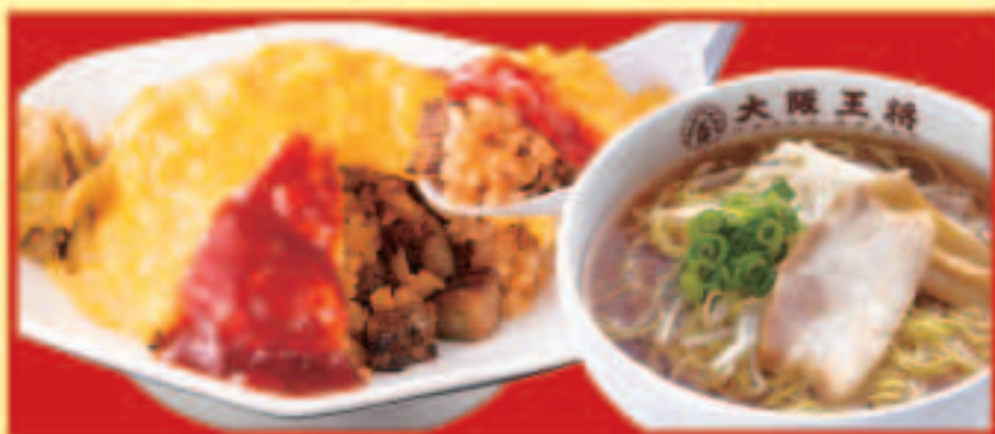
オムライス&half中華そばセット オムライス・ half中華そば 税込1,090円