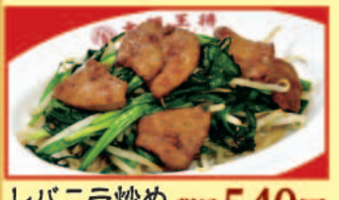
レバニラ炒め 税込540円