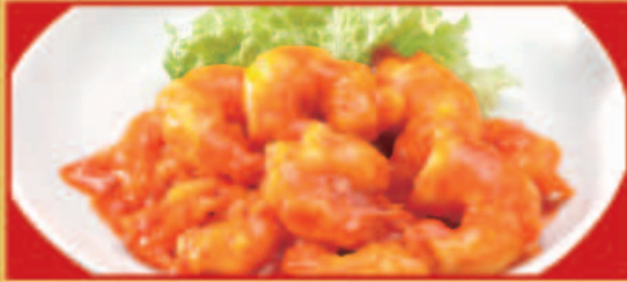
海老のチリソース 税込990円