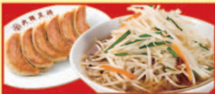
もやしそば&餃子セット もやしそば・餃子1人前 税込970円