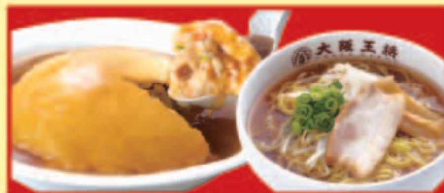
天津炒飯&half中華そばセット 天津炒飯・ half中華そば 税込1,090円