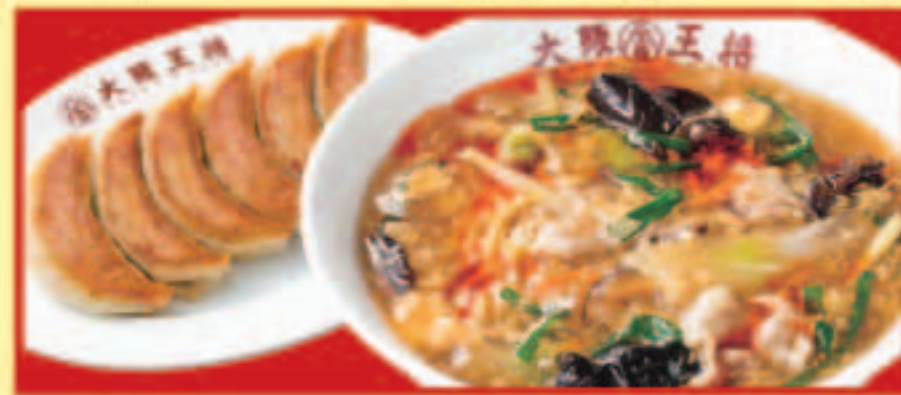
スーラータンメン&餃子セット スーラータンメン ・餃子1人前 税込1,070円