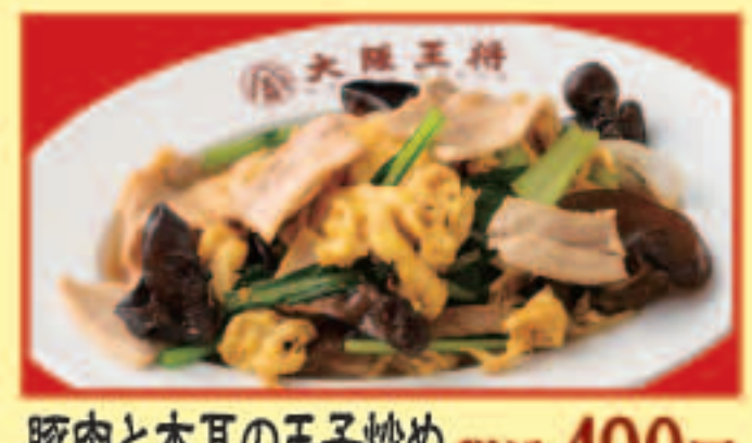
豚肉と木耳の玉子炒め 税込490円