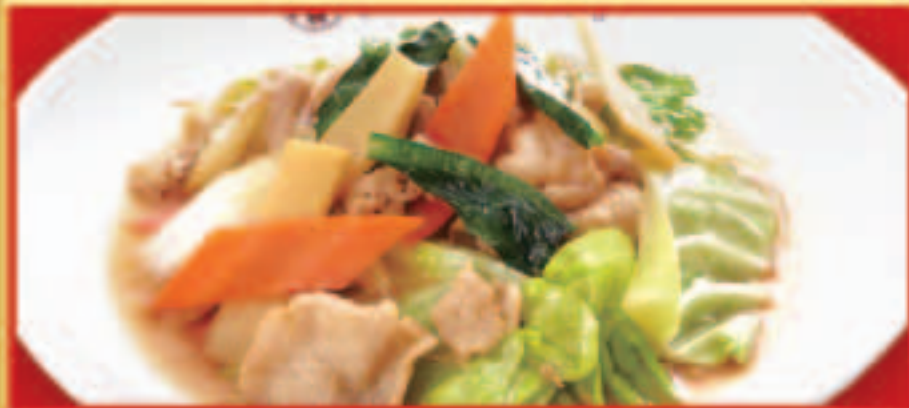
肉と野菜炒め 税込690円