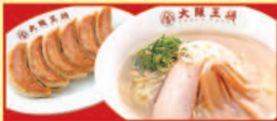
塩ラーメン&餃子セット 塩ラーメン・餃子1人前 税込870円