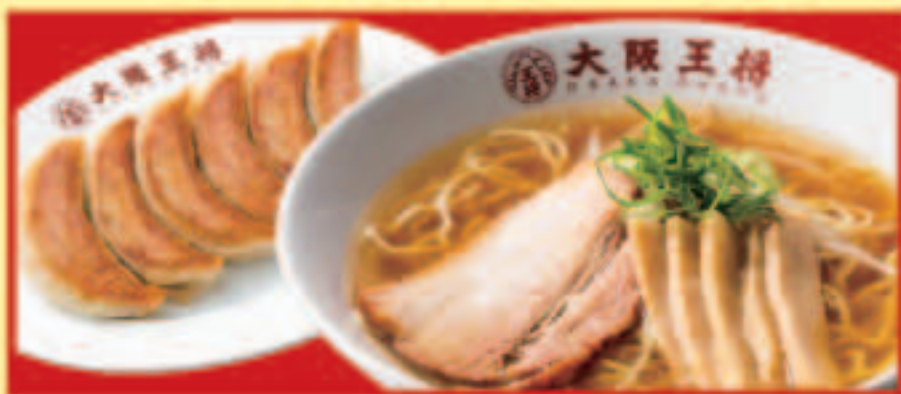
中華そば&餃子セット 中華そば・餃子1人前 税込870円