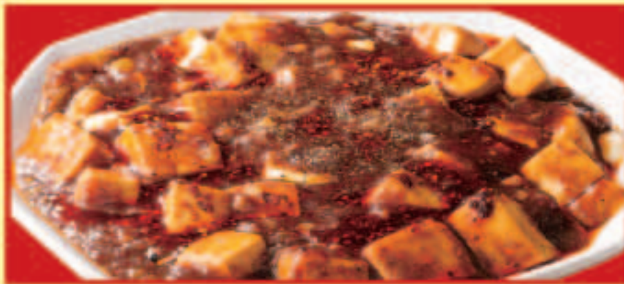
四川麻婆豆腐 税込690円