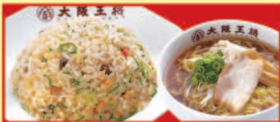
五目炒飯&half中華そばセット 五目炒飯・ half中華そば 税込890円