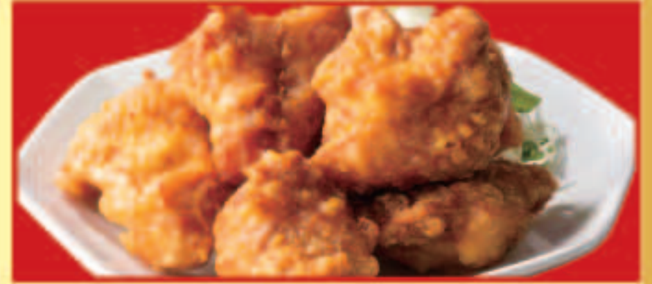
鶏のから揚げ 税込690円