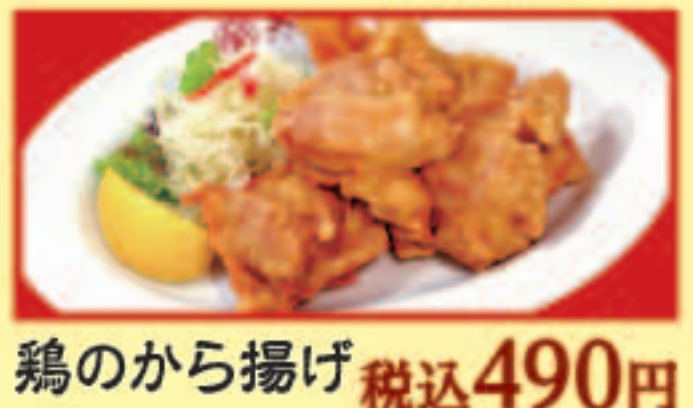
鶏のから揚げ 税込490円