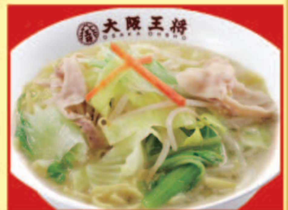
野菜たっぷりタンメン