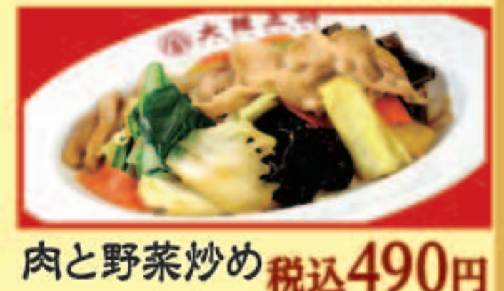
肉と野菜炒め 税込490円