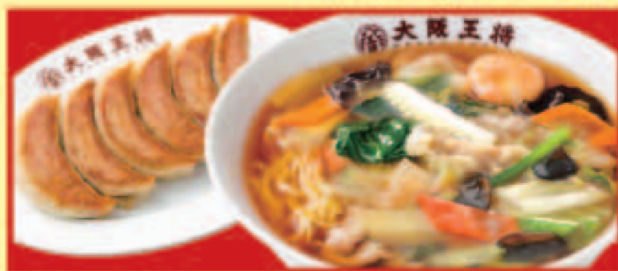
五目うま煮そば&餃子セット 五目うま煮そば・ 餃子1人前 税込1,070円