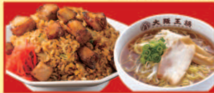
焼豚炒飯&half中華そばセット 焼豚炒飯・ half中華そば 税込1,090円