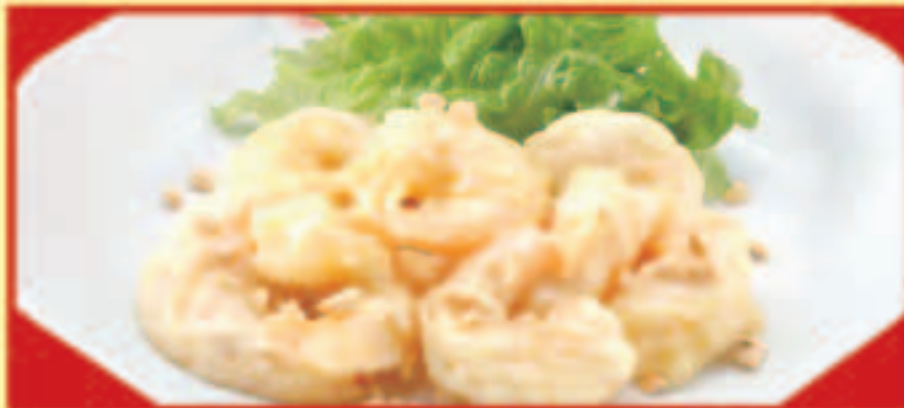
海老のマヨネーズ 税込990円