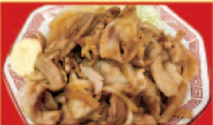
豚の生姜焼き 税込690円