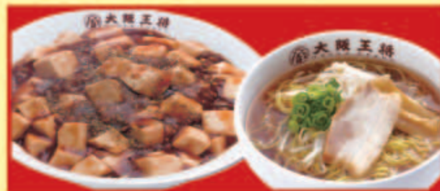
麻婆丼&half中華そばセット 麻婆丼・ half中華そば 税込990円