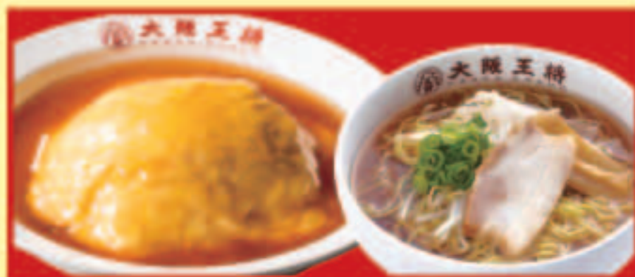
ふわとろ天津飯&half中華そばセット ふわとろ天津飯・ half中華そば 税込840円