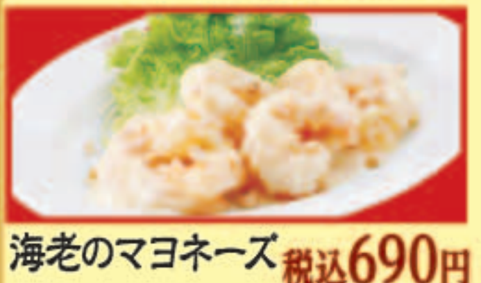
海老のマヨネーズ 税込690円