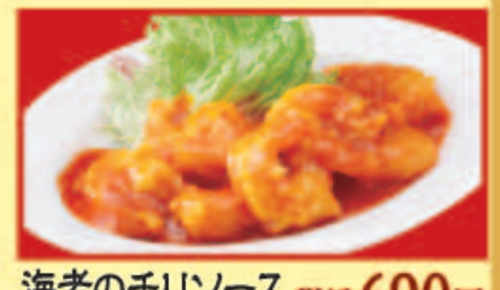
海老のチリソース 税込690円