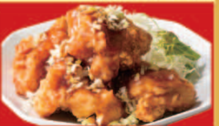
鶏の唐揚げ 葱醤油 税込760円