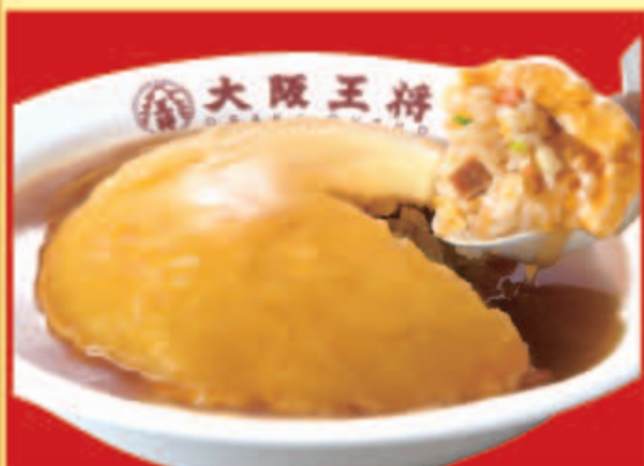
ふわとろ天津炒飯