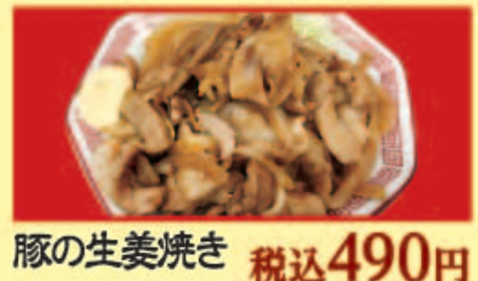
豚の生姜焼き 税込490円