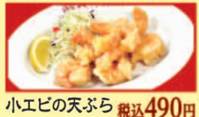
小エビの天ぷら 税込490円