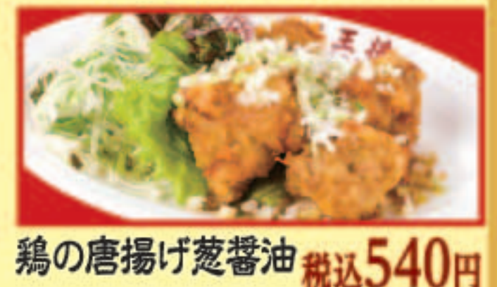
鶏の唐揚げ 葱醤油 税込540円