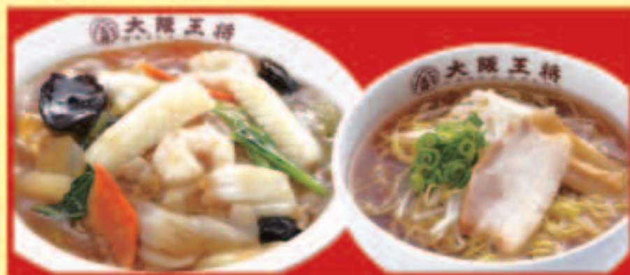
中華丼&half中華そばセット 中華丼・ half中華そば 税込990円