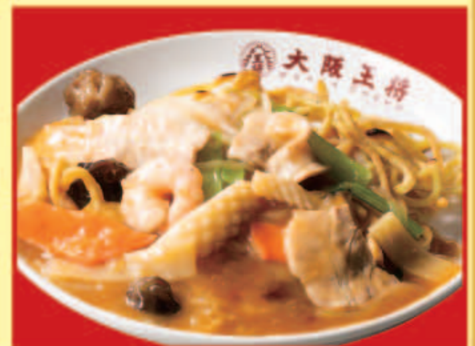
五目あんかけ焼きそば