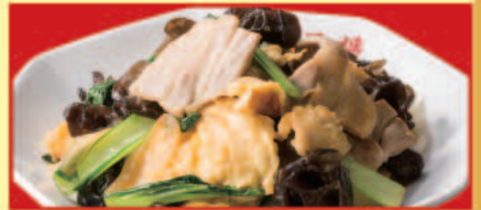
豚肉と木耳の玉子炒め 税込690円