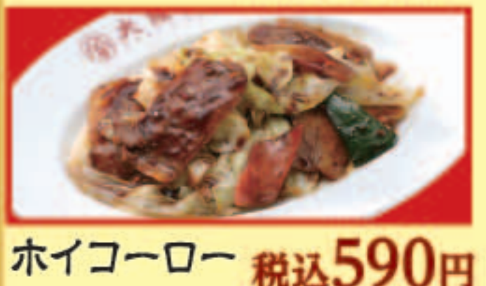
ホイコーロー 税込590円