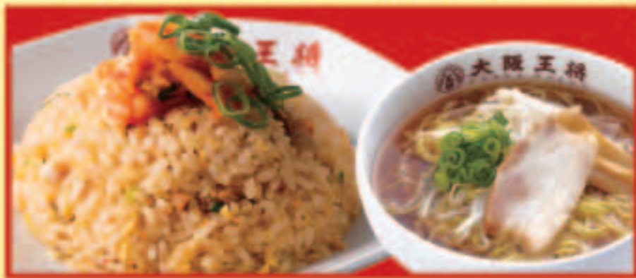
キムチ炒飯&half中華そばセット キムチ炒飯・ half中華そば 税込990円