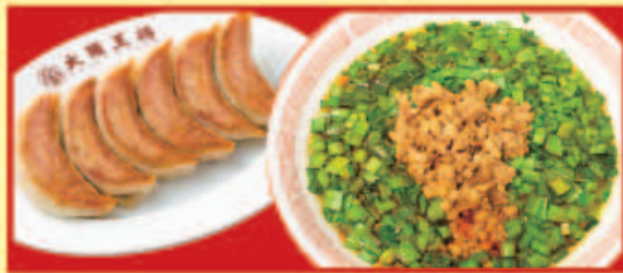
ニラそば&餃子セット ニラそば・餃子1人前 税込1,070円