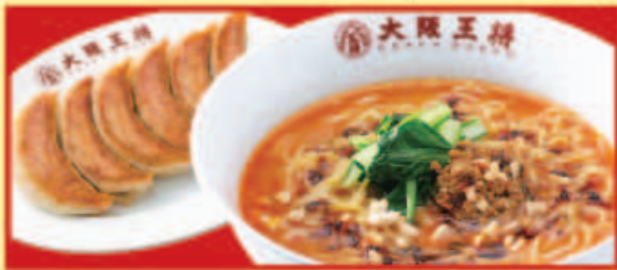
担々麺&餃子セット 担々麺・餃子1人前 税込1,070円