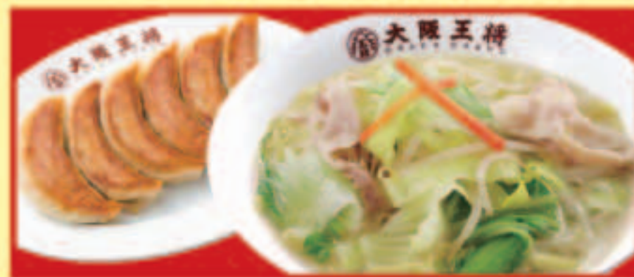
野菜たっぷりタンメン&餃子セット 野菜たっぷりタンメン ・餃子1人前 税込1,070円