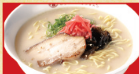
熱成どんこつラーメン 650円(税込)