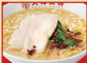
鶏白湯ラーメン 670円(税込)