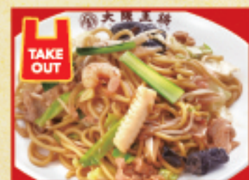
もちもち太麺の炒め焼きそば 750円(税込)