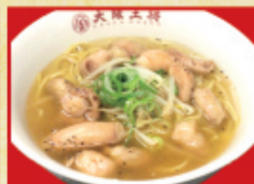
ホルモンラーメン 900円(税込)