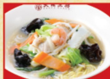
大阪ちゃんぽん麺 860円(税込)