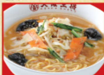
野菜たっぷり味噌ラーメン 860円(税込)