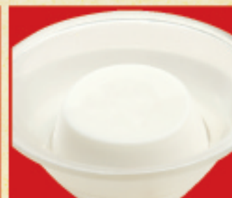
さわやか杏仁豆腐 320円(税込)