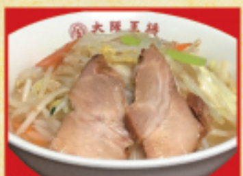
野菜ラーメン 720円(税込)