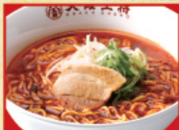
炎のラーメン 770円(税込)