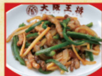
チンジャオロース(小) 440円(税込)