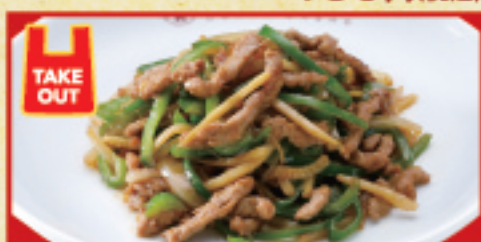
チンジャオロース