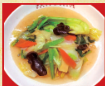
野菜炒め(小) 360円(税込)