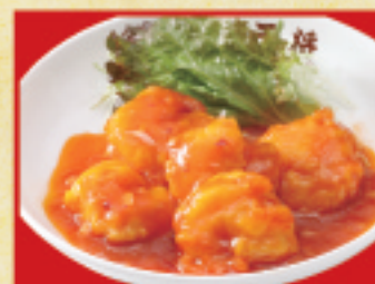
鶏唐揚げ(小) 460円(税込)