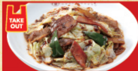
ごちそうキャベツの回鍋肉