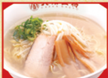
塩ラーメン 650円(税込)