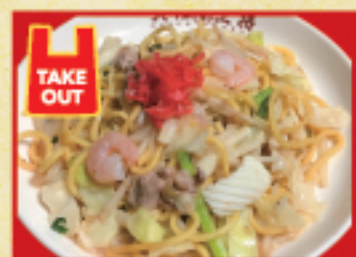
塩焼きそば 730円(税込)