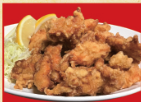
メガ唐揚げ 2,740円(税込)