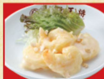
鶏唐揚げ(小) 440円(税込)