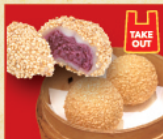
紫芋のゴマ団子 320円(税込)