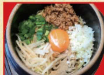
玉将まぜそば 780円(税込)