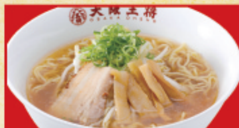
醤油ラーメン 650円(税込) 醤油ラーメン(小) 440円(税込)