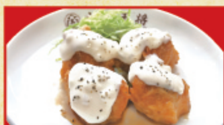
チキン南蛮(小) 410円(税込)