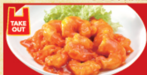
梅港のチリソース