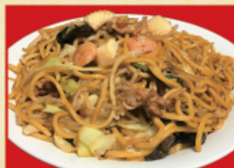
メガ焼きそば 2,980円(税込)