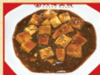
四川麻婆豆腐(小) 380円(税込)