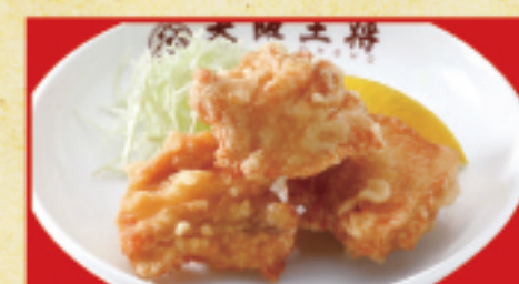
鶏の唐揚げ(小) 420円(税込)