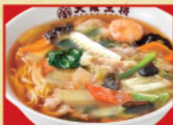
五国あんかけラーメン 820円(税込)