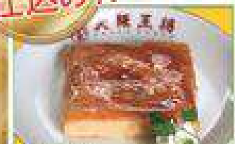
人気商品!! クリーミーカタラーナ 380円