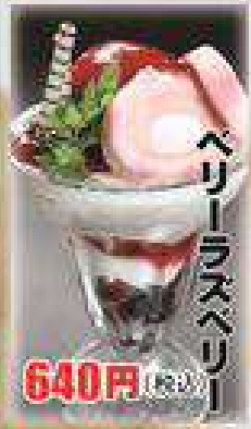
ベリーラズベリー 640円(税込)