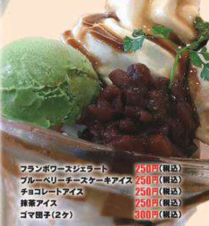
フランボワーズジェラート 250円(税込) ブルーベリーチーズケーキアイス 250円(税込) チョコレートアイス 250円(税込) 抹茶アイス 250円(税込) ゴマ団子(2ケ) 300円(税込)