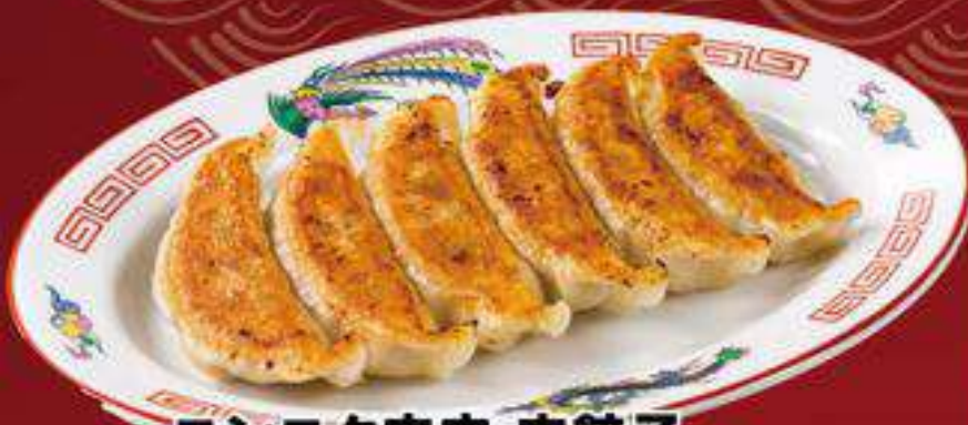
ニンニク肉肉 肉餃子