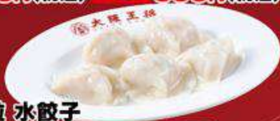
ぷるもち大粒 水餃子