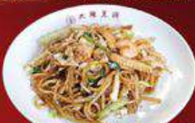
もちもち太麺 ソース焼そば