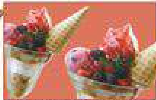
絶妙なベリーの甘すっぱさ ストロベリーソフトバフエ 590円