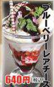
ブルーベリーレアチーズ 640円(税込)