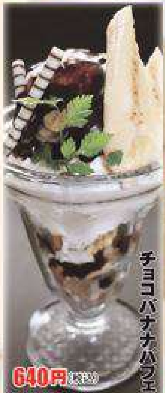
チョコバナナパフエ 640円(税込)