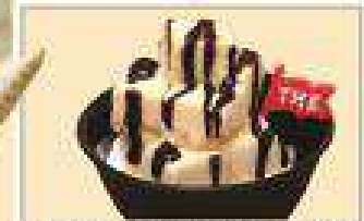
自家製なめらかプリンアイス ひとくちプリンアイス 280円