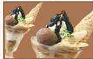
定番のチョコとバナナ チョコソフトバフエ 590円