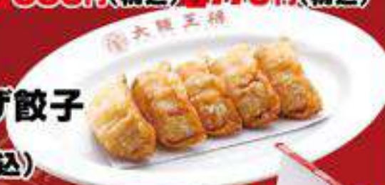
さくさく揚げ餃子