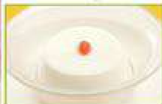
さわやか なめらかな口当 さわやか杏仁豆腐 300円