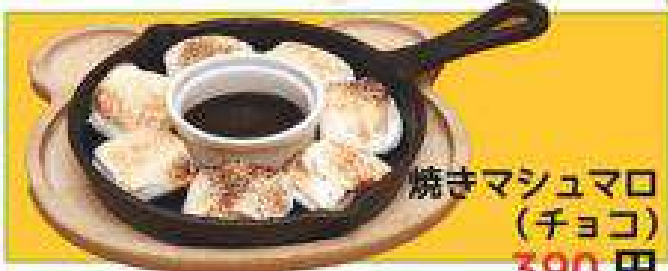
焼きマシュマロ (チョコ) 390円