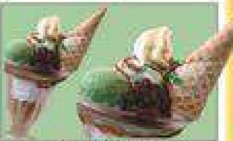
まっ茶と黒みつの和風感 和風ソフトバフエ 590円