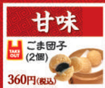
ごま団子 (2個) 360円(税込)