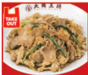
豚バラとザーサイの 黒胡椒炒め 780円(税込)