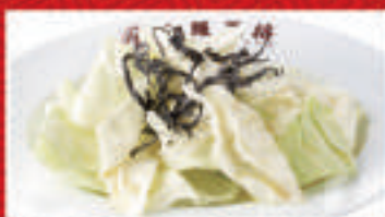
塩タレキャベツ 360円(税込)