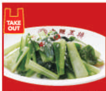
青菜のガーリック炒め 630円(税込)