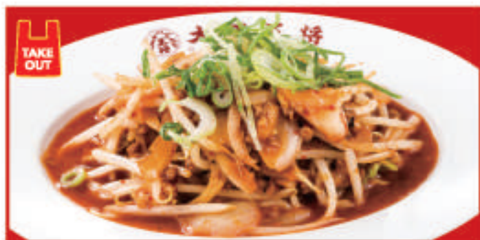
豚ひき肉ともやしのみムチ炒め 670円(税込)