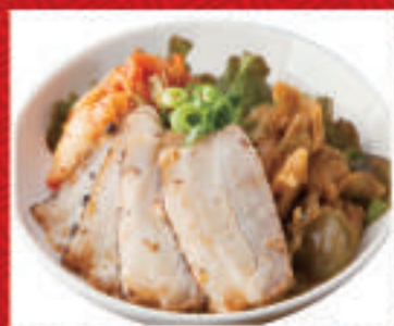
おつまみ3種盛 チャーシュー・キムチ・ザーサイ 630円(税込)