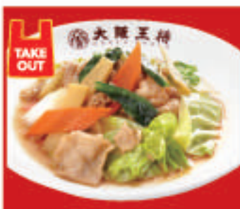
肉野菜炒め 770円(税込)