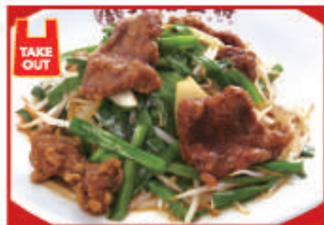
レバニラ炒め 850円(税込)