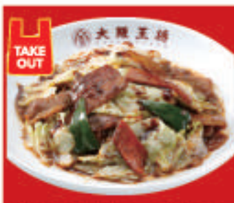
ごちそうキャベツの ホイコーロー 850円(税込)