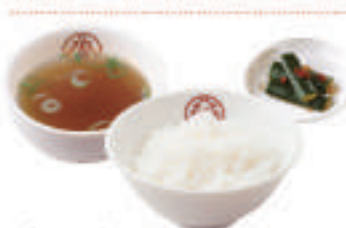
ごはんセット 310円(税込) 白ごはん・スープ・漬物 ごはんセット(小) 250円(税込) 白ごはん(小)・スープ・漬物 ごはんセット(大) 370円(税込) 白ごはん(大)・スープ・漬物