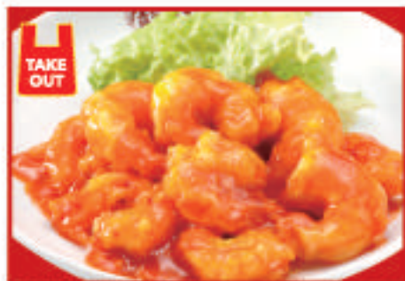
ぷりぷり海老のチリソース (8尾) 850円(税込)