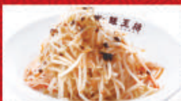
ビリ辛もやしナムル 470円(税込)