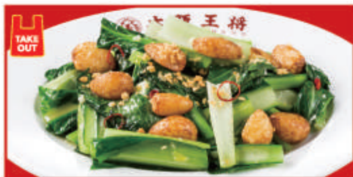
ホクホクニンニクの 青菜ガーリック炒め 690円(税込)