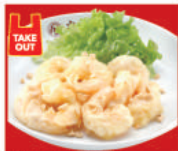
ぷりぷり海老の マヨネーズ(8尾) 850円(税込)