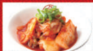
白菜キムチ 370円(税込)