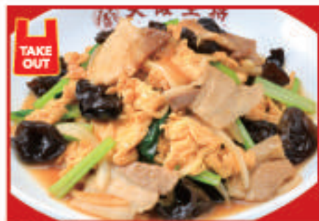
ムーシーロー 770円(税込)