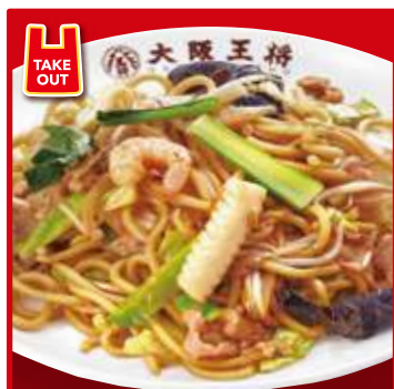
炒め 焼きそば (大)