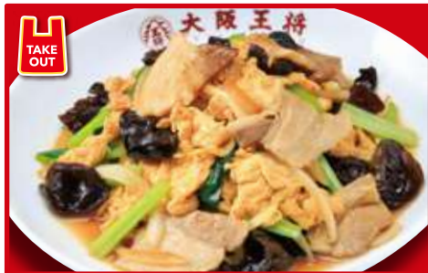
ムーシーロー 670円(税込)