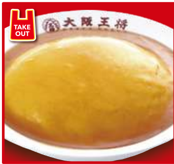
TAKE OUT ふわとろ天津飯 スープ付 550円(税込)