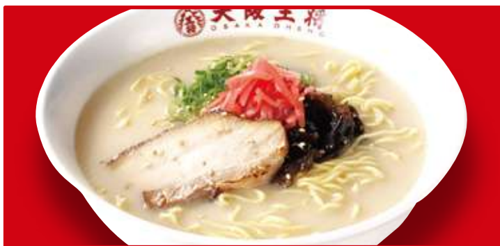
とんこつラーメン (小)