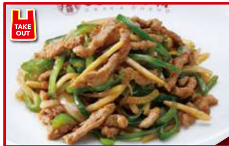
チンジャオロース 770円(税込)