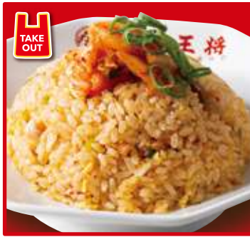
TAKE OUT キムチ炒飯 スープ付 700円(税込)