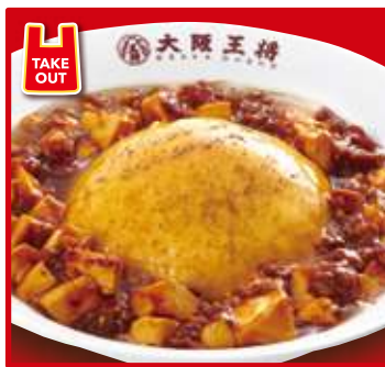
TAKE OUT ふわとろ麻婆天津飯 スープ付 830円(税込)