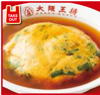
TAKE OUT ニラ玉天津飯 スープ付 680円(税込)