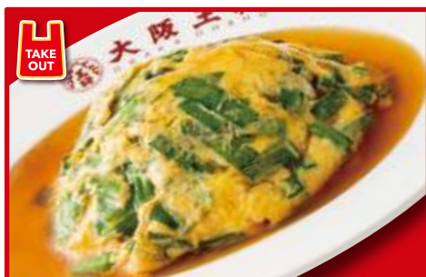
ニラ玉あんかけ 630円(税込)