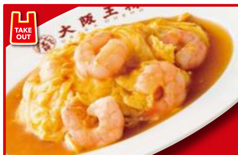
海老玉あんかけ 650円(税込)