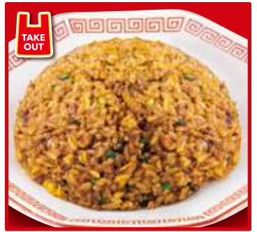
TAKE OUT カレー炒飯 スープ付 700円(税込)