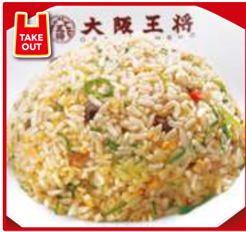
TAKE OUT 五目炒飯 550円(税込) スープ付 (小) 440円(税込)