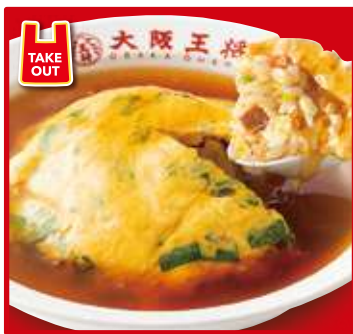
TAKE OUT ニラ玉天津炒飯 スープ付 800円(税込)