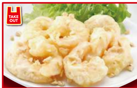
海老マヨネーズ 780円(税込) (8尾)