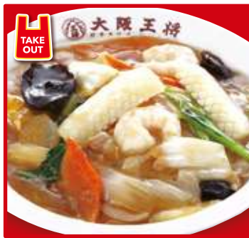
TAKE OUT 中華丼 700円(税込) スープ付 (小) 550円(税込)