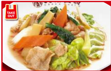
肉と野菜炒め 670円(税込)