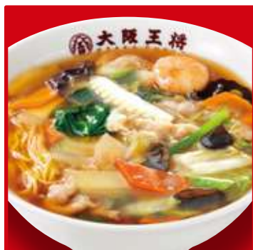
五目あんかけラーメン