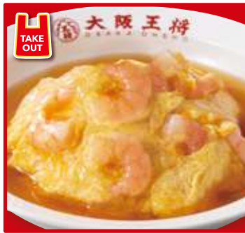
TAKE OUT エビ玉天津飯 スープ付 700円(税込)