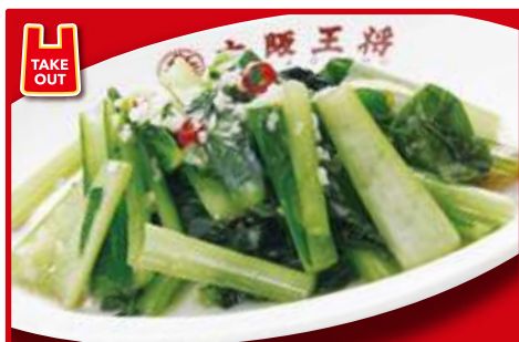
青菜ガーリック炒め 620円(税込)