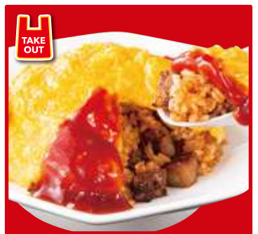
TAKE OUT 初恋オムライス スープ付 800円(税込)