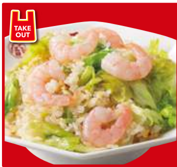
TAKE OUT エビレタス炒飯 スープ付 790円(税込)