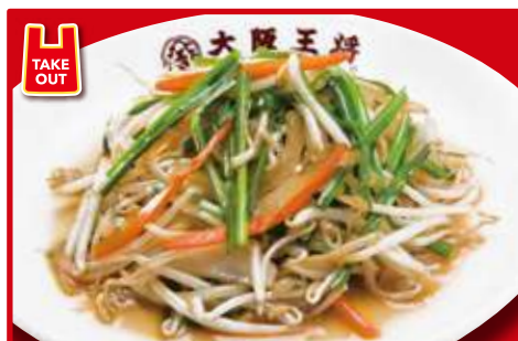
ニラもやし炒め 650円(税込)