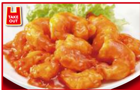
海老のチリソース 860円(税込) (10尾)