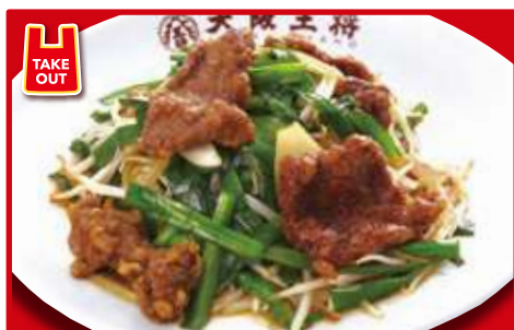
レバニラ炒め 730円(税込)