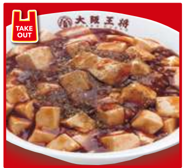
TAKE OUT 四川麻婆丼 700円(税込) スープ付 (小) 550円(税込)