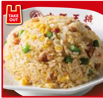
TAKE OUT ニンニク炒飯 スープ付 700円(税込)