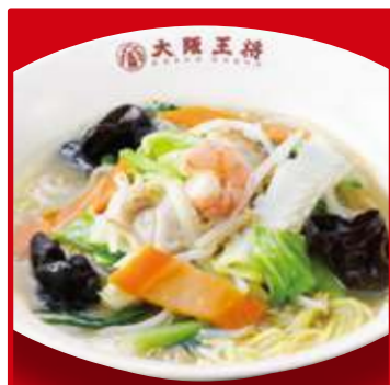
大阪ちゃんぽん麺