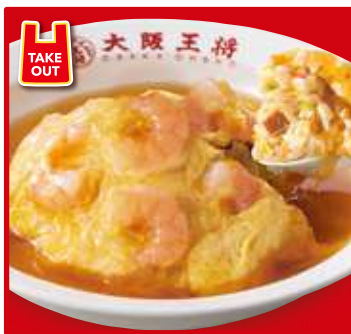
TAKE OUT エビ玉天津炒飯 スープ付 820円(税込)