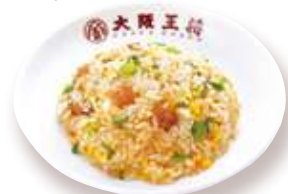
セットハーフ炒飯