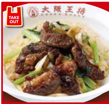
TAKE OUT 牛カルビ炒飯 スープ付 960円(税込)