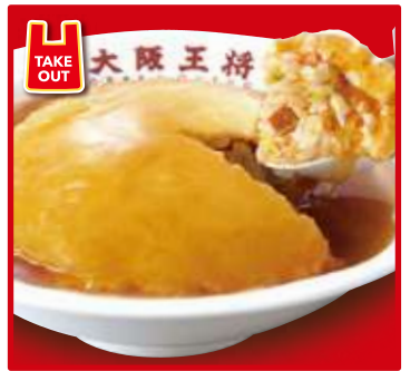
TAKE OUT ふわとろ天津炒飯 スープ付 750円(税込)