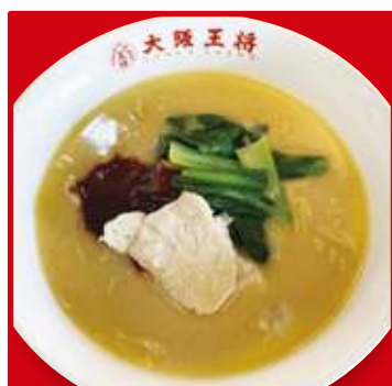
ピリ辛鶏白湯ラーメン