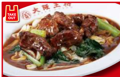
牛カルビ炒め 860円(税込)