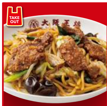
レバ入り 焼きそば (大)