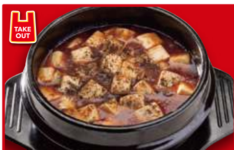
四川麻婆豆腐 700円(税込)