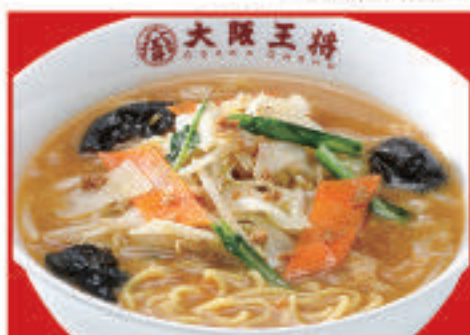
野菜たっぷり味噌ラーメン 830円(税込)