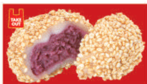
紫芋のゴマ団子(2個) 350円(税込)