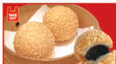
ゴマ団子(2個) 350円(税込)