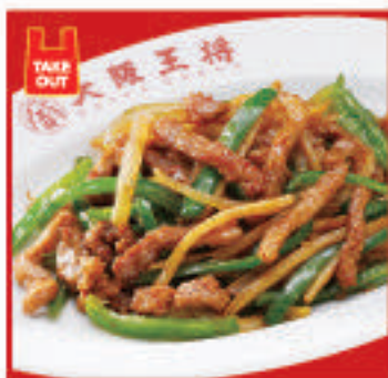
チンジャオロース