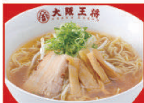
中華そば 580円(税込) (ハーフ) 420円(税込)