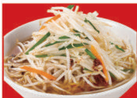
もやしそば 730円(税込)