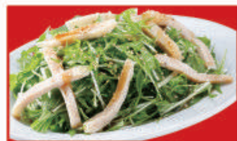
蒸し鶏の和風サラダ