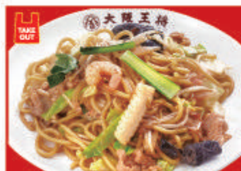
もちもち太麺の炒め焼きそば 730円(税込)