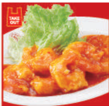
海老のチリソース