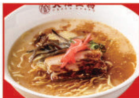
黒とんこつラーメン 680円(税込)