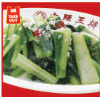
青菜ガーリック炒め