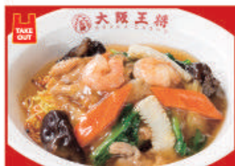
広東あんかけ焼きそば 819円(税込)