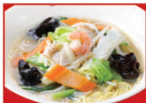
野菜タンメン 830円(税込)