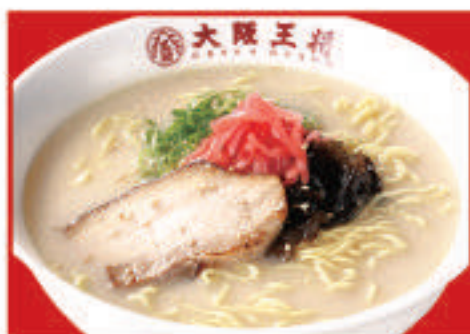
とんこつラーメン 650円(税込)