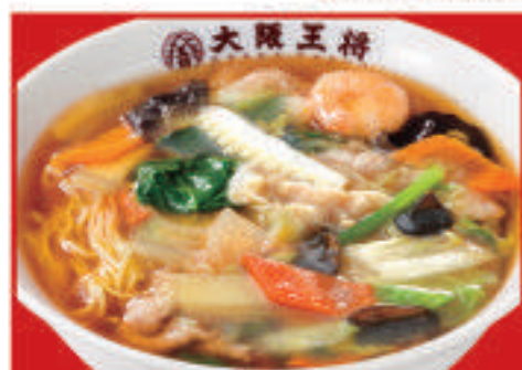
五目あんかけラーメン 800円(税込)