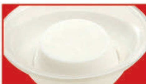
さわやか杏仁豆腐 330円(税込)