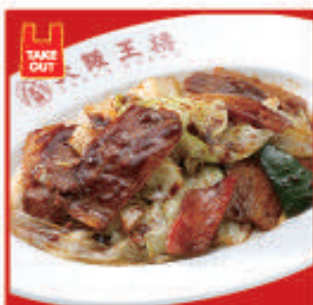
ごちそうキャベツの 回鍋肉