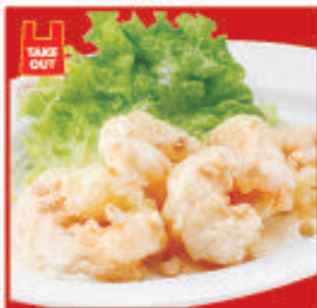
海老のマヨネーズ