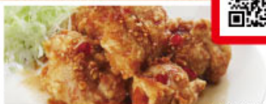
写真は名物旨から!です