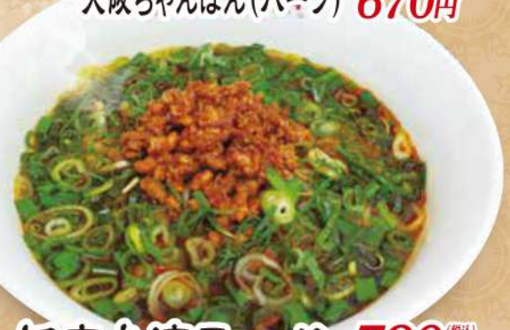
旨辛台湾ラーメン 790円 (税込)