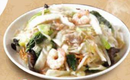
TAKE OUT 皿うどん 750円 (税込)