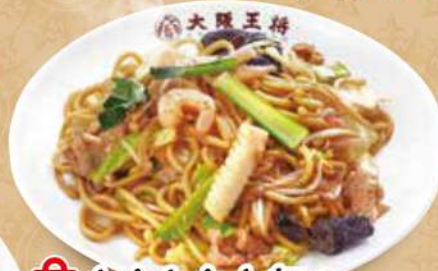
TAKE OUT もちもち太麺の 炒め焼きそば 750円 (税込)