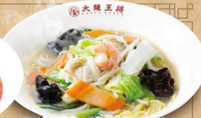
大阪ちゃんぽん 860円 (税込) 大阪ちゃんぽん(ハーフ) 670円 (税込)