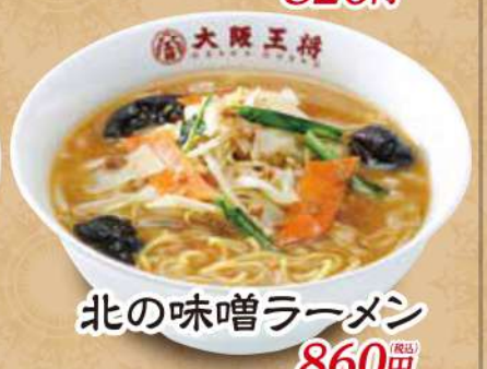
北の味噌ラーメン 860円 (税込)