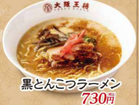
黒とんこつラーメン 730円 (税込)