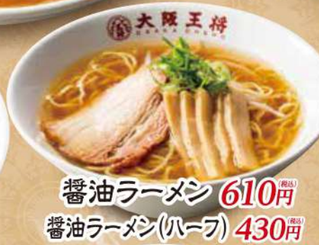
醤油ラーメン 610円 (税込) 醤油ラーメン(ハーフ) 430円 (税込)