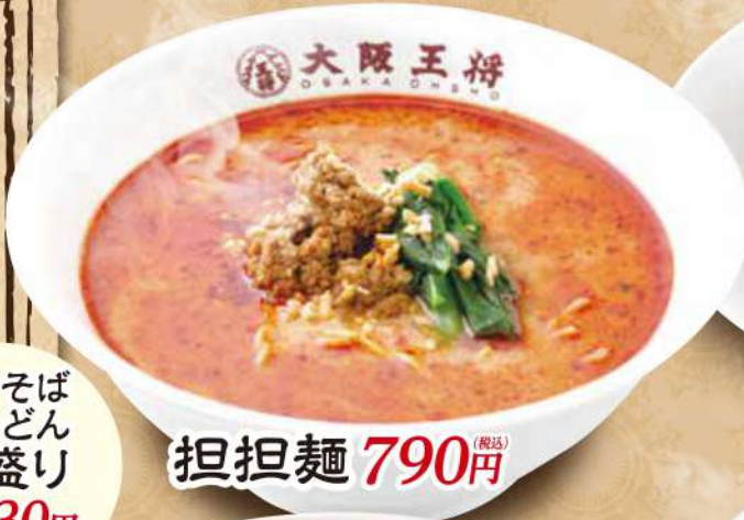
担担麺 790円 (税込)