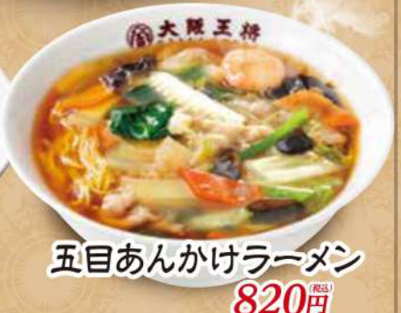
五目あんかけラーメン 820円 (税込)