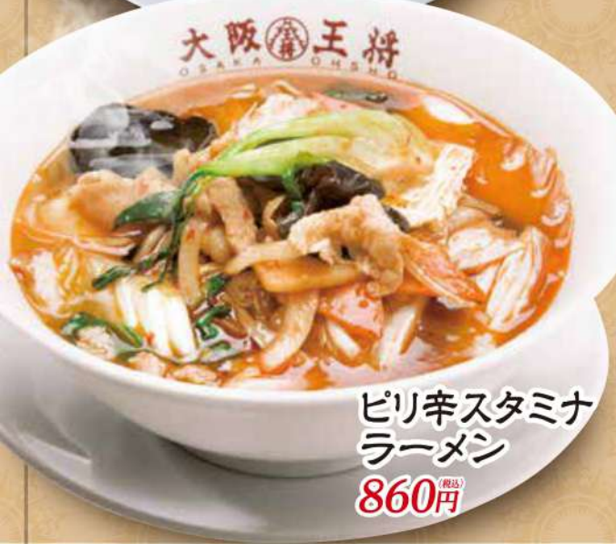
ピリ辛スタミナ ラーメン 860円 (税込)