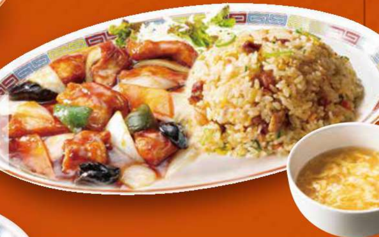
酢豚チャーハンコンビ 酢豚・五目炒飯・スープ 1,050円 (税込)