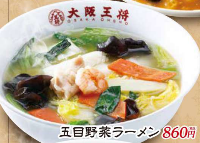
五目野菜ラーメン 860円 (税込)