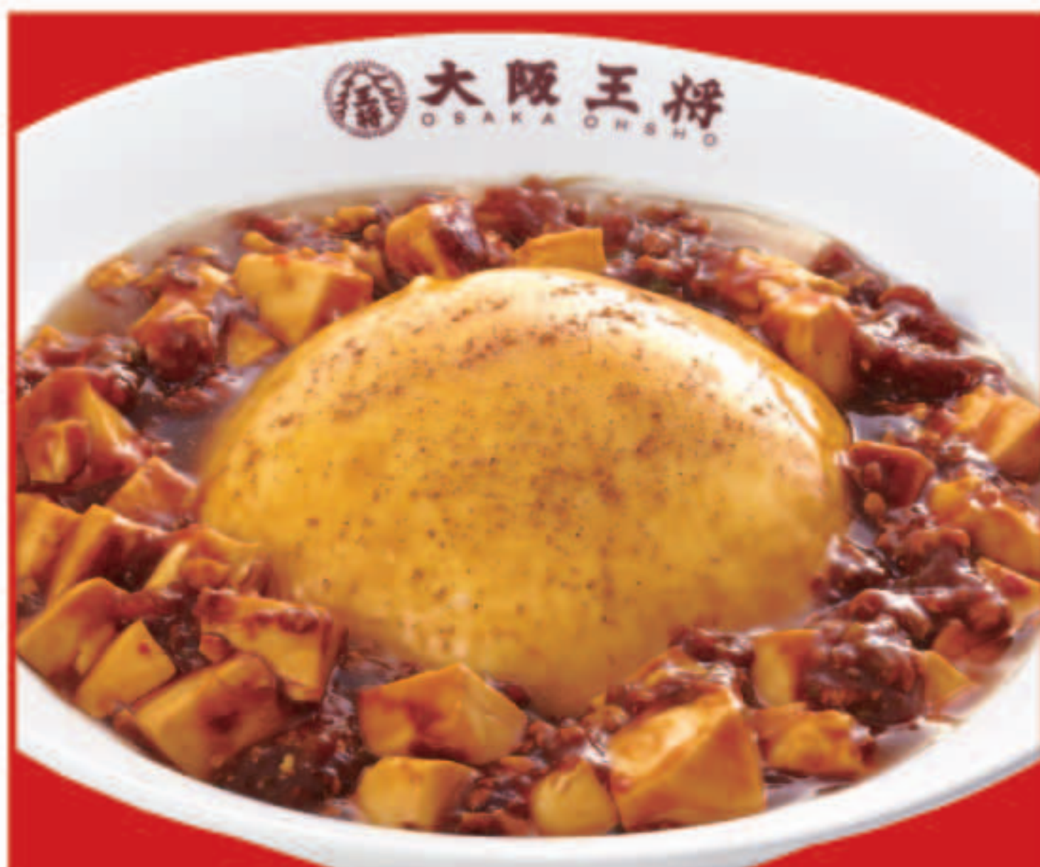
ふわとろ麻婆天津飯 820円(税込)