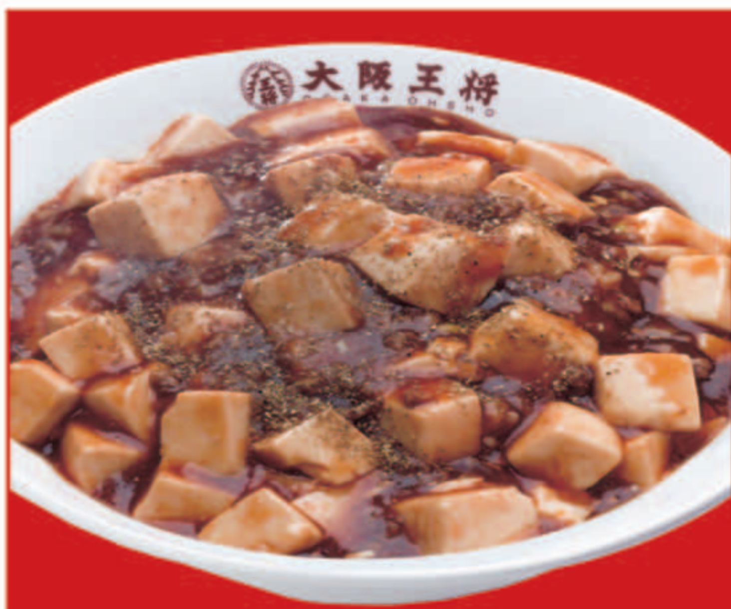
四川麻婆丼 710円(税込) 四川麻婆丼(小) 450円(税込)