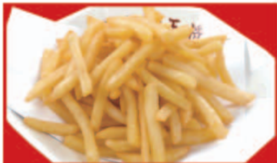
フライドポテト 380円(税込)