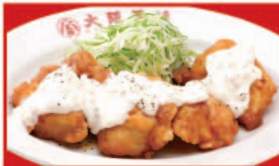
チキン南蛮 680円(税込)