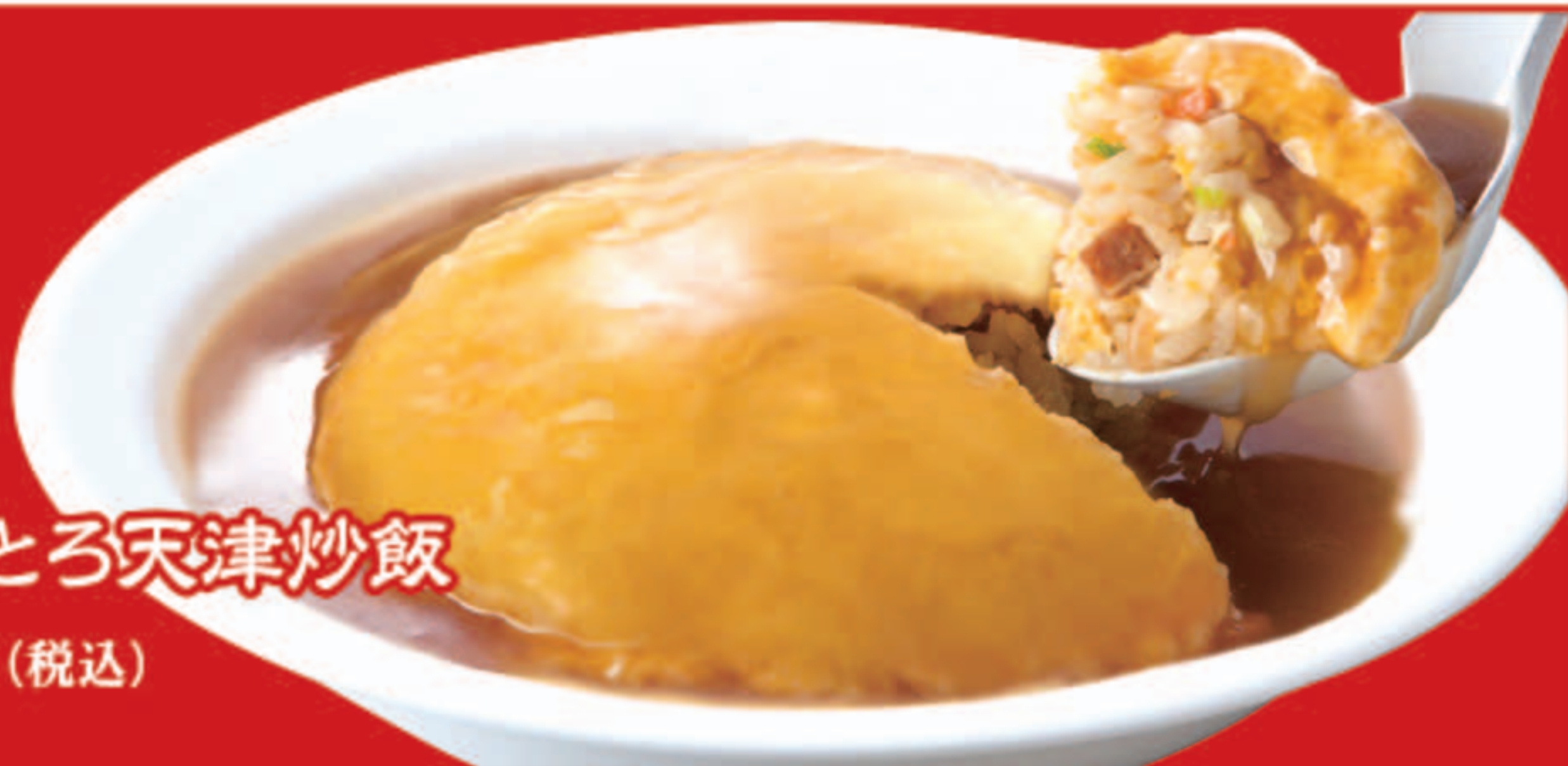
ふわとろ天津炒飯 780円(税込)