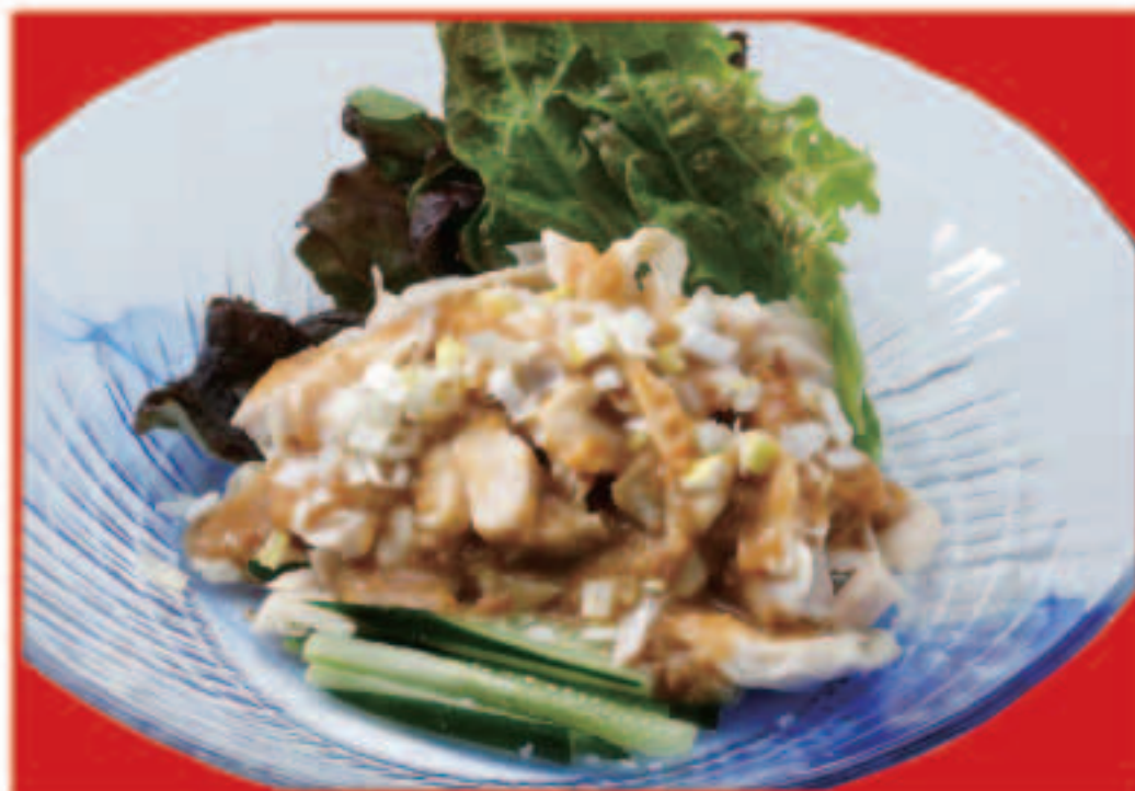
バンバンジー 550円(税込)