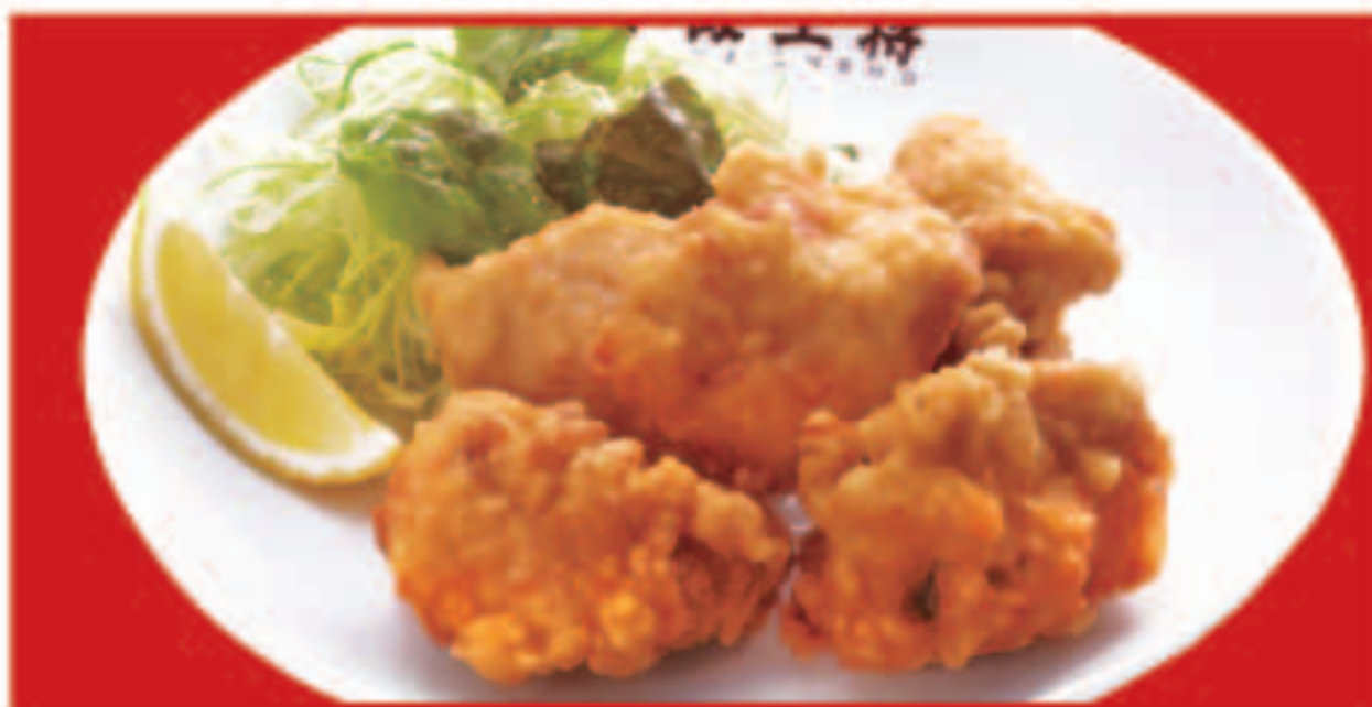
唐揚げ 5個 710円(税込)