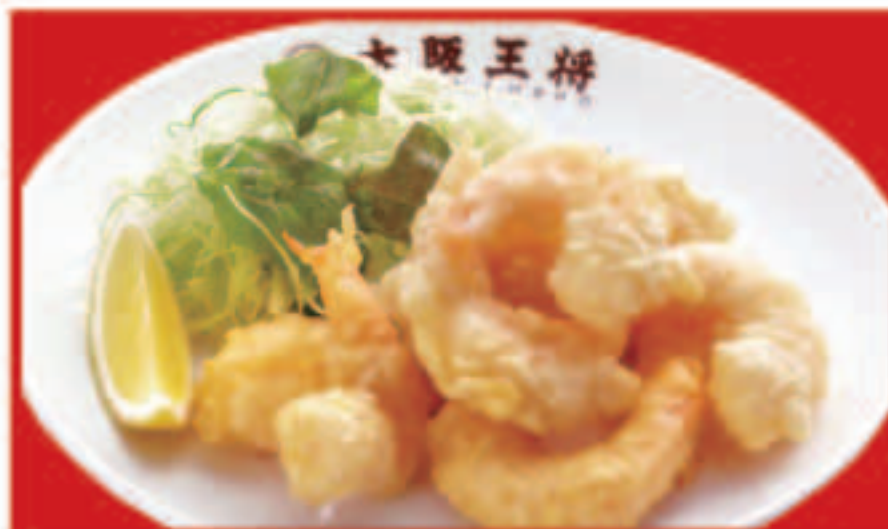
小海老の 天ぷら 690円(税込)