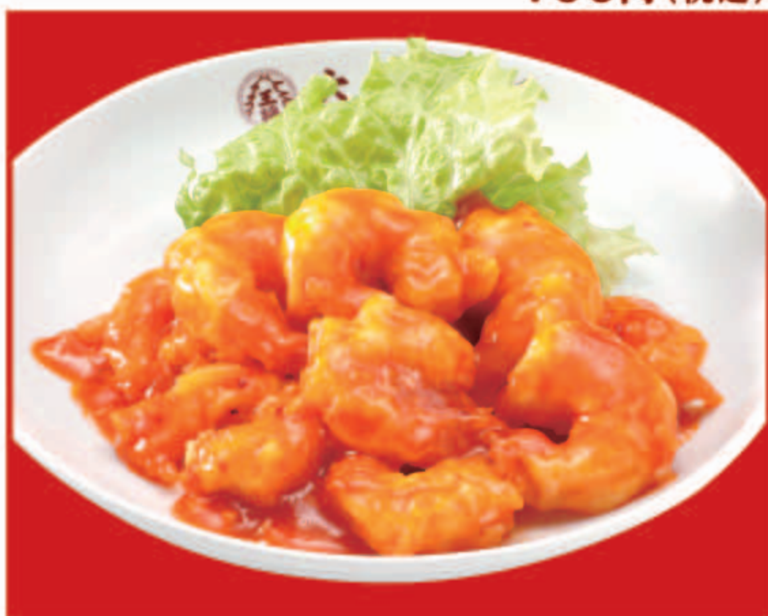
海老のチリソース