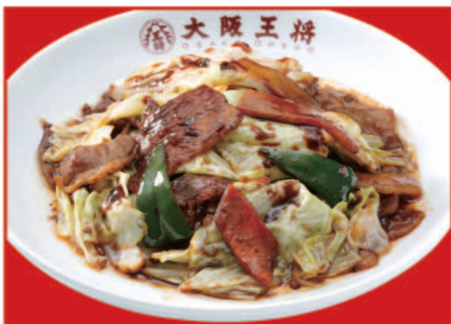
ごちそうキャベツの回鍋肉