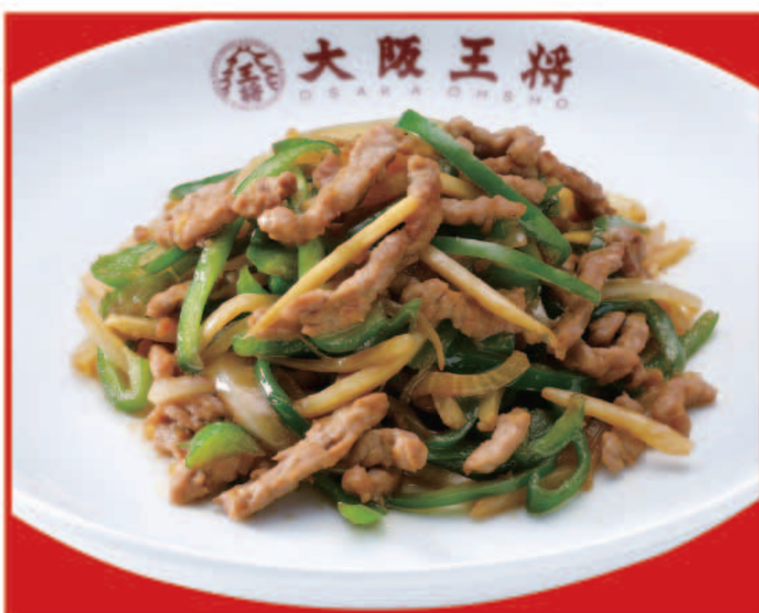
チンジャオロース