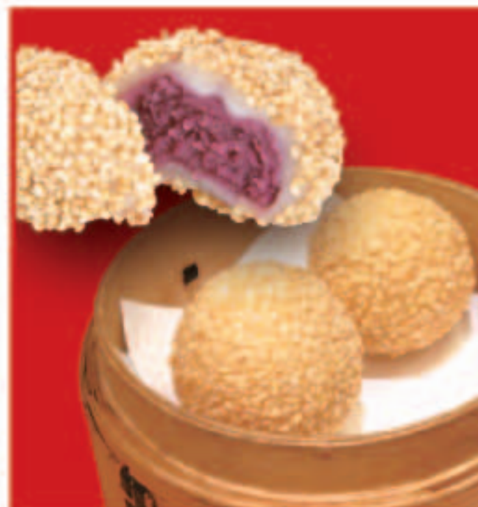
紫芋のゴマ団子 360円(税込)