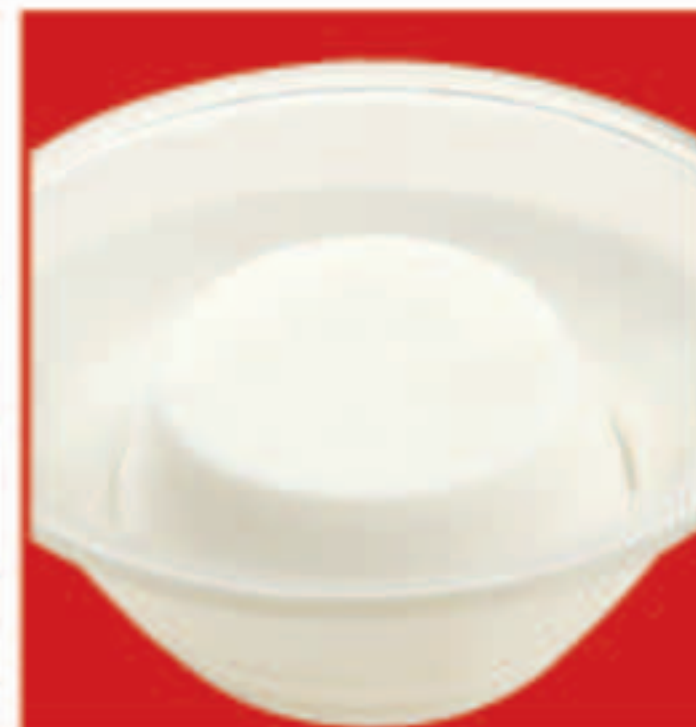
さわやか杏仁豆腐 340円(税込)