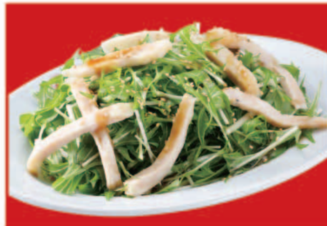
水菜と蒸し鶏のサラダ 550円(税込)