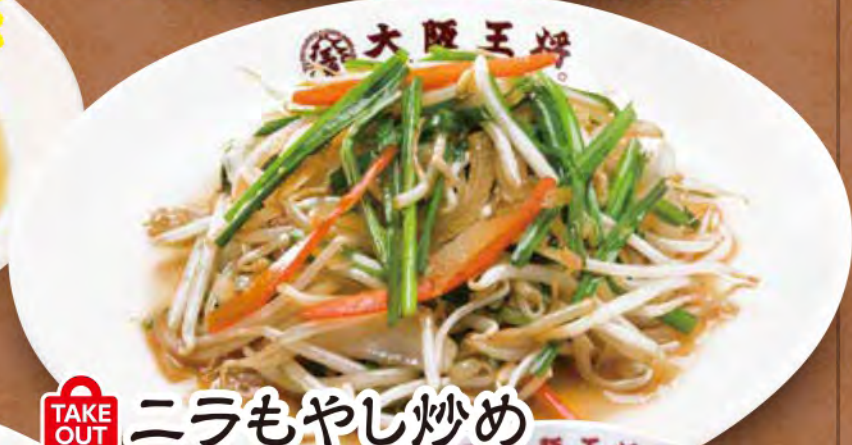
TAKE OUT ニラもやし炒め 680円 (税込)