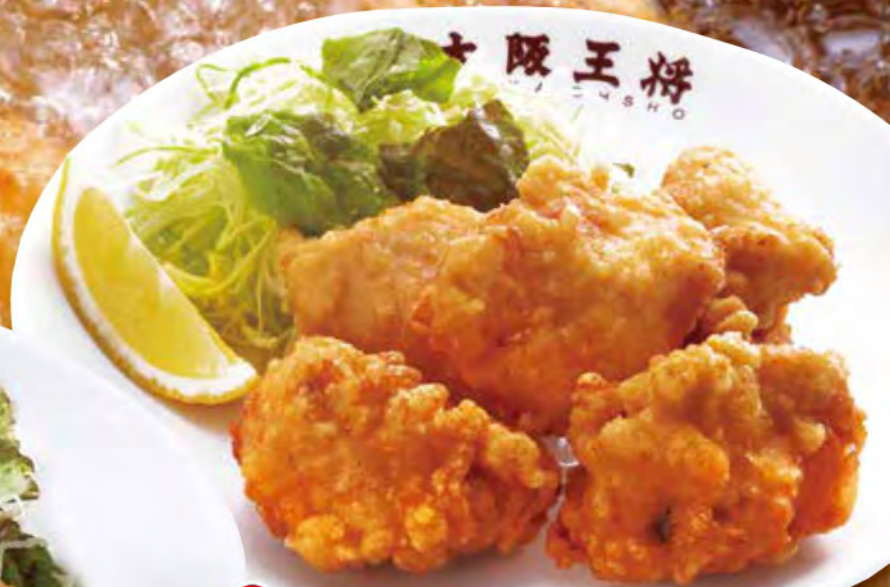
TAKE OUT 唐揚げ 5個 650円 (税込)