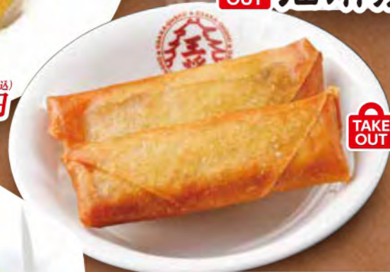
TAKE OUT 春巻 2本 350円 (税込)