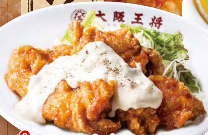
TAKE OUT チキン南蛮 680円 (税込)