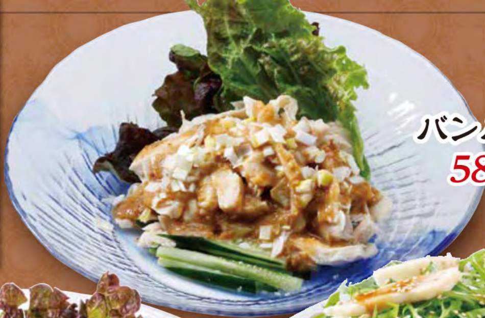
バンバンジー 580 (税込) 円