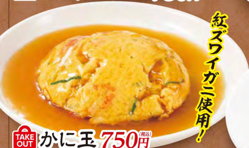
TAKE OUT かに玉 750円 (税込)