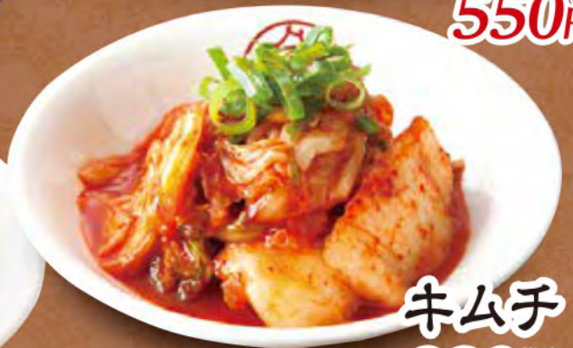
キムチ 330 (税込) 円