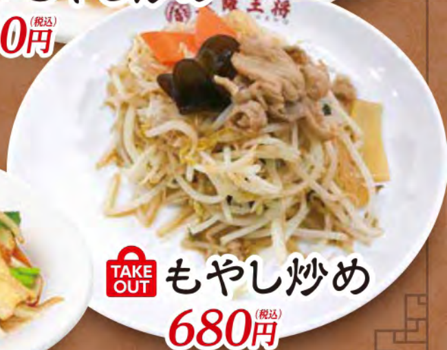
TAKE OUT もやし炒め 680円 (税込)