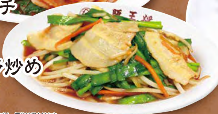
TAKE OUT 肉ニラ炒め 740円 (税込)