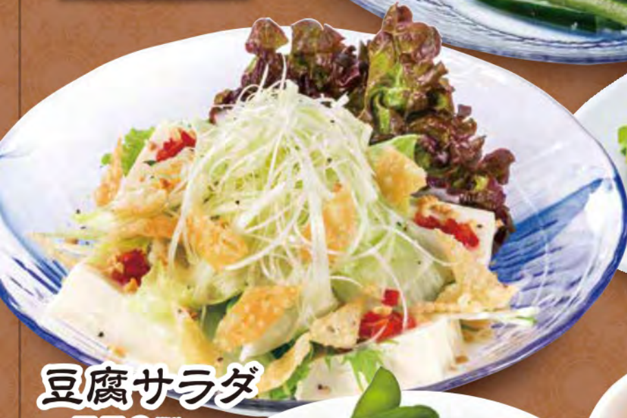
豆腐サラダ 550 (税込) 円