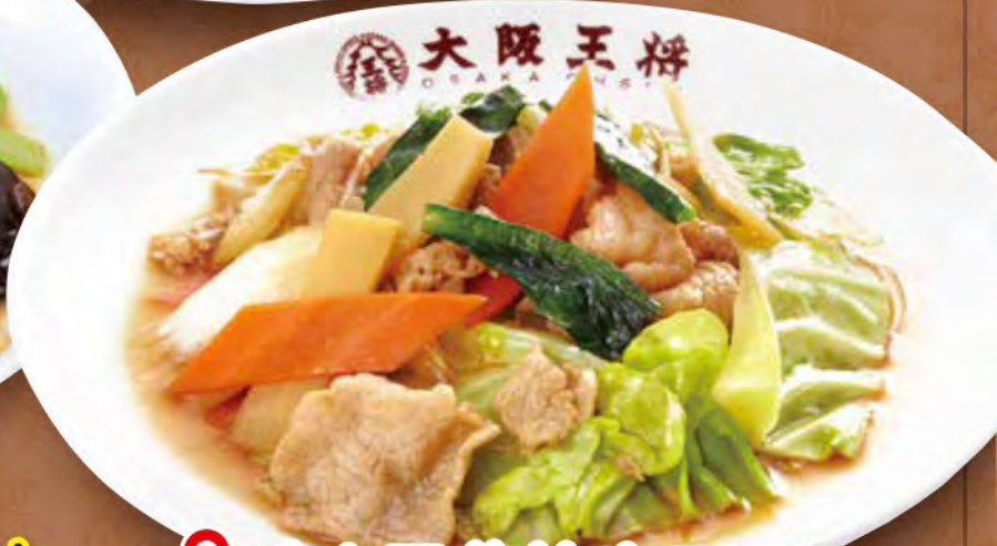
TAKE OUT 肉と野菜炒め 730円 (税込)