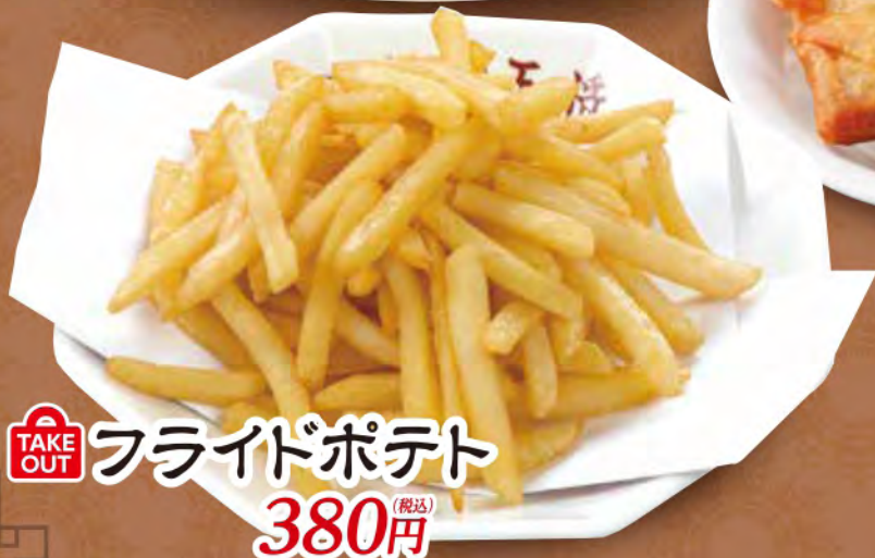
TAKE OUT フライドポテト 380円 (税込)