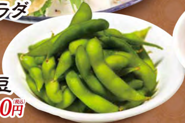
枝豆 300 (税込) 円