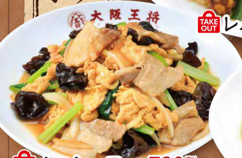
TAKE OUT ムーシーロー 780円 (税込)