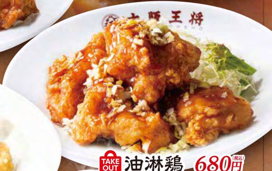
TAKE OUT 油淋鶏 680円 (税込)