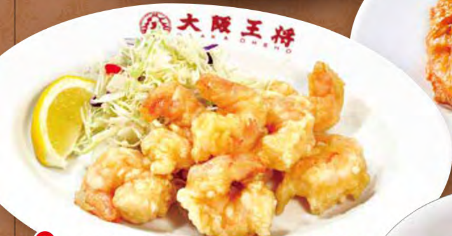
TAKE OUT 小海老の天ぷら 750円 (税込)