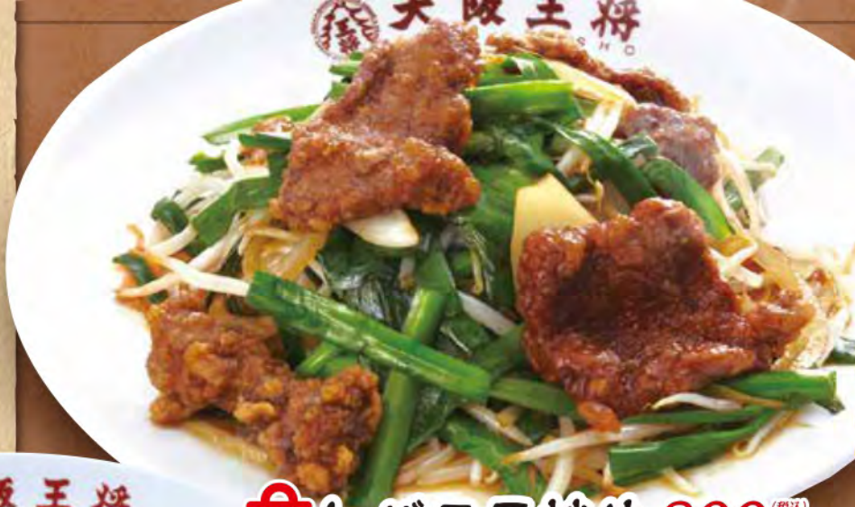
TAKE OUT レバニラ炒め 800円 (税込)