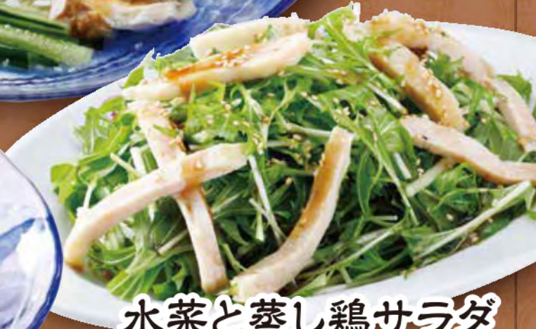
水菜と蒸し鶏サラダ 550 (税込) 円