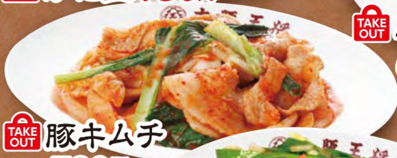
TAKE OUT 豚キムチ 780円 (税込)