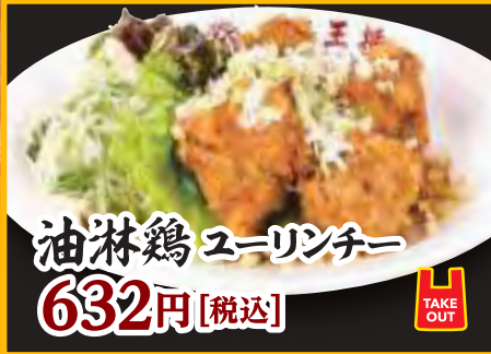
油淋鶏 ユーリンチー 632円 [税込]