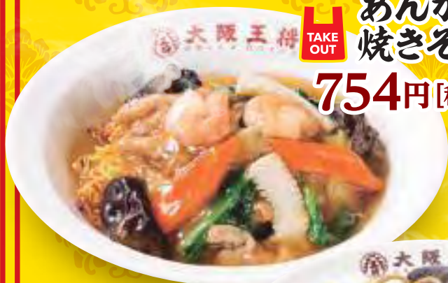
あんかけ 焼きそば