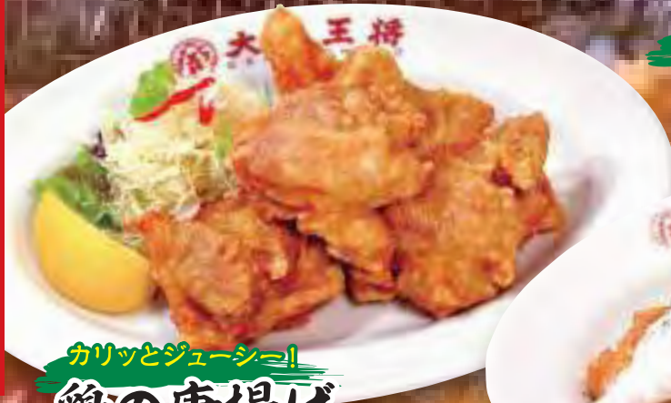
カリッとジューシー! 鶏の唐揚げ