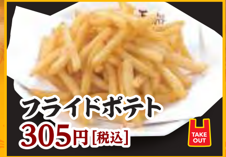
フライドポテト 305円 [税込]