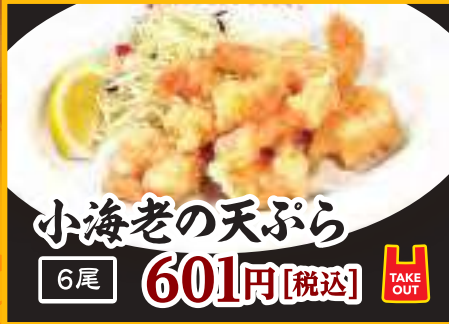
小海老の天ぷら 6尾 601円 [税込]