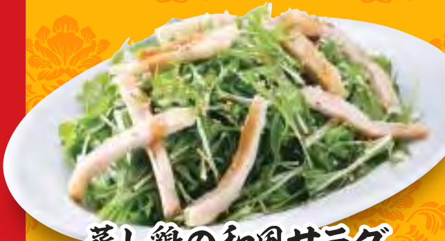
蒸し鶏の和風サラダ 437円 [税込]