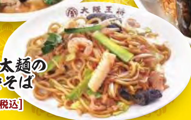
もちもち太麺の 炒め焼きそば