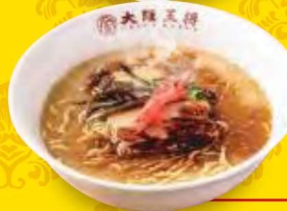
黒とんこつ ラーメン