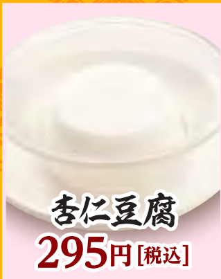
杏仁豆腐 295円 [税込]