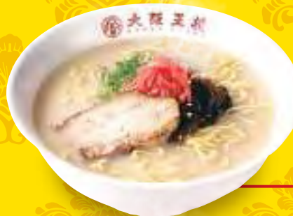
とんこつ ラーメン