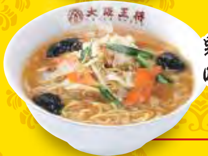
野菜たっぷり 味噌ラーメン