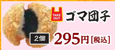
2個 295円 [税込]