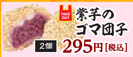
2個 295円 [税込]