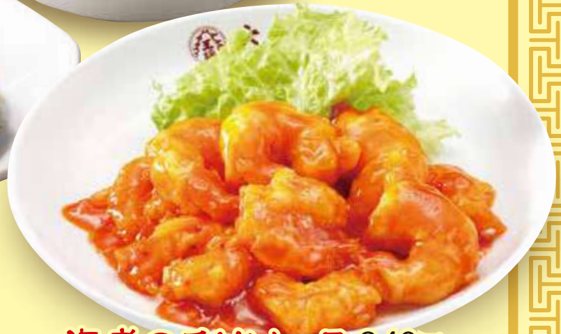
海老のチリソース 840円(税込)