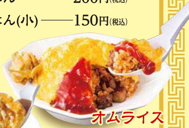
オムライス 790円(税込)