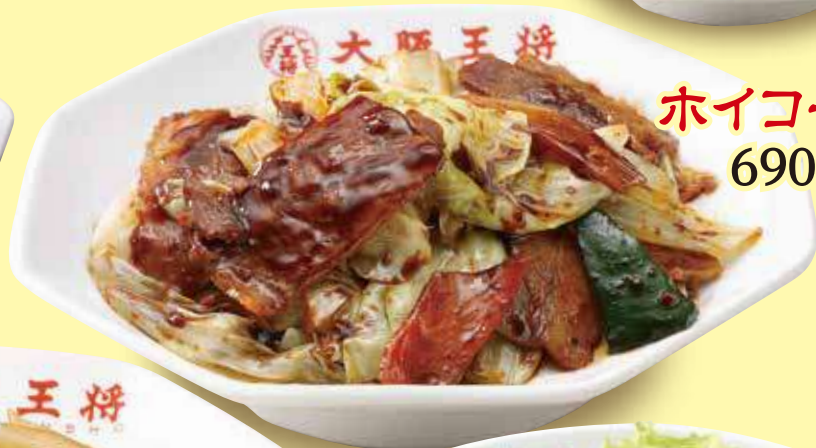
ホイコーロー 690円(税込)