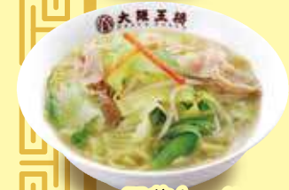
野菜たっぷり タンメン