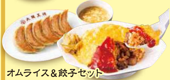
オムライス&餃子セット

王将セット ————— 1,190円(税込) 元祖焼餃子1人前、中華そば、半炒飯