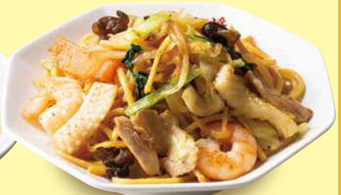
炒め焼きそば 790円(税込)