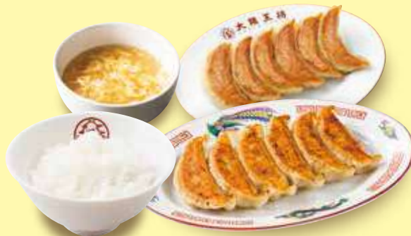
元祖&ニンニク餃子定食

ニンニク肉肉肉餃子定食シングル 690円(税込) ニンニク肉肉肉餃子1人前・ごはん・スープ