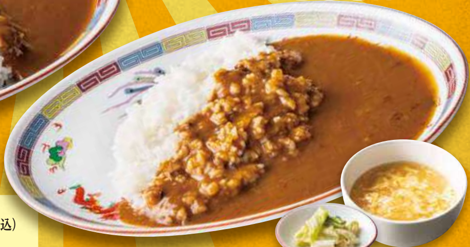
大阪カレー 790円 (税込)