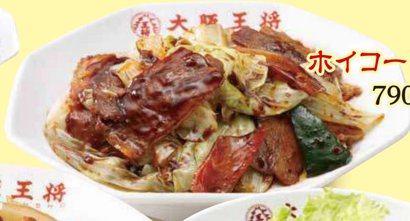
ホイコーロー 790円(税込)