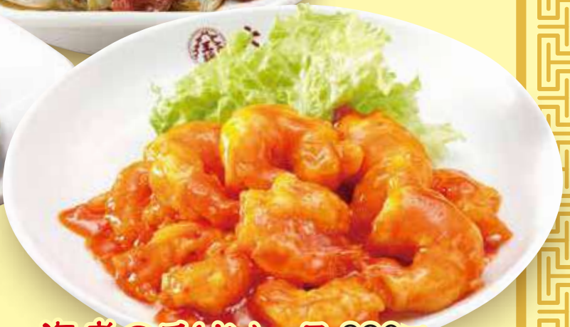
海老のチリソース 890円(税込)