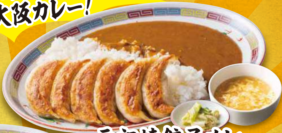
元祖焼餃子カレー 1,040円 (税込)