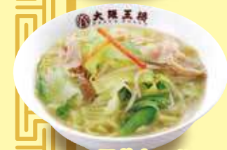
野菜たっぷり タンメン