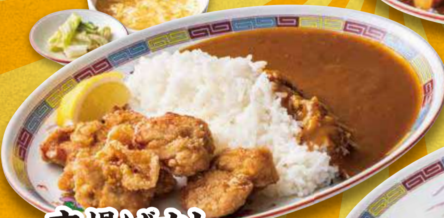
唐揚げカレー 1,090円 (税込)