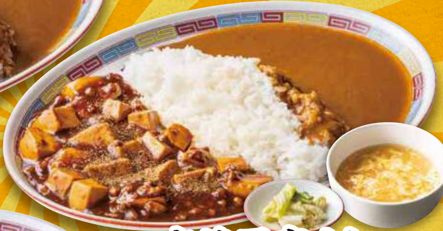
麻婆豆腐カレー 1090円 (税込)