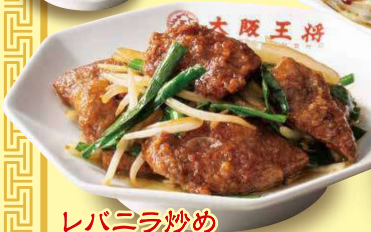
レバニラ炒め 740円(税込)