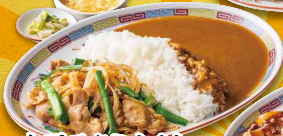
大阪スタミナカレー 990円 (税込)