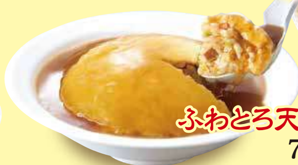
ふわとろ天津炒飯 790円(税込)