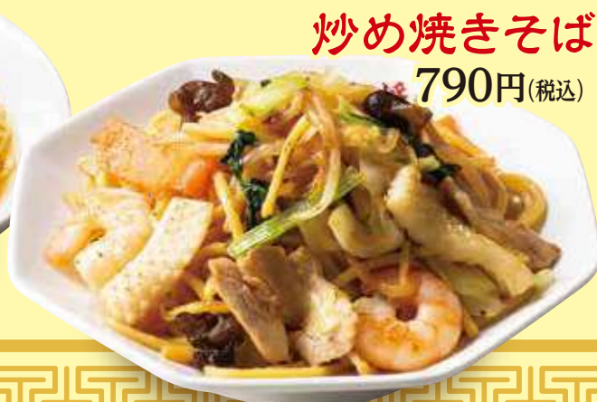
炒め焼きそば 790円(税込)