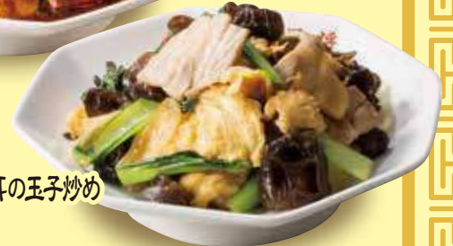
豚肉と木耳の玉子炒め