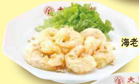
海老のマヨネーズ