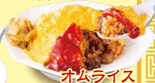
オムライス 790円(税込)