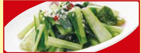
青菜のガーリック炒め 税込490円