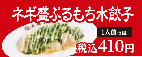
ネギ盛ぷるもち水餃子