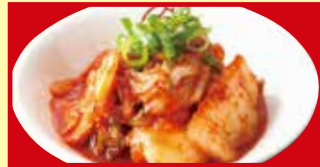
白菜キムチ 税込190円