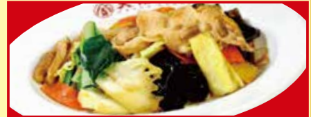
肉と野菜炒め 税込490円