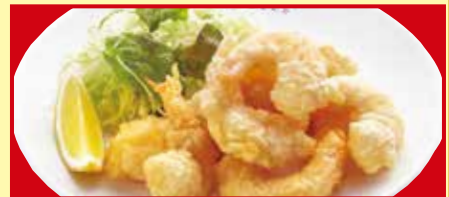
小エビの天ぷら 税込790円