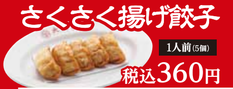
さくさく揚げ餃子