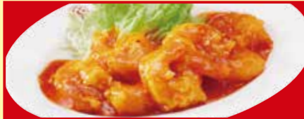
海老のチリソース 税込690円