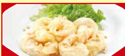
海老のマヨネーズ 税込840円