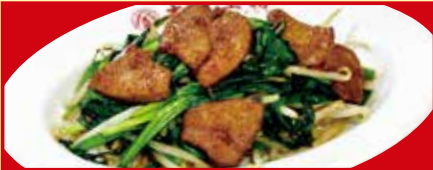
レバニラ炒め 税込540円