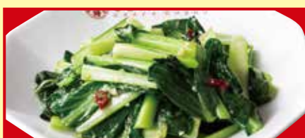
青菜のガーリック炒め 税込590円