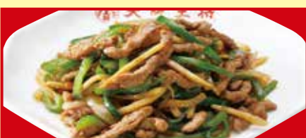
チンジャオロース 税込890円