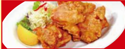
鶏のから揚げ 税込490円