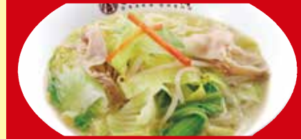
野菜たっぷりタンメン