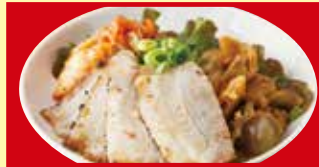
おつまみ3種盛り ザーサイ・キムチ・チャーシュー 税込590円