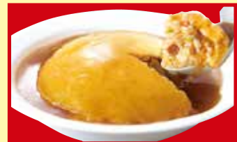
ふわとろ天津炒飯