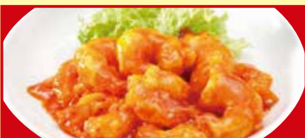
海老のチリソース 税込890円