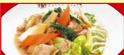
肉と野菜炒め 税込690円