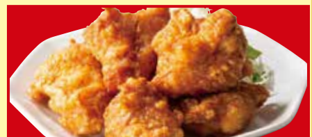
鶏のから揚げ 税込690円