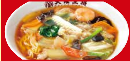
五目あんかけラーメン