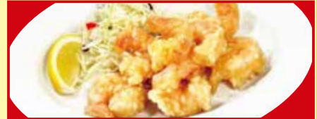
小エビの天ぷら 税込490円