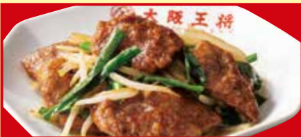
レバニラ炒め 税込740円