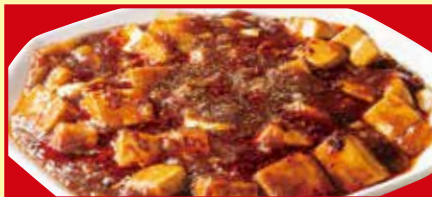
四川麻婆豆腐 税込690円