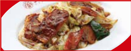
ホイコーロー 税込590円