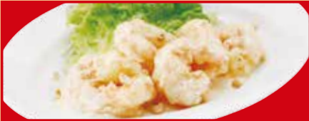
海老のマヨネーズ 税込590円