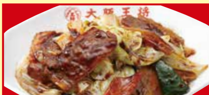
ホイコーロー 税込790円