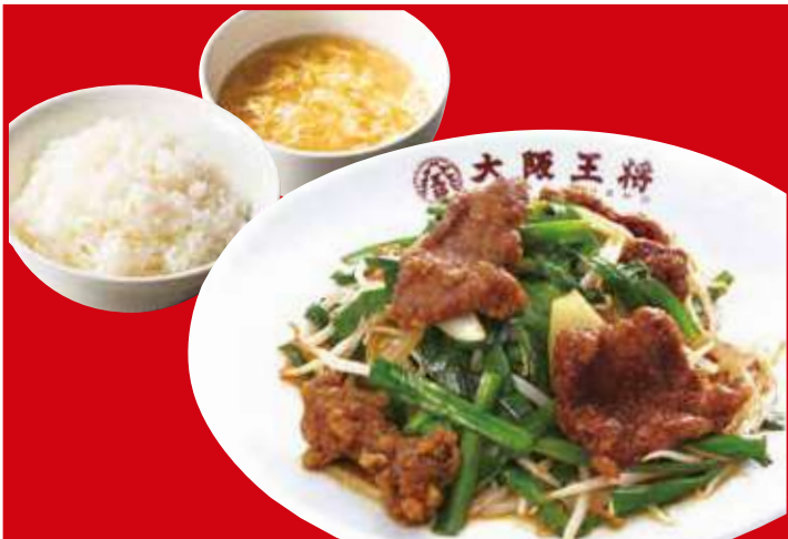
レバニラ定食 910円(税込) レバニラ炒め・ご飯・スープ