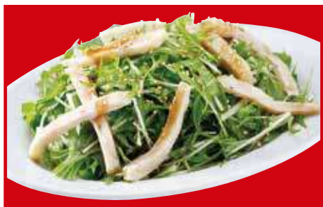
蒸し鶏の和風サラダ