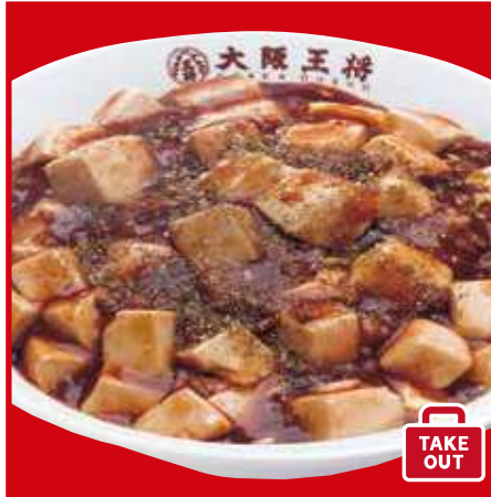
四川麻婆丼 700円(税込) 四川麻婆丼(ハーフ) 510円(税込)