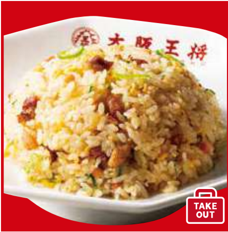
五目炒飯 550円(税込) 五目炒飯(ハーフ) 380円(税込)