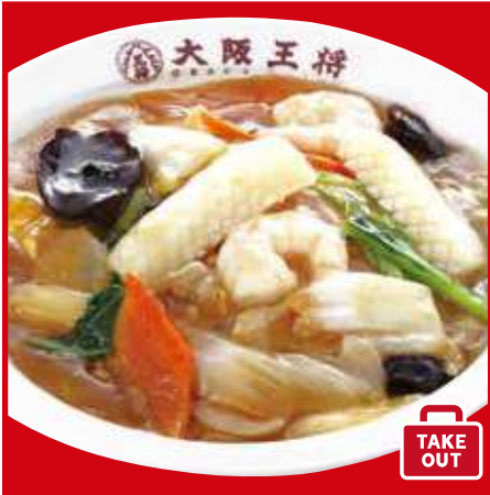
中華丼 700円(税込) 中華丼(ハーフ) 510円(税込)