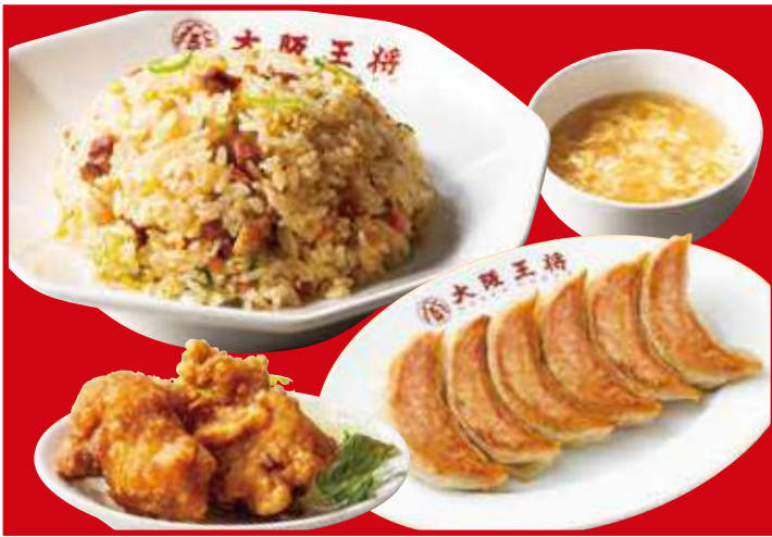
餃子セット 1,030円(税込) 餃子1人前・五目炒飯・唐揚げ2個・スープ