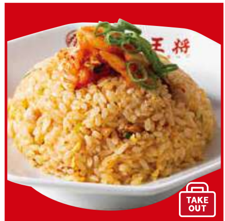
牛ム子炒飯 680円(税込)