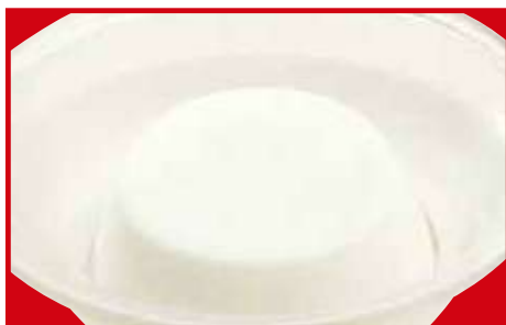
さわやか杏仁豆腐