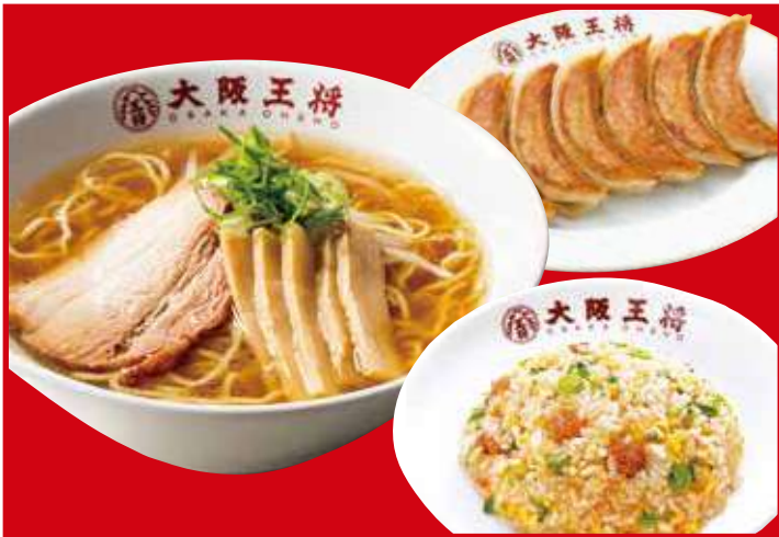
王将セット 1,220円(税込) 餃子1人前・中華そば・五目炒飯ハーフ