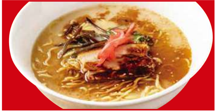
黒とんこつラーメン 650円(税込)