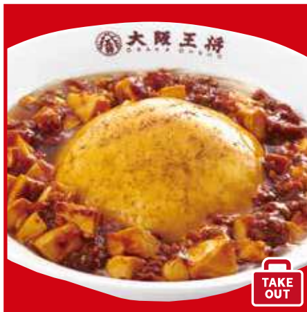
ふわとろ麻婆天津飯 760円(税込)