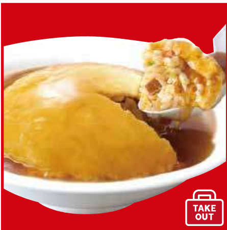
ふわとろ天津炒飯 730円(税込)