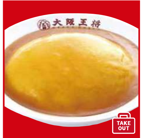
ふわとろ天津飯 500円(税込) ふわとろ天津飯(ハーフ) 380円(税込)