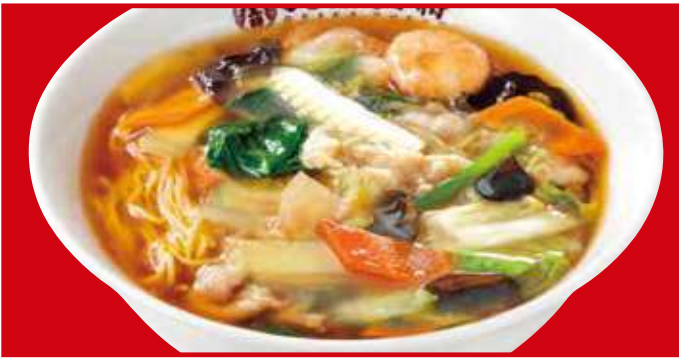
五目あんかけラーメン 790円(税込)