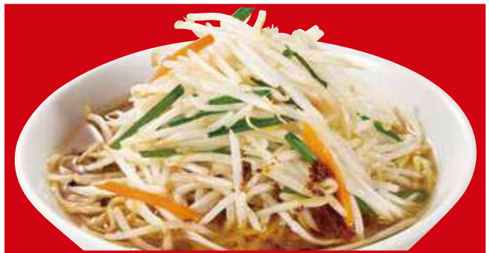
もやしそば 710円(税込)