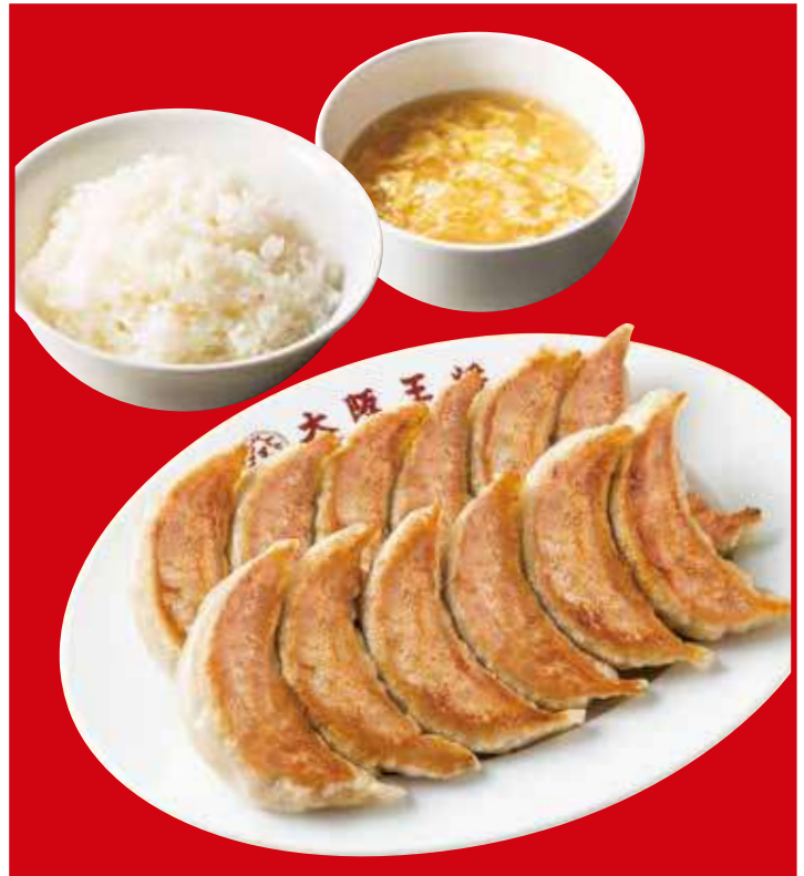
餃子定食ダブル 800円(税込) 餃子2人前・ご飯・スープ