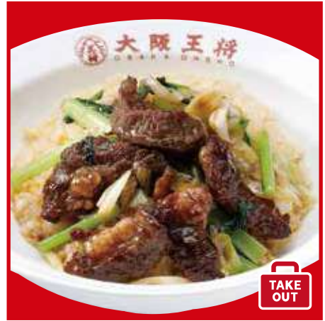
牛カルビ炒飯 930円(税込)