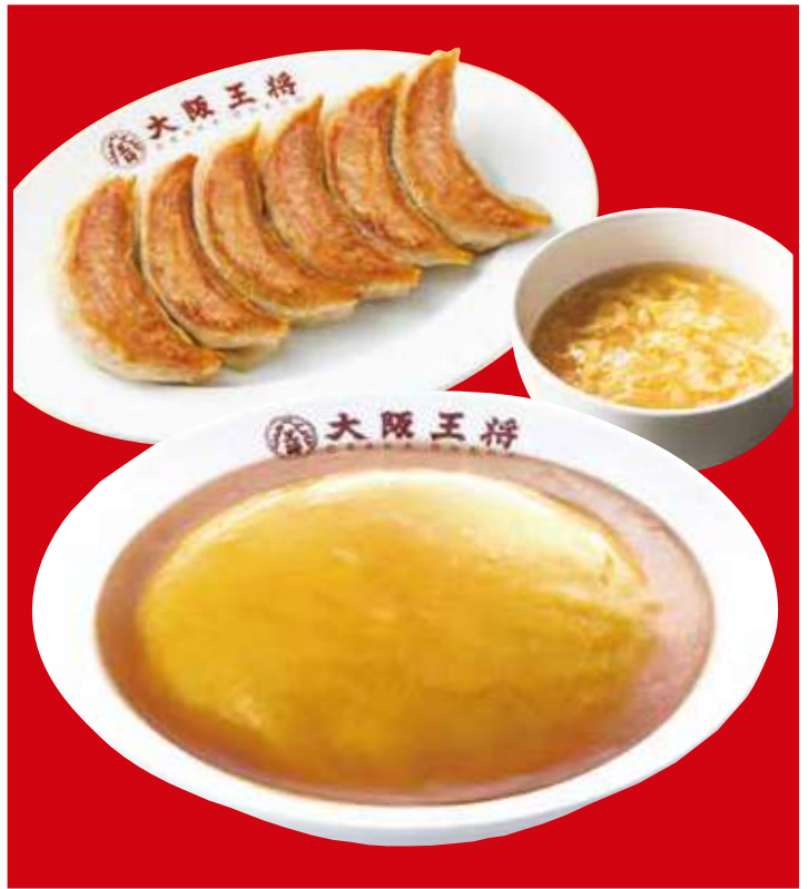
天津飯&餃子セット 770円(税込) 餃子1人前・天津飯・スープ