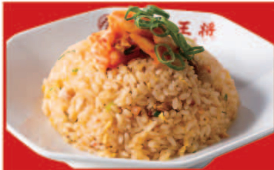
13 牛ムチ炒飯 700円(税込)