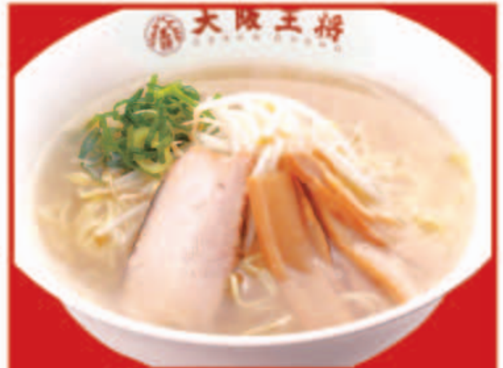
42 塩ラーメン 605円(税込)