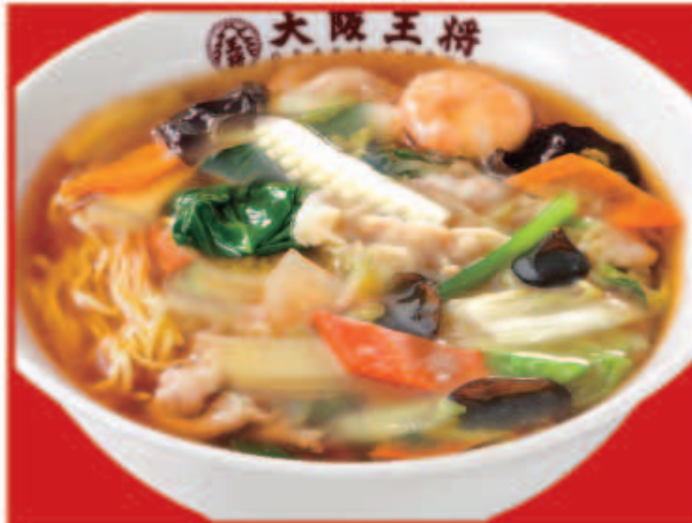
39 五目あんかけラーメン 800円(税込)