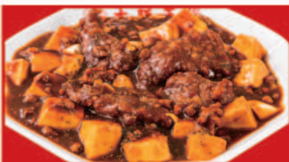
60 レバ入りカレー麻婆豆腐 800円(税込)