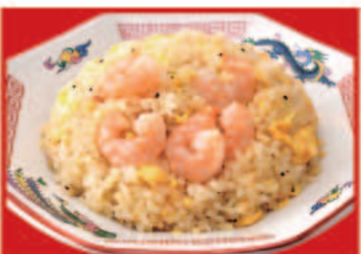
16 海老炒飯 790円(税込)