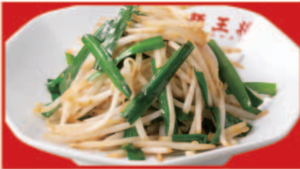
72 ニラもやし炒め 650円(税込)