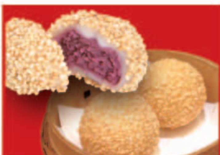
353 紫芋のゴマ団子 295円(税込)