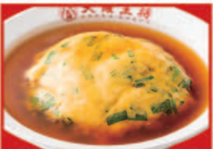
25 ニラ玉天津飯 650円(税込)