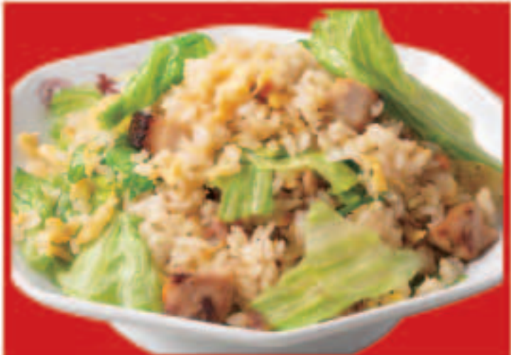
20 焼豚レタス炒飯 820円(税込)