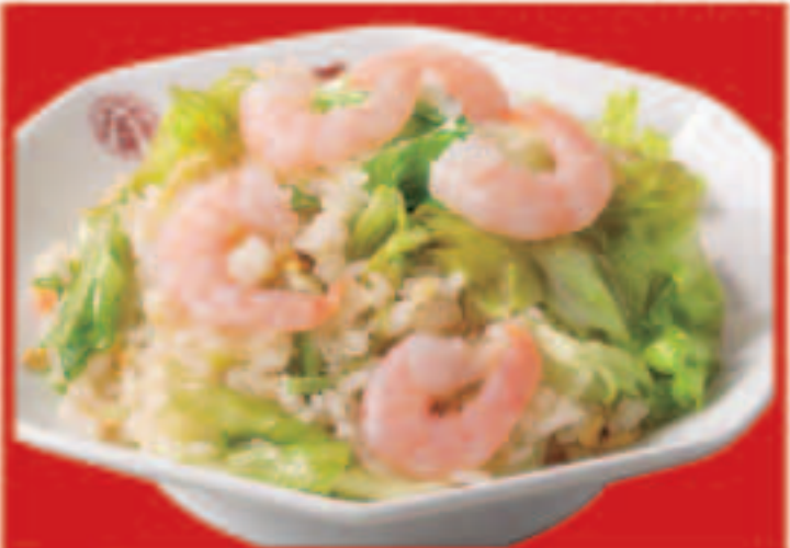
127 海老レタス炒飯 820円(税込)