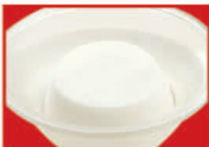
350 さわやか杏仁豆腐 295円(税込)