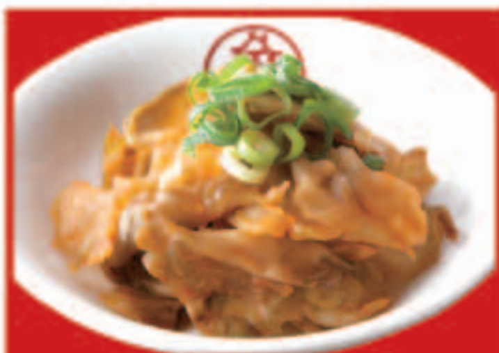
305 ザーサイ 295円(税込)