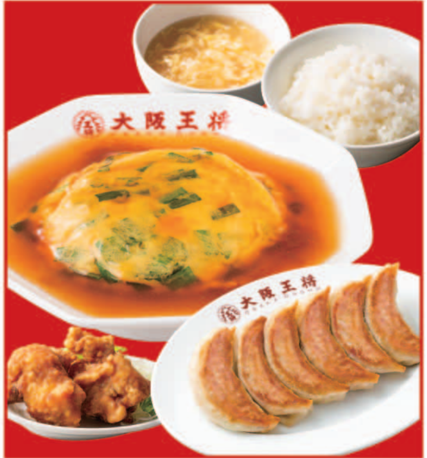
101 東高円寺定食 1,100円(税込) 餃子1人前、唐揚げ2個、ご飯、スープ、ニラ玉あんかけ