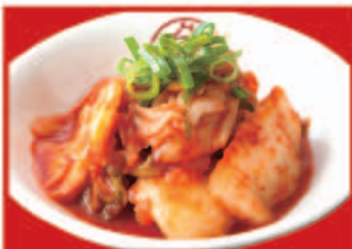
304 白菜キムチ 390円(税込)