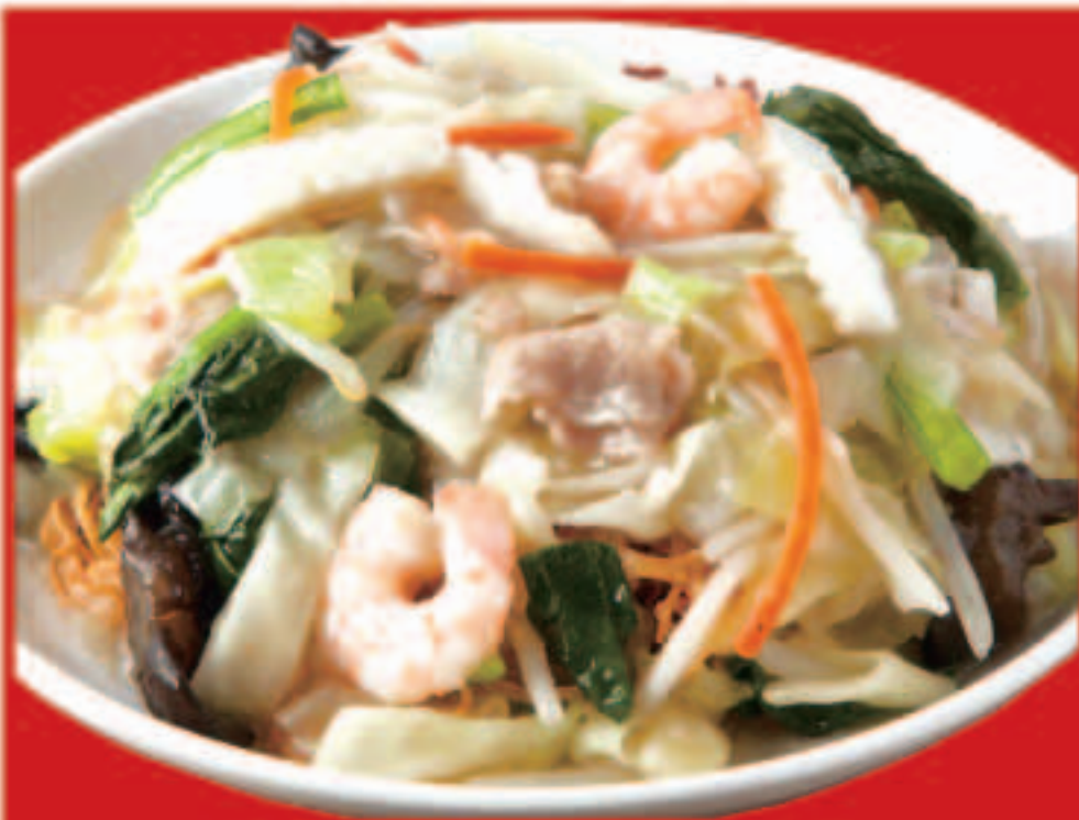
38 海鮮血うどん 900円(税込)