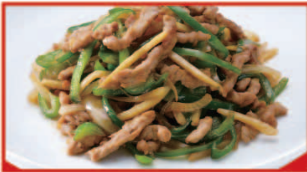
68 チンジャオロース 760円(税込)