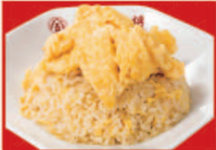
18 玉子たっぷり炒飯 650円(税込)