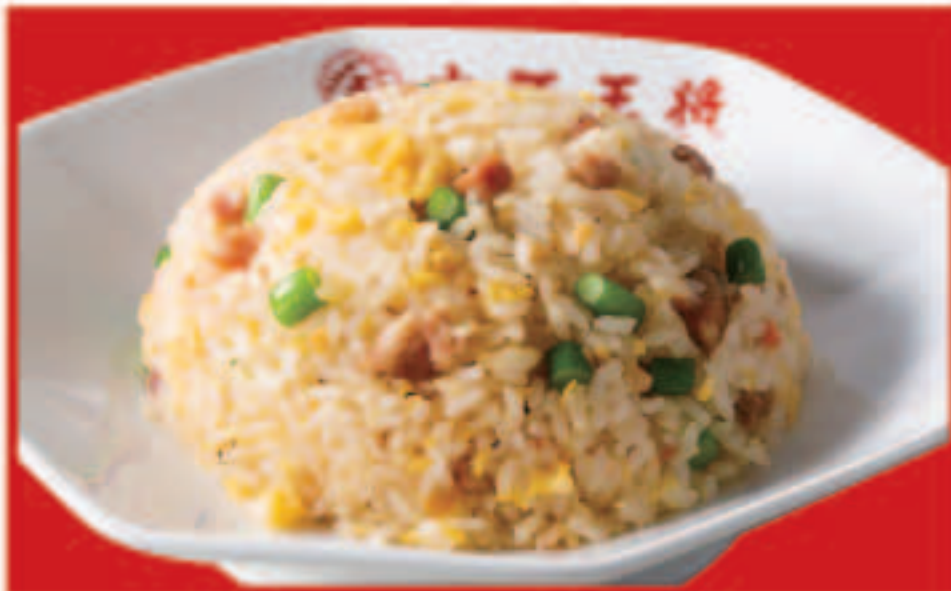
12 ガーリック炒飯 680円(税込)