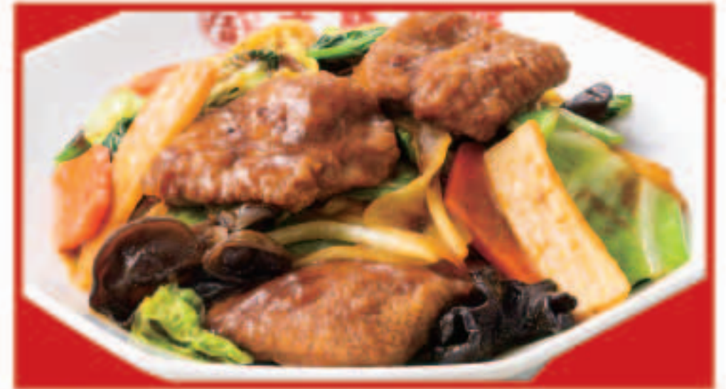
59 レバーと野菜のカレー炒め 960円(税込)