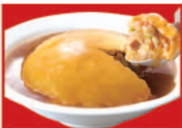
14 ふわとろ天津炒飯 770円(税込)