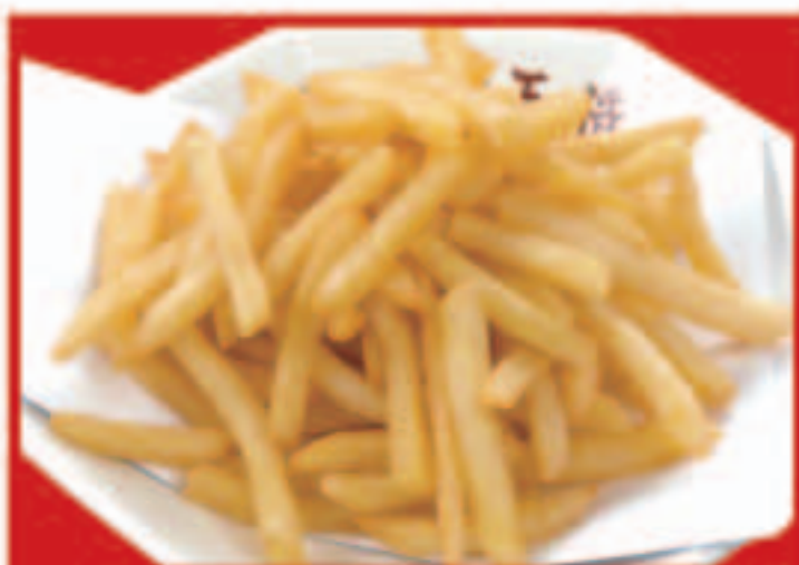
302 フライドポテト 430円(税込)