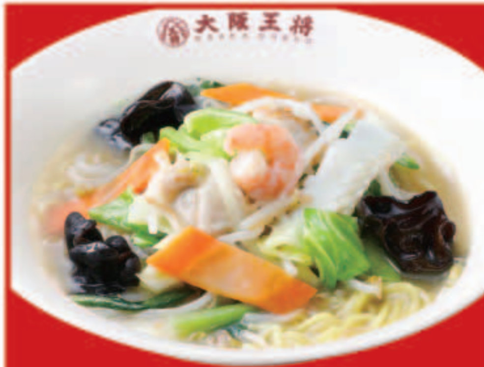
40 野菜タンメン 800円(税込)