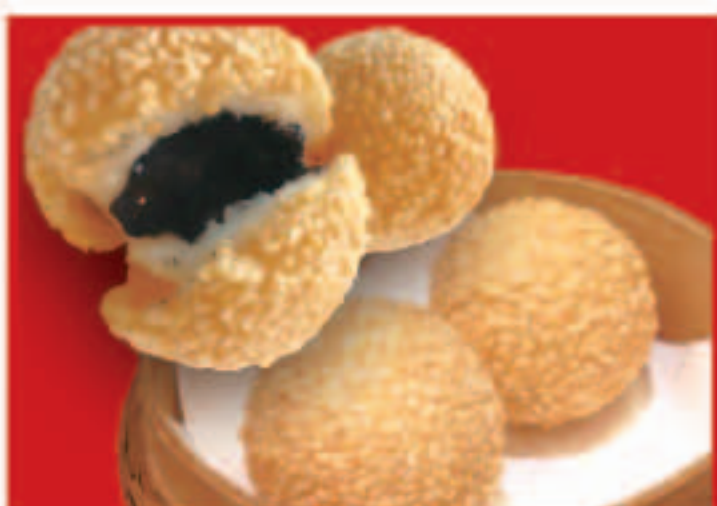
352 ゴマ団子 295円(税込)