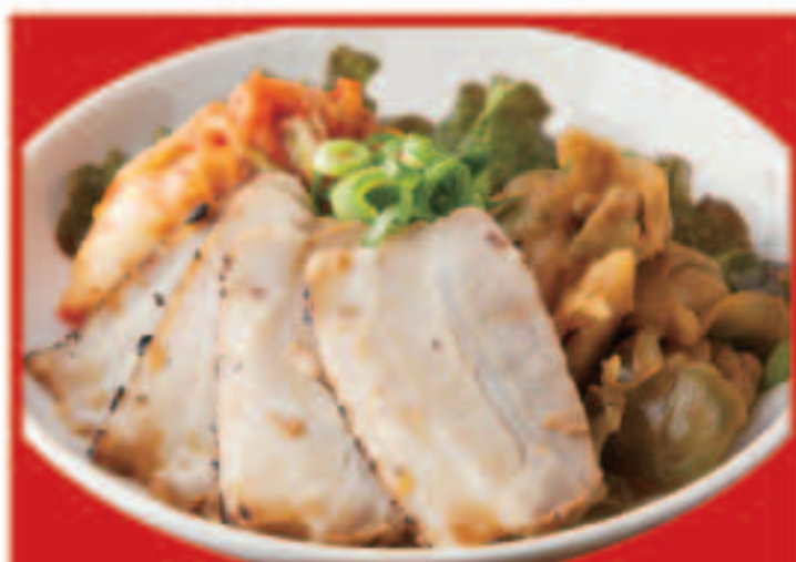
301 おつまみ三種盛り チャーシュー、 ザーサイ、キムチ 695円(税込)