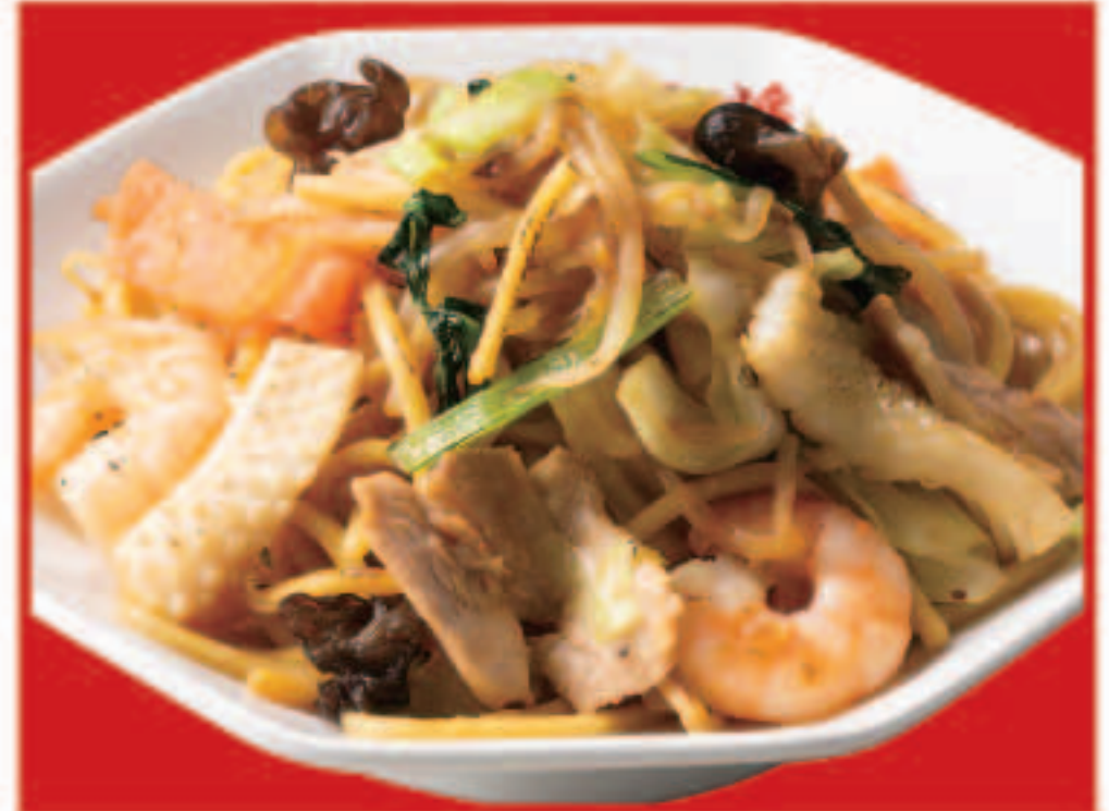
32 炒め焼きそば 770円(税込)