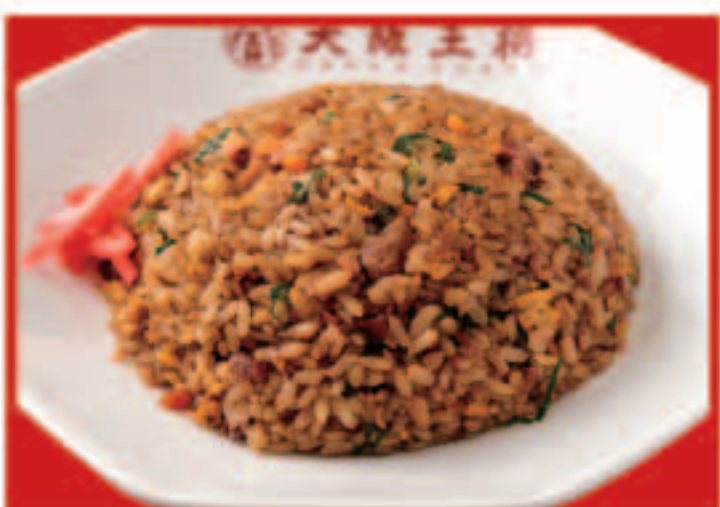
15 黒炒飯 598円(税込)