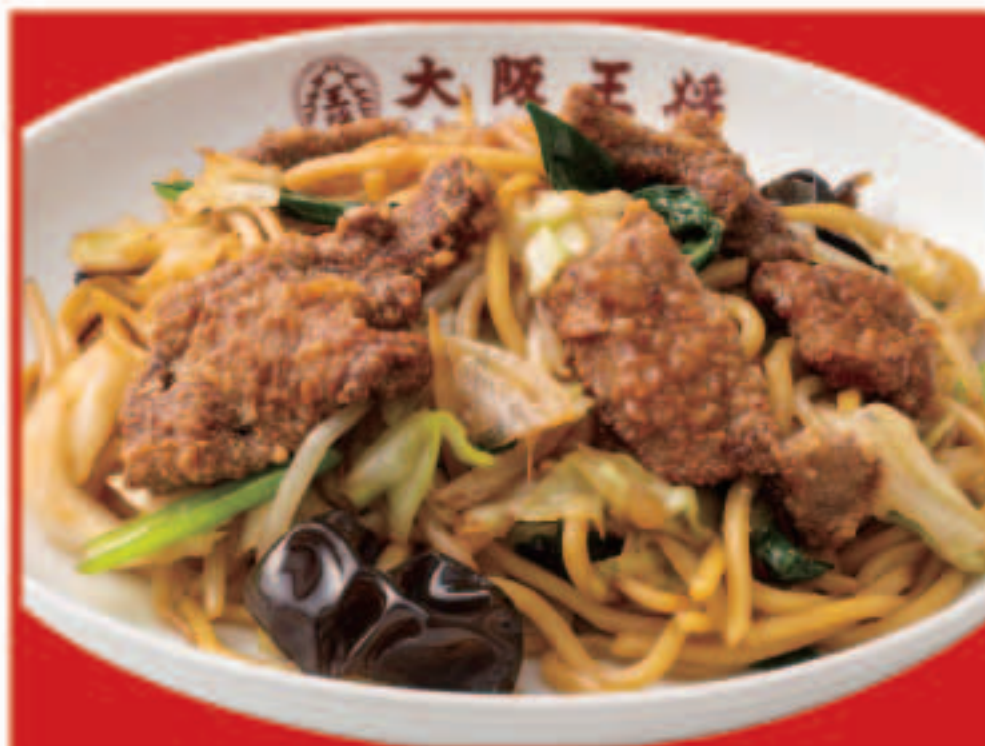
54 レバニラ焼きそば 890円(税込)