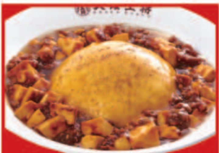
24 マーボー天津飯 820円(税込)