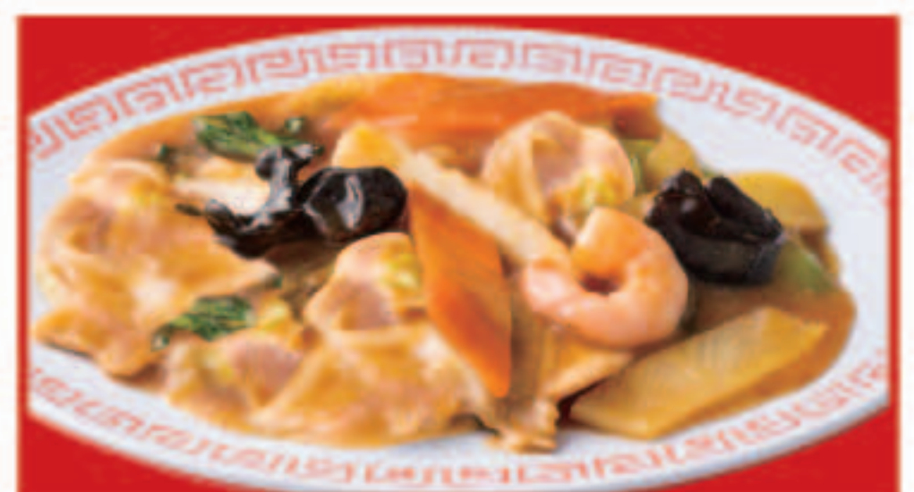
83 八宝菜 702円(税込)

※写真はイメージです。メニューに記載の金額は総額表示になります。お持ち帰りの際には金額が異なります。