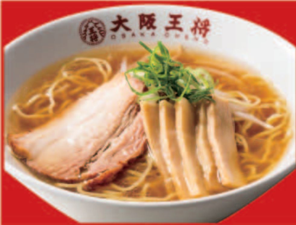
31 中華そば 630円(税込) 56 中華そば(小) 430円(税込)