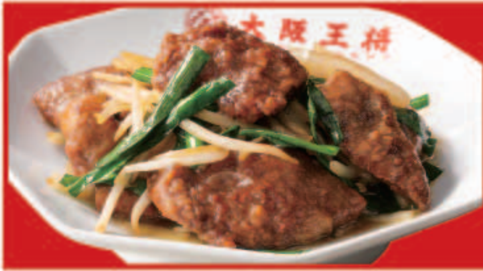
61 レバニラ炒め 700円(税込)