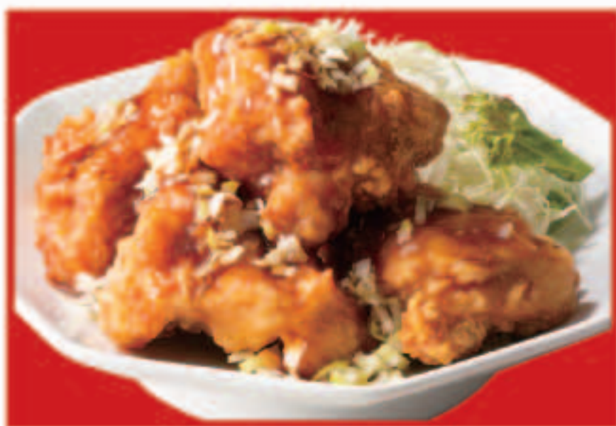
63 油淋鶏 695円(税込)