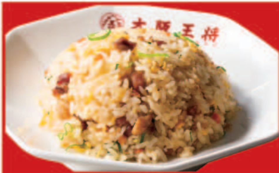
11 五目炒飯 580円(税込)