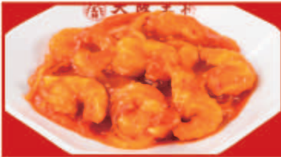
67 海老のチリソース 850円(税込)