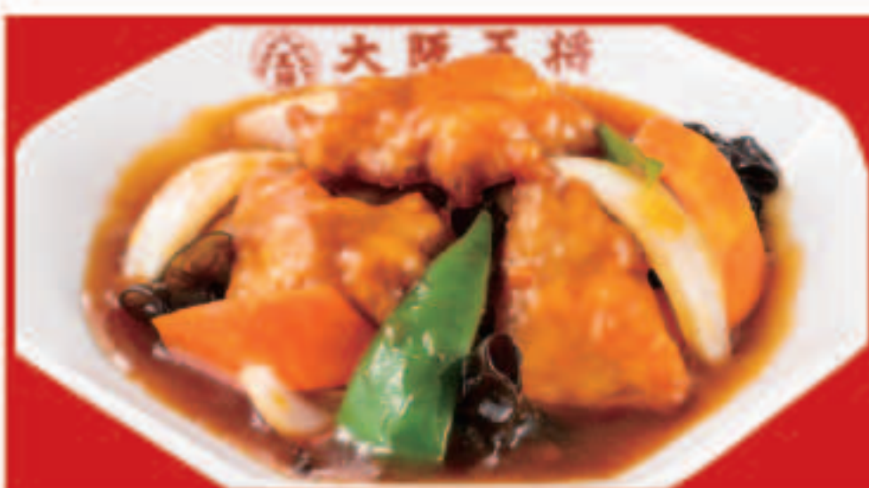
65 野菜たっぷり酢豚 800円(税込)