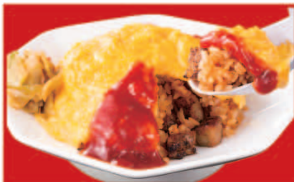
26 初恋オムライス 800円(税込)