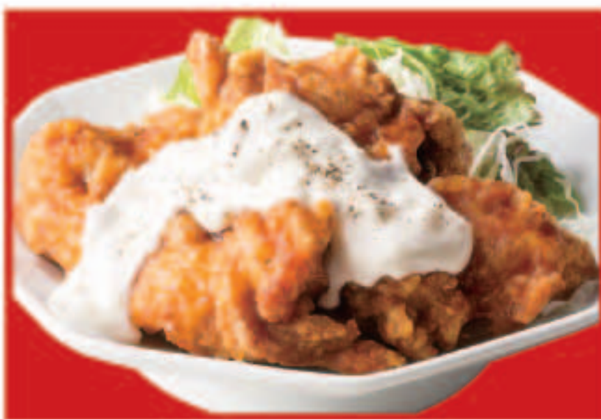
64 チキン南蛮 695円(税込)