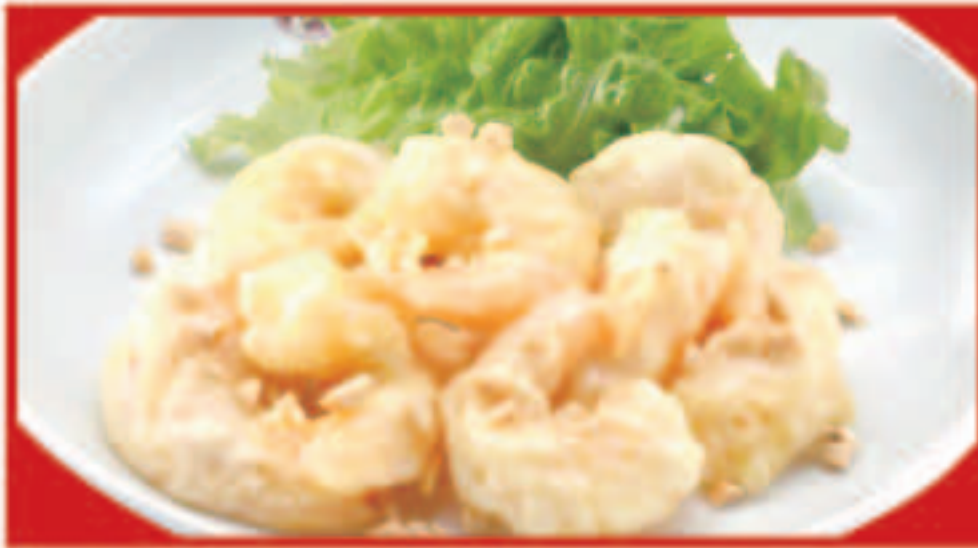
74 海老のマヨネーズ 760円(税込)