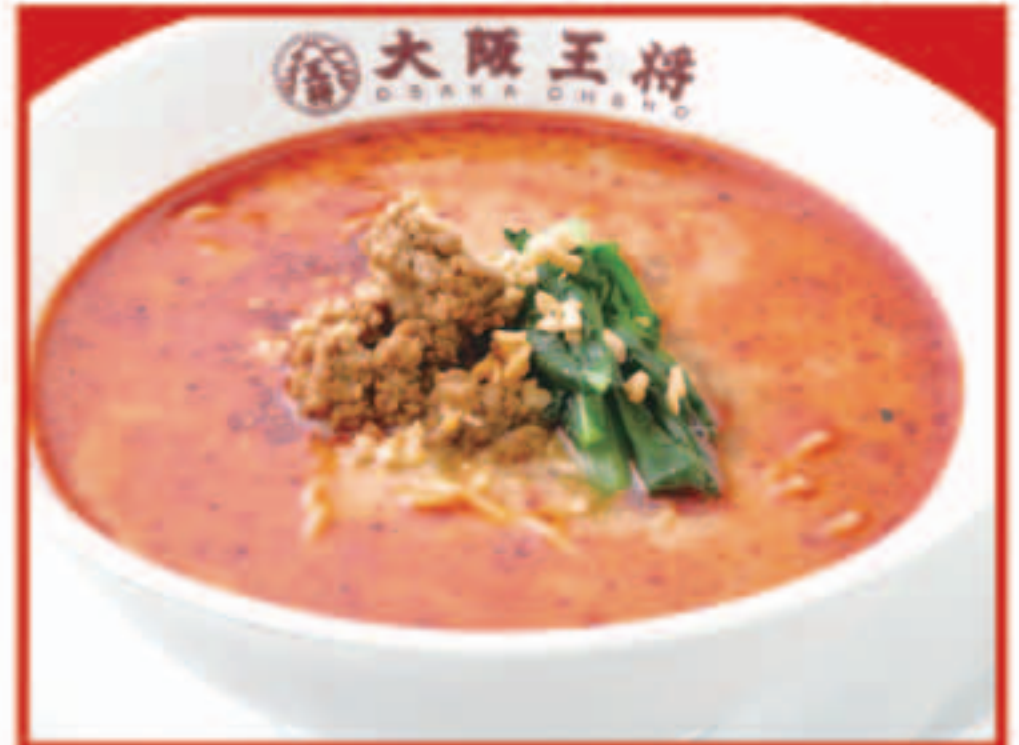
37 担々麺 770円(税込)