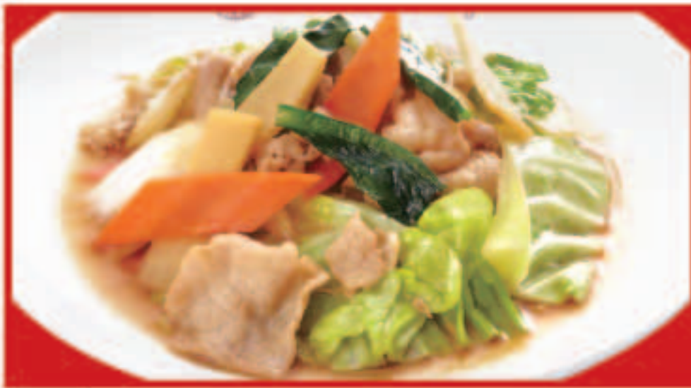
71 肉と野菜炒め 650円(税込)