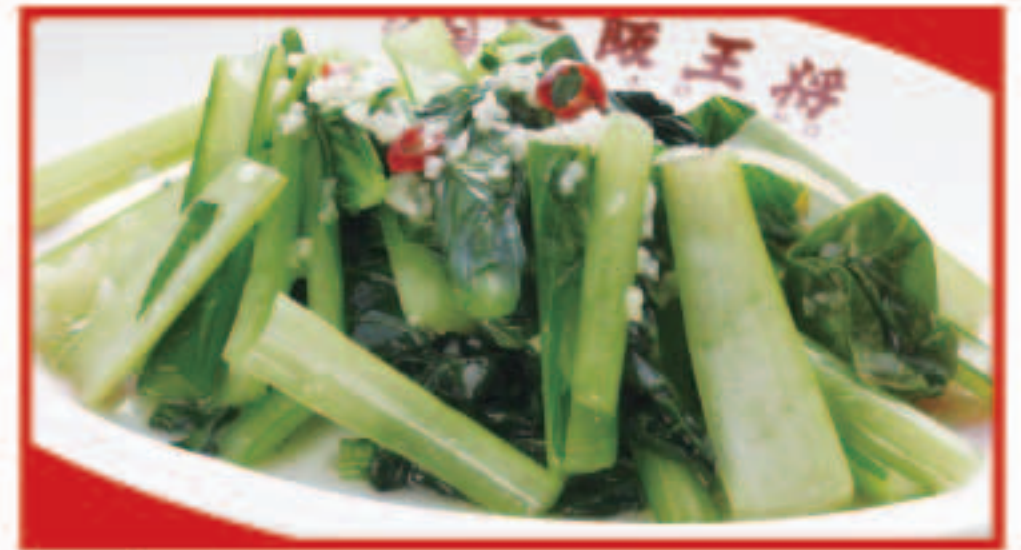
73 青菜のガーリック炒め 650円(税込)