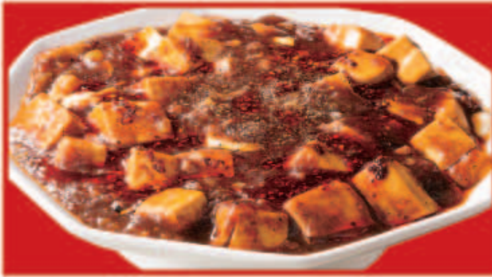
62 四川麻婆豆腐 700円(税込)