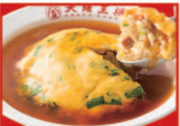
30 ニラ玉天津炒飯 750円(税込)