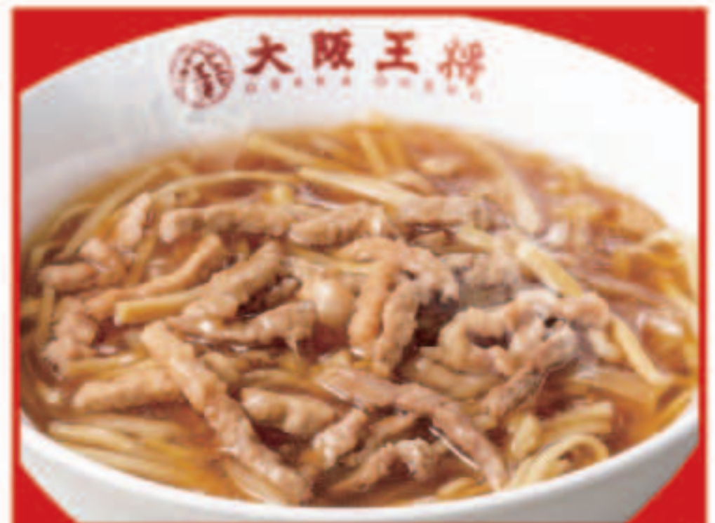
51 ルースー麺 790円(税込)