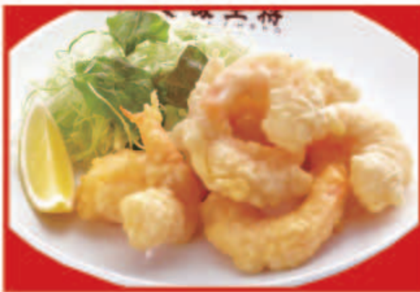
75 小海老の天ぷら 695円(税込)