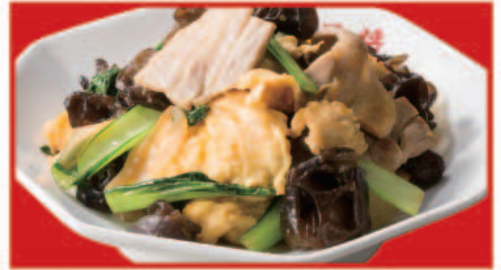
66 ムーシーロー 650円(税込)