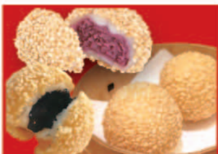
355 ゴマ団子ミックス (ゴマ団子1個・紫芋のゴマ団子1個) 295円(税込)