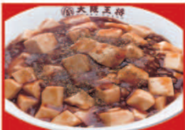
23 四川麻婆丼 750円(税込)