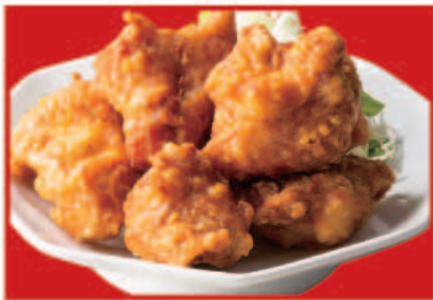
70 鶏の唐揚げ 695円(税込)