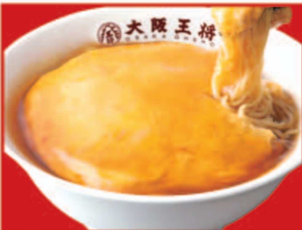
50 天津麺 700円(税込)