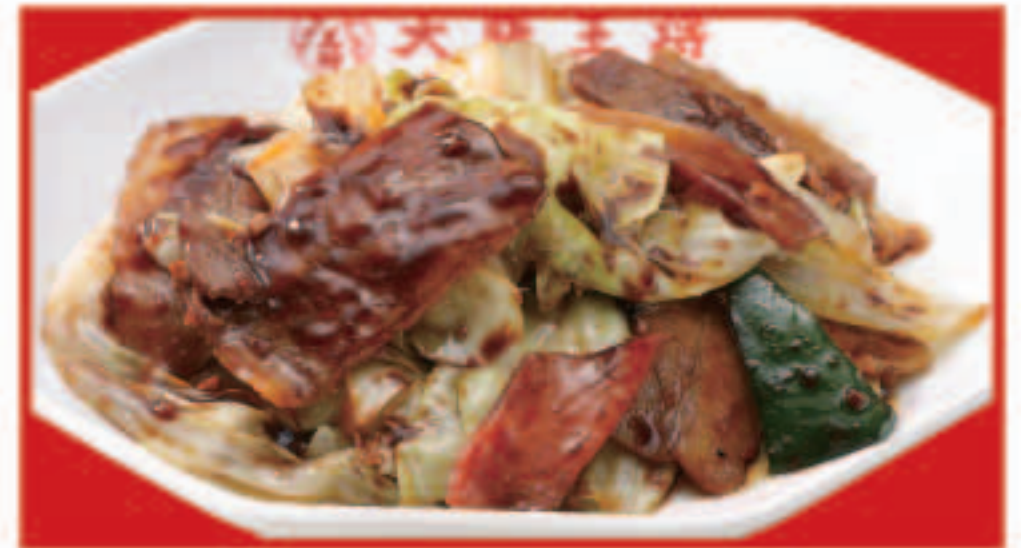
69 ホイコーロー 760円(税込)