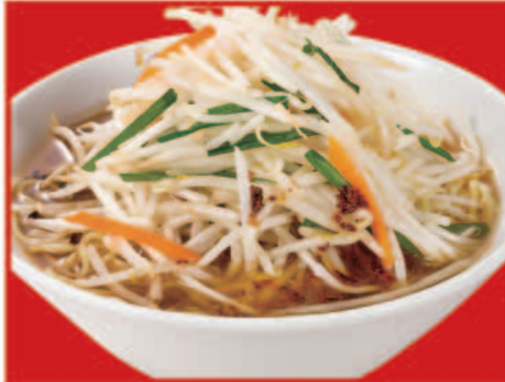
34 もやしそば 700円(税込)