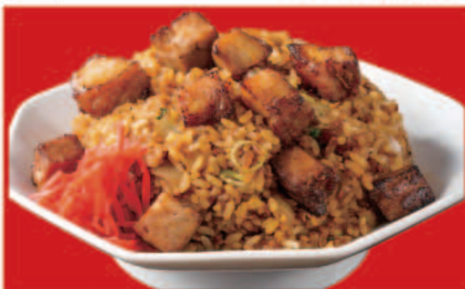
19 焼豚炒飯 780円(税込)