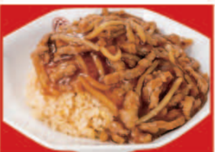
17 ルースー炒飯 790円(税込)