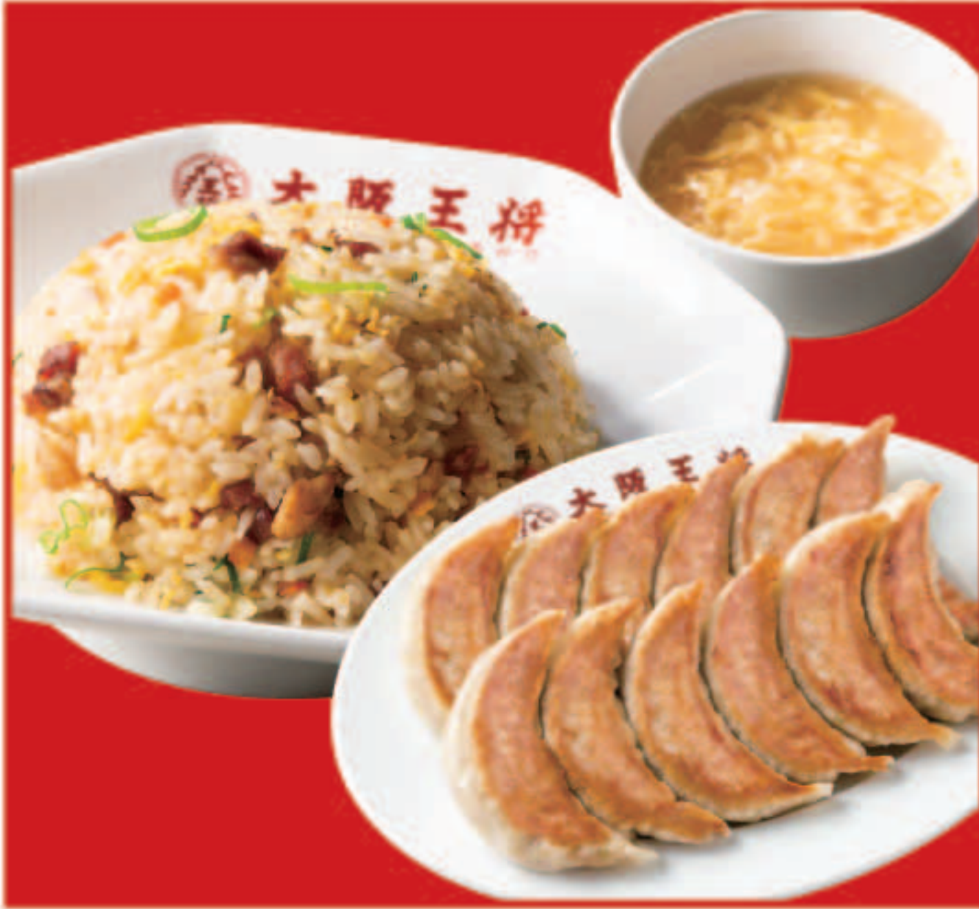
108 餃子セットダブル 1,100円(税込) 餃子2人前、五目炒飯、スープ