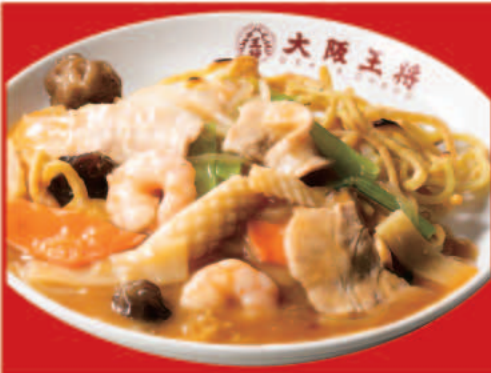
36 五目あんかけ焼きそば 880円(税込)