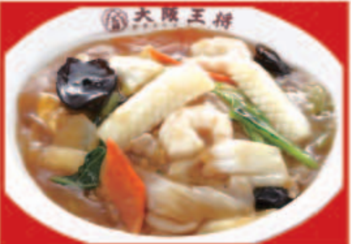
22 中華丼 700円(税込)