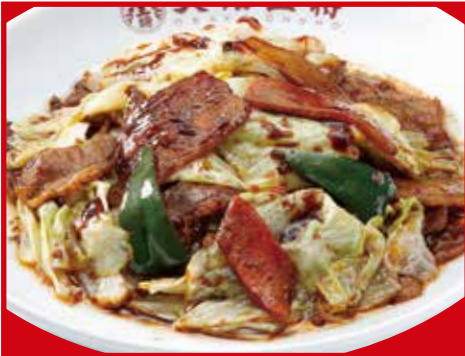
ごちそうキャベツの回鍋肉