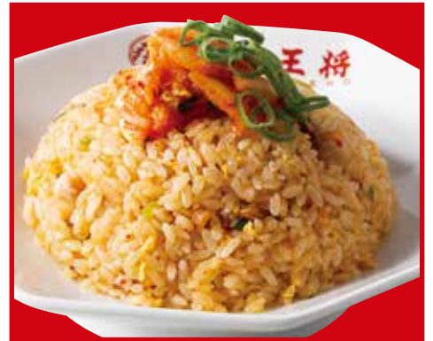
牛ム子炒飯 730円税込