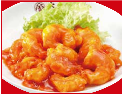
海老のチリソース