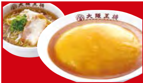
天津飯ラーメンセット 870円 税込 ・ふわとろ天津飯 ・醤油ラーメン(小)