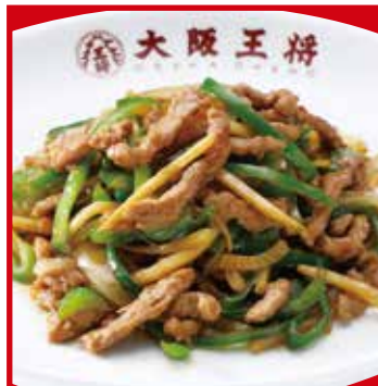
チンジャオロース