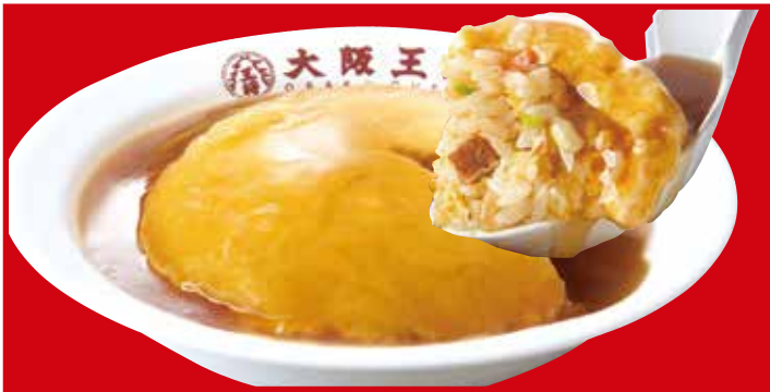
ふわとろ天津炒飯 740円税込