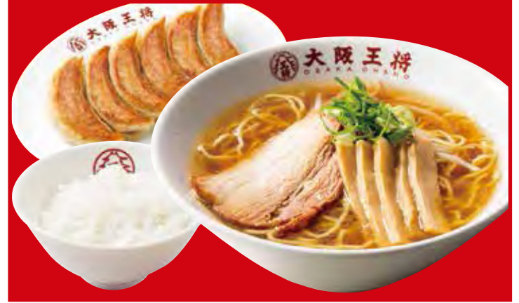
王将定食 1,050円 税込 ・餃子1人前・醤油ラーメン・白ご飯