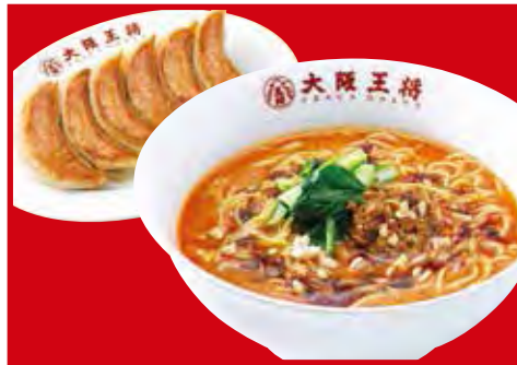
担々麺 セット 1,090円 税込 ・担々麺・餃子1人前