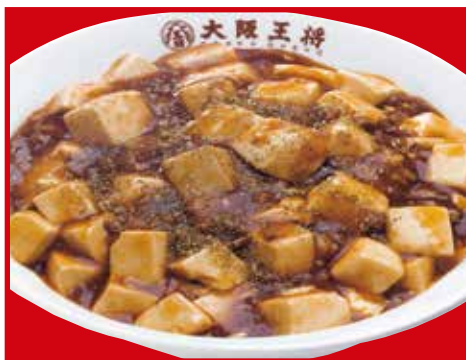
四川麻婆丼 700円税込