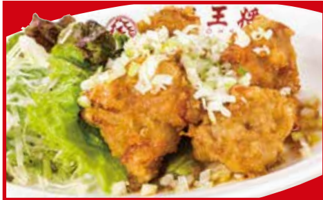
油淋鶏 (ユーリンチー)