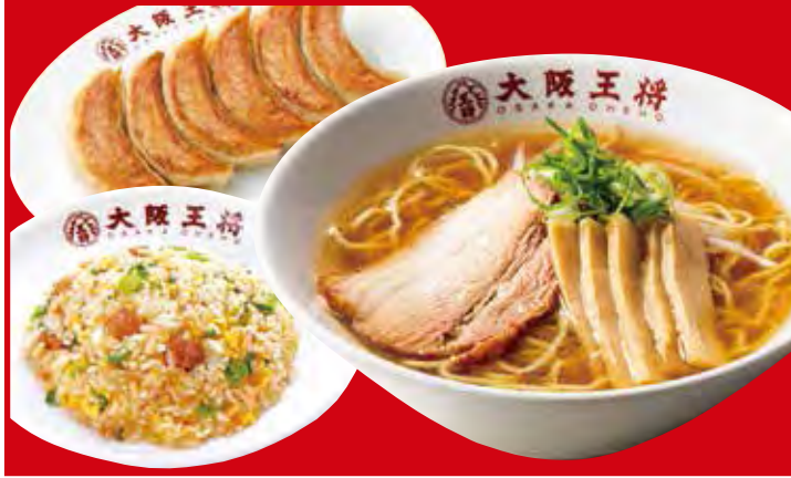
王将セット 1,210円 税込 ・餃子1人前・醤油ラーメン・五目炒飯(小)