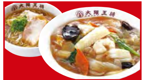
中華丼ラーメンセット 1,020円 税込 ・中華丼 ・醤油ラーメン(小)