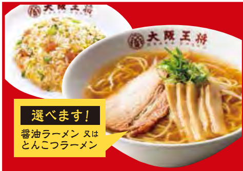
半チャン セット 960円 税込 ・選べるラーメン(醤油 or とんこつ) ・五目炒飯(小)