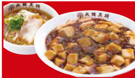
麻婆丼ラーメンセット 1,010円 税込 ・麻婆丼 ・醤油ラーメン(小)