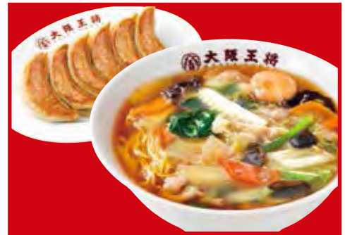
五目あんかけ ラーメンセット 1,130円 税込 ・五目あんかけラーメン・餃子1人前