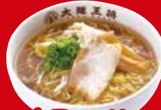
醤油ラーメン(小) 420円税込