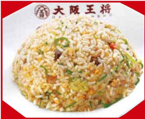
五目炒飯 580円税込 五目炒飯(小) 420円税込