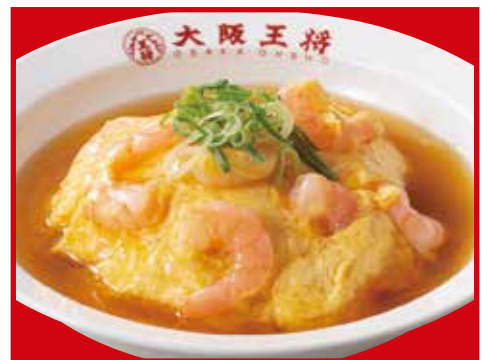
エビ玉天津飯 700円税込