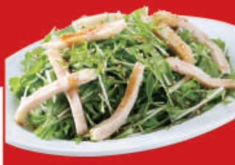
水菜と蒸し鶏のサラダ 610円(税込)