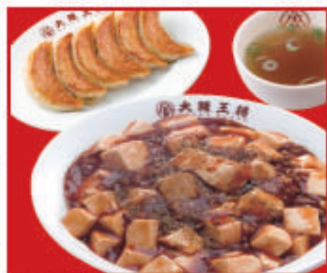
麻婆丼セット 1,040円(税込)