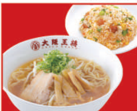
半チャンセット 1,040円(税込)