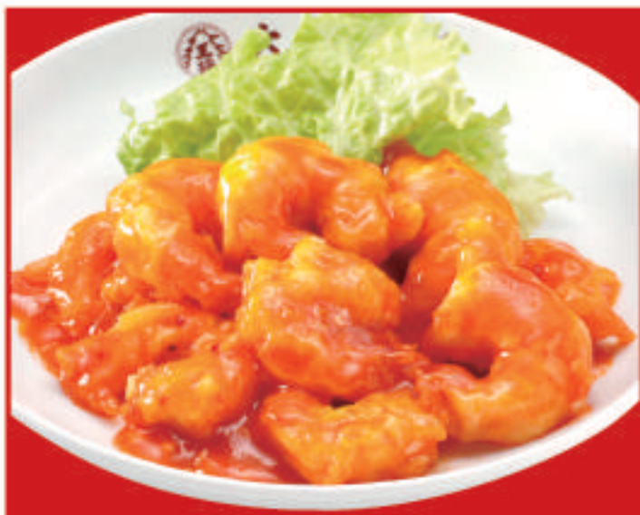
海老のチリソース 890円 (税込)