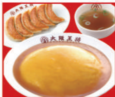
天津飯セット 850円(税込)