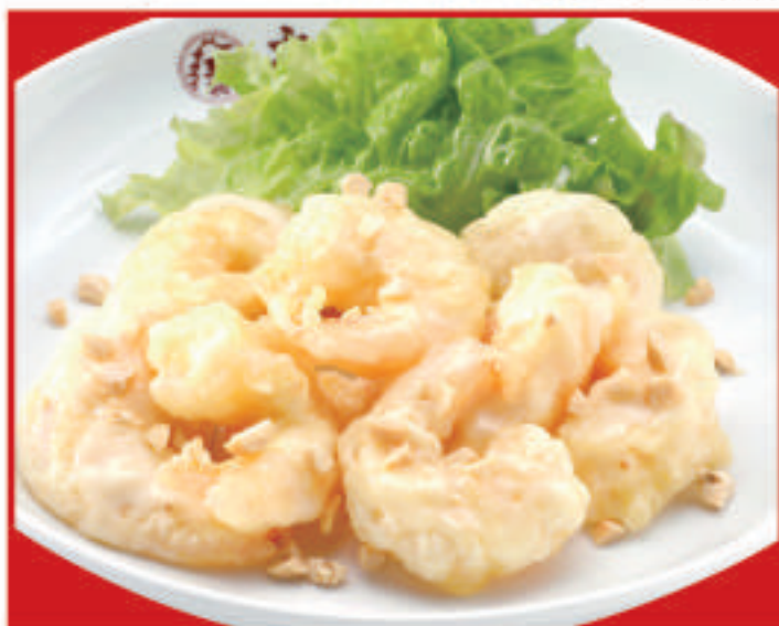
海老マヨネーズ 830円 (税込)