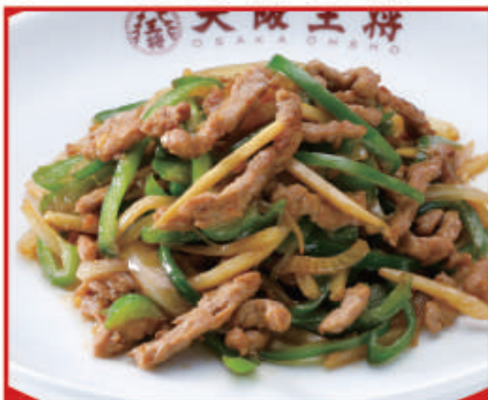
チンジャオロース 860円 (税込)