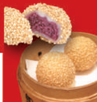
紫芋のゴマ団子 2個 410円(税込)