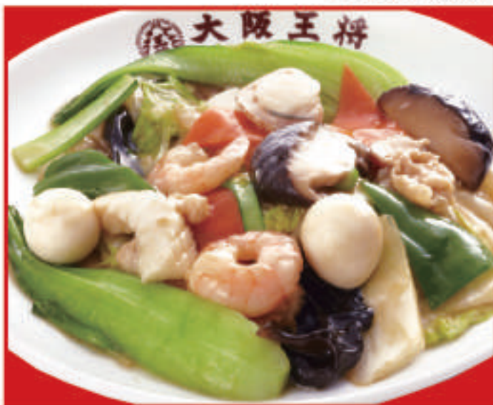
八宝菜 850円 (税込)