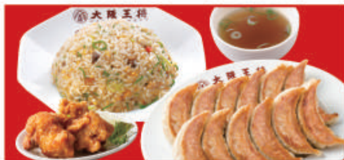
餃子セットダブル 1,510円(税込)