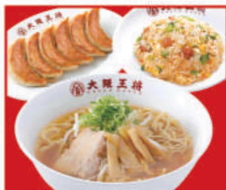
王将セット 1,310円(税込)