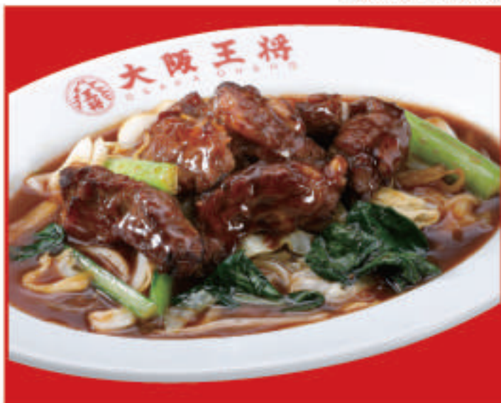
牛カルビ炒め 890円 (税込)