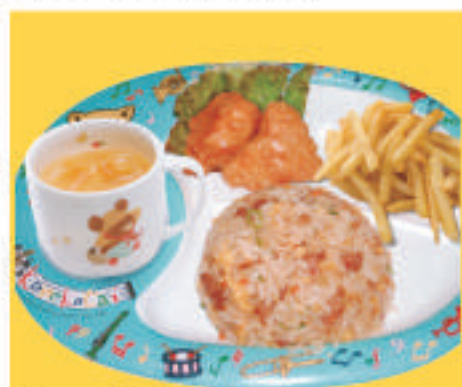
キッズプレート 650円(税込)