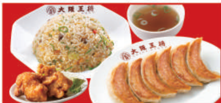
餃子セットシングル 1,220円(税込)