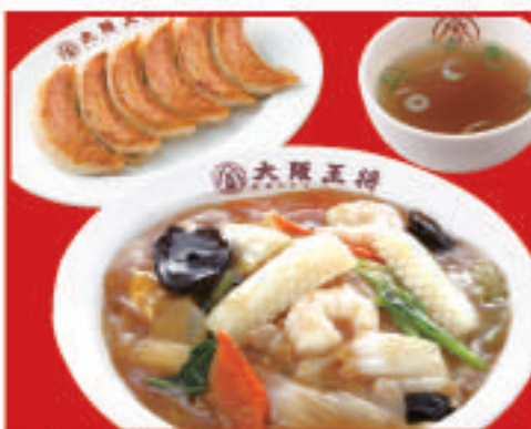
中華丼セット 1,040円(税込)