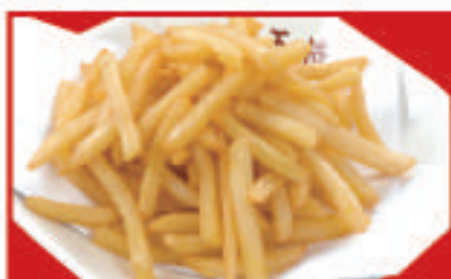
フライドポテト 430円(税込)