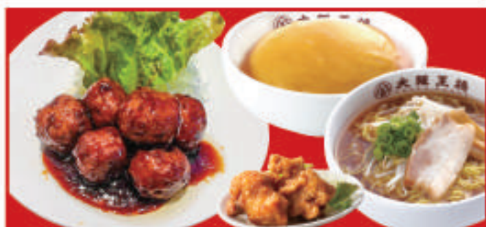
まんぷくセット 1,290円(税込)