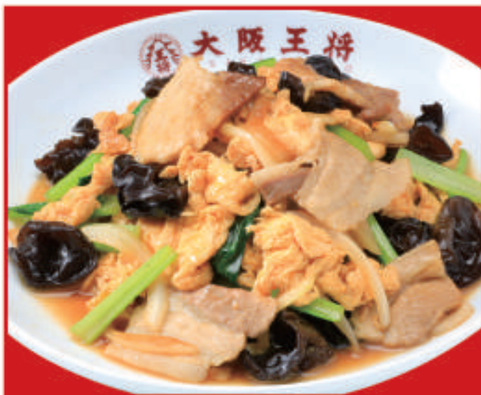
ムーシーロー 730円 (税込)