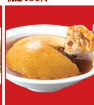
ふわとろ天津炒飯 税込750円