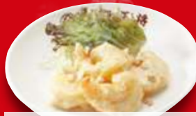
海老のマヨネーズ(小) 400円 税込