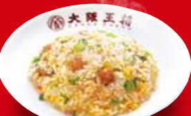
五目炒飯(小) 360円 税込