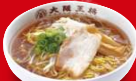
醤油ラーメン(小) 420円 税込