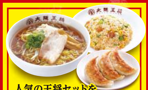
黒炒飯(小) 400円 税込