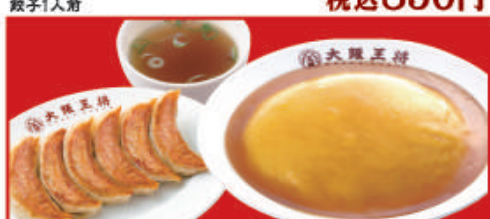
天津飯&餃子セット 餃子1人前・天津飯・スープ 税込770円