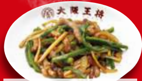
チンジャオロース(小) 450円 税込