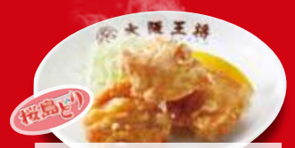
鶏の唐揚げ(3ヶ) 410円 税込