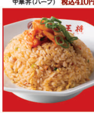
牛ムチ炒飯 税込680円