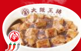
麻婆丼(小) 390円 税込