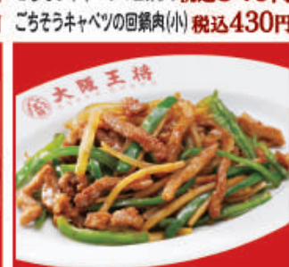
チンジャオロース 税込680円 チンジャオロース(小) 税込450円