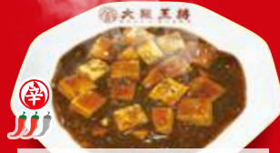
四川麻婆豆腐(小) 370円 税込