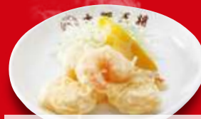
小海老の天ぷら(小) 360円 税込