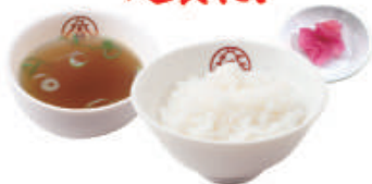
ご飯セット ご飯・スープ・漬物 税込290円