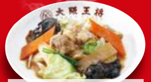
肉と野菜炒め(小) 360円 税込