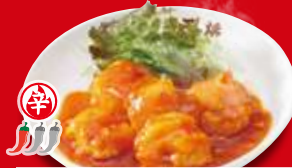
海老のチリソース(小) 440円 税込