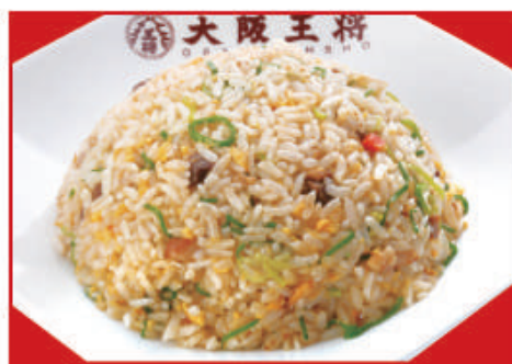
五目炒飯 税込560円 五目炒飯(ハーフ) 税込400円