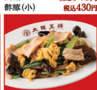
ムーシーロー 税込560円 ムーシーロー(小) 税込390円