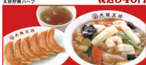
中華丼&餃子セット 餃子1人前・中華丼・スープ 税込940円