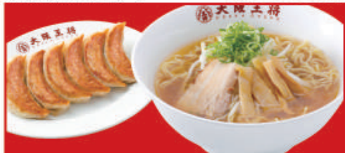
ラーメンセット (速べるラーメン) 醤油ラーメンorとんこつラーメン・餃子1人前 税込850円