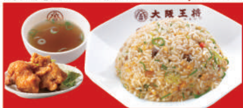
唐揚げ&炒飯セット 五目炒飯・唐揚げ2個・スープ 税込800円