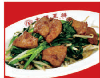
レバニラ炒め 税込640円 レバニラ炒め(小) 税込410円