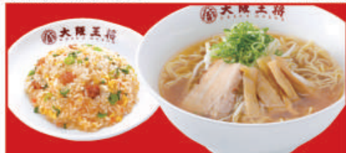
半チャンセット (速べるラーメン) 醤油ラーメンorとんこつラーメン・五目炒飯ハーフ 税込940円