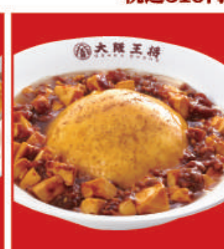
ふわとろ麻婆天津飯 税込830円