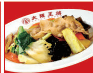
肉と野菜炒め 税込540円 肉と野菜炒め(小) 税込360円