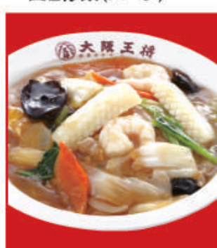
中華丼 税込680円 中華丼(ハーフ) 税込410円