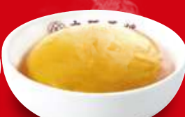
ふわとろ天津飯(小) 390円 税込