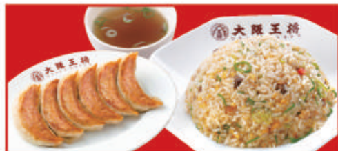
餃子セット 餃子1人前・五目炒飯・スープ 税込840円