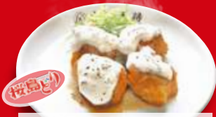
チキン南蛮(小) 390円 税込