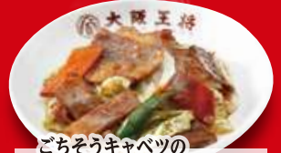
ごちそうキャバツの ホイコーロー(小) 430円 税込