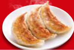
焼餃子(3ヶ) 170円 税込

お手頃サイズを お手頃価格で!! 「少しだけ食べたい!」 「あれこれ食べたい!」 そんなご要望にお応えした ハーフサイズメニューです。