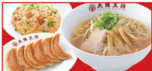
王将セット 餃子1人前・醤油ラーメン・五目炒飯ハーフ 税込1,160円