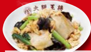
ムーシーロー(小) 390円 税込