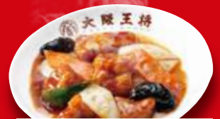
酢豚(小) 430円 税込