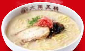
とんこつラーメン(小) 480円 税込