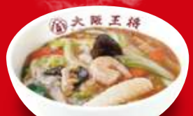
中華丼(小) 390円 税込