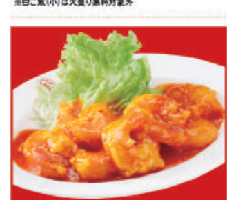
海老のチリソース 税込670円 海老のチリソース(小) 税込440円