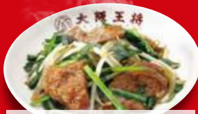
レバニラ炒め(小) 410円 税込