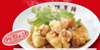
油淋鶏(小) 390円 税込