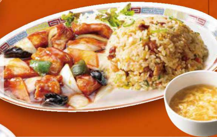
酢豚チャーハンコンビ 酢豚・五目炒飯・スープ (税込) 1,050円