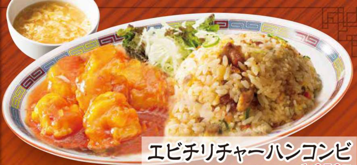
エビチリチャーハンコンビ 海老チリソース・五目炒飯・スープ (税込) 1,050円