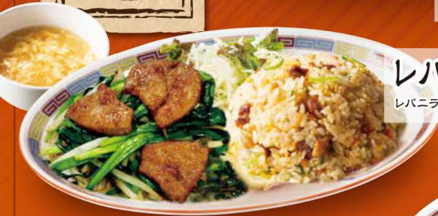
レバニラチャーハンコンビ レバニラ炒め・五目炒飯・スープ (税込) 1,050円