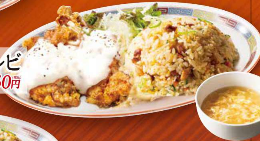
油淋鶏チャーハンコンビ 油淋鶏・五目炒飯・スープ (税込) 1,050円