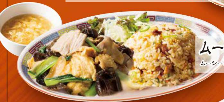
ムーシーローチャーハンコンビ ムーシーロー・五目炒飯・スープ (税込) 1,050円