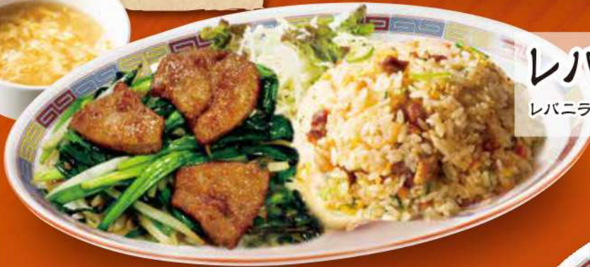
レバニラチャーハンコンビ レバニラ炒め・五目炒飯・スープ 1,050円 (税込)