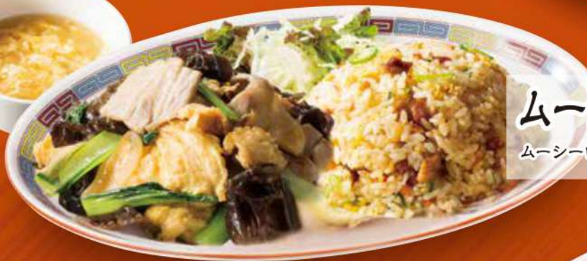
ムーシーローチャーハンコンビ ムーシーロー・五目炒飯・スープ 1,050円 (税込)