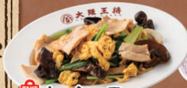
TAKE OUT ムーシーロー 780円