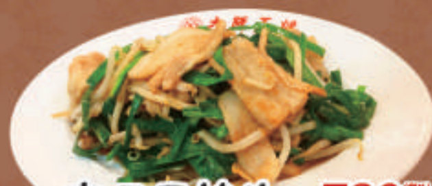
肉ニラ炒め 780円 肉ニラ炒め(小) 630円