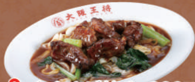
TAKE OUT 牛カルビ炒め 900円