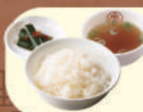
ご飯セット ご飯・スープ・漬物 +300円