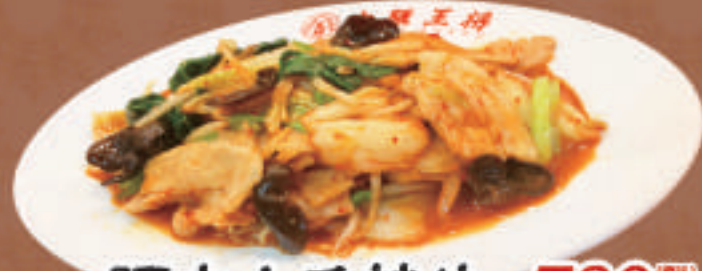
豚キムチ炒め 780円 豚キムチ炒め(小) 630円