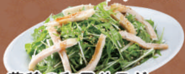
蒸鶏の和風サラダ 520円