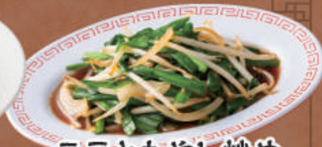
ニラともやし炒め 600円