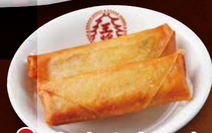
TAKE OUT 海老玉 680円 (税込) TAKE OUT 小海老の天ぷら 650円 (税込) TAKE OUT 春巻き(2個) 280円 (税込) 小海老の天ぷら(小) 420円 (税込)