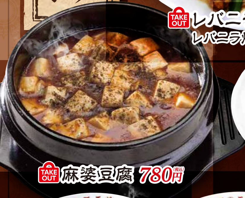
TAKE OUT 麻婆豆腐 780円 (税込)