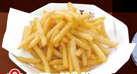
TAKE OUT フライドポテト 360円 (税込)