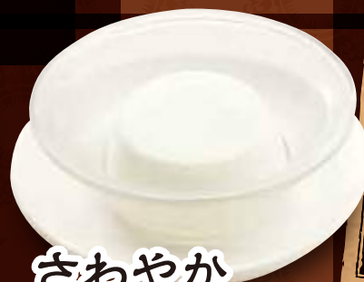
さわやか 杏仁豆腐 300円 (税込)