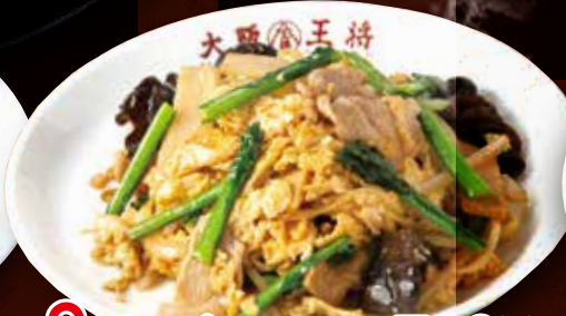
TAKE OUT ムーシーロー 730円 (税込) ムーシーロー(小) 450円 (税込)