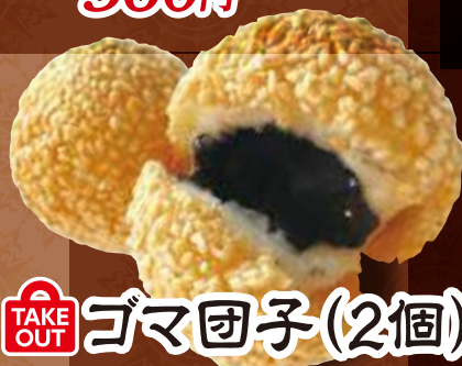
TAKE OUT ゴマ団子(2個) 300円 (税込)