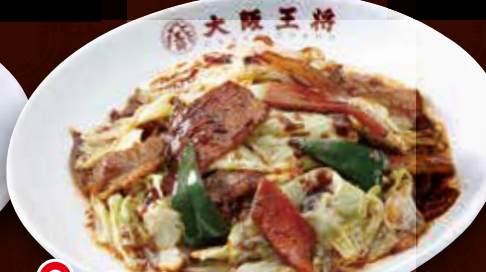
TAKE OUT ホイコーロー 780円 (税込) ホイコーロー(小) 490円 (税込)