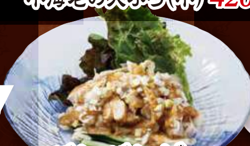
バンバンジー 530円 (税込)