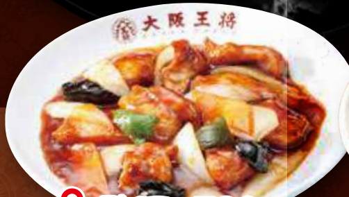
TAKE OUT 酢豚 780円 (税込) 酢豚(小) 490円 (税込)