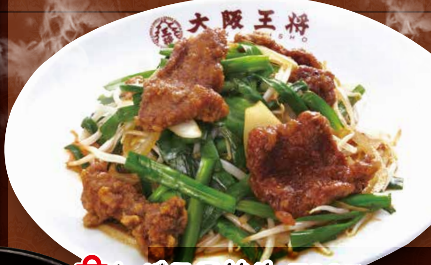
TAKE OUT レパニラ炒め 780円 (税込) レパニラ炒め(小) 490円 (税込)