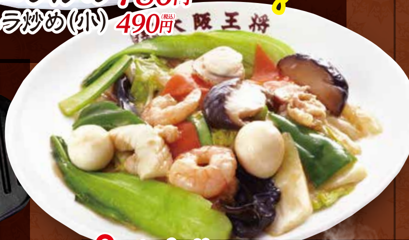
TAKE OUT 八宝菜 780円 (税込)