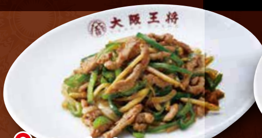
TAKE OUT チンジャオロース 800円 (税込) チンジャオロース(小) 500円 (税込)