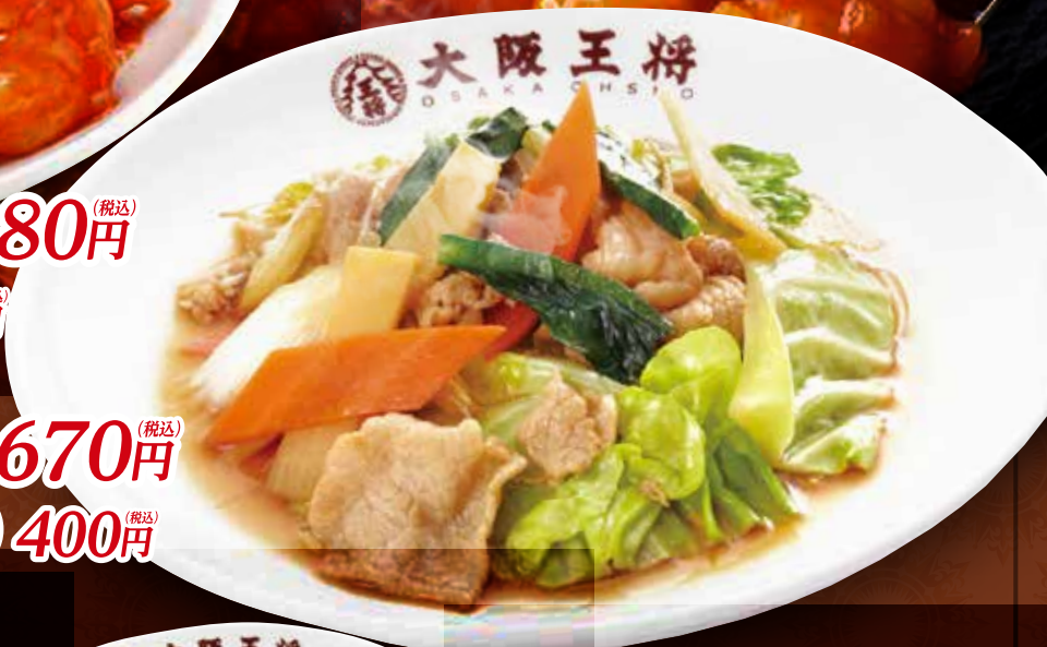
TAKE OUT 肉と野菜炒め 670円 (税込) 肉と野菜炒め(小) 400円 (税込)