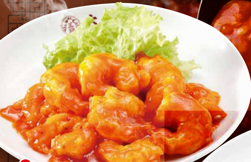
TAKE OUT 海老のチリソース 880円 (税込) 海老のチリソース(小) 520円 (税込)