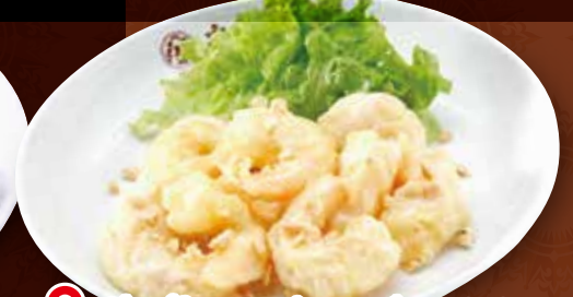
TAKE OUT 海老マヨネーズ 800円 (税込) 海老マヨネーズ(小) 500円 (税込)