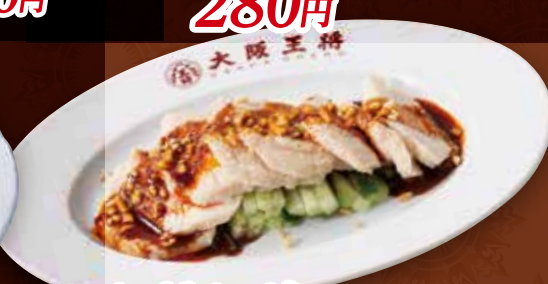
よだれ鶏 530円 (税込)