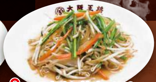
TAKE OUT ニラもやし炒め 650円 (税込) ニラもやし炒め(小) 380円 (税込)