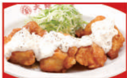
チキン南蛮 730円(税込)