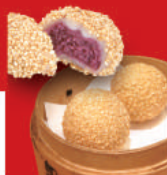
紫芋のゴマ団子 2個 410円(税込)