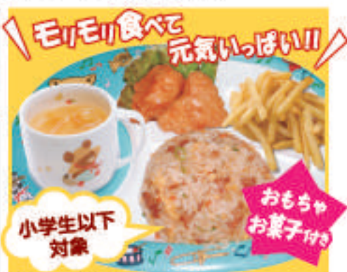
キッズプレート 650円(税込) チャーハン・からあげ・フライドポテト・ジュース