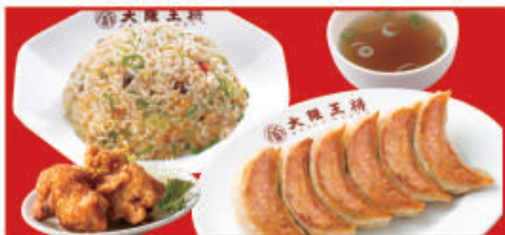
餃子セットシングル 1,220円(税込) 餃子1人前・五目炒飯・唐揚げ2個・スープ