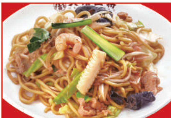
もちもち太麵の炒め焼きそば