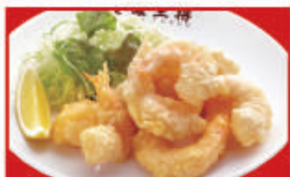
小海老の 天ぷら 760円(税込)