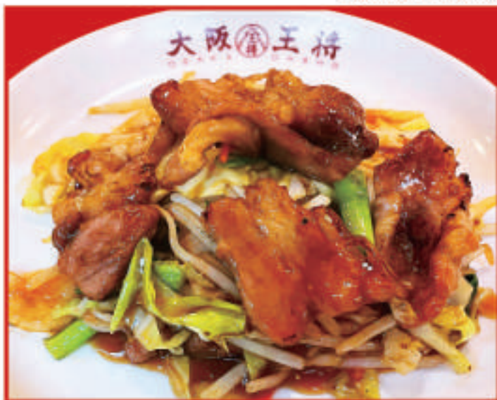
牛カルビ炒め 890円(税込)