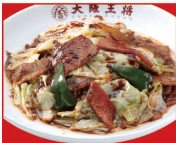
ごちそうキャベツの回鍋肉