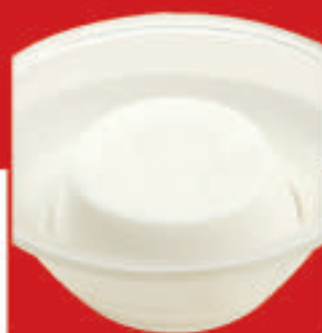
さわやか杏仁豆腐 410円(税込)