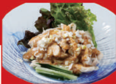
パンパンジー 610円(税込)