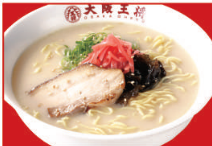
とんこつラーメン 740円(税込)