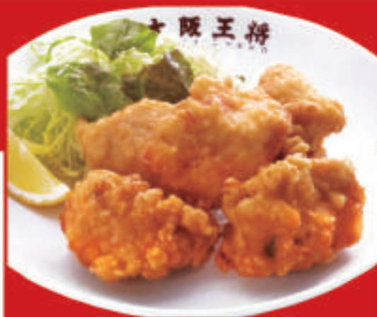
唐揚げ 5個 760円(税込)