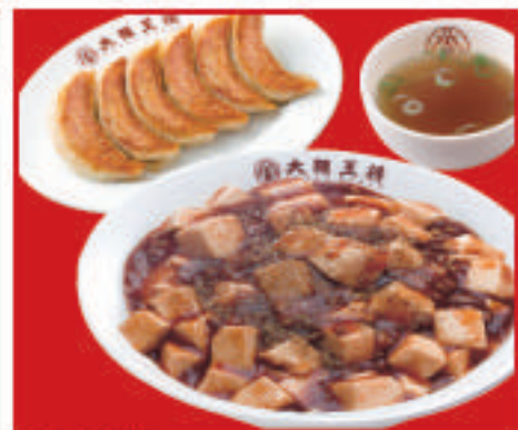
麻婆丼セット 1,040円(税込) 麻婆丼・スープ・餃子1人前