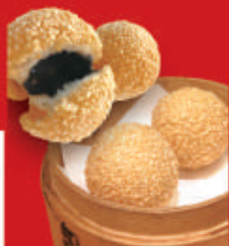
ゴマ団子 2個 410円(税込)