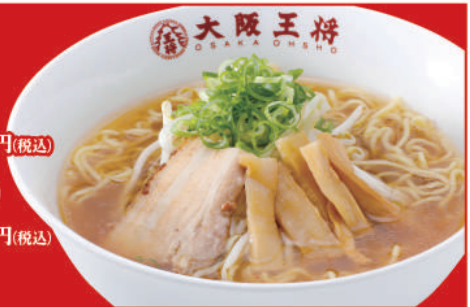
醤油ラーメン 680円(税込) 醤油ラーメン(小) 510円(税込)