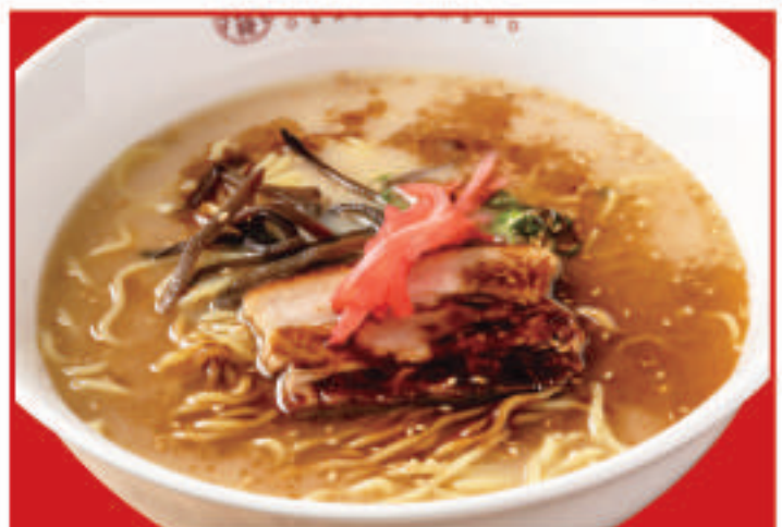
黒とんこつラーメン 760円(税込)