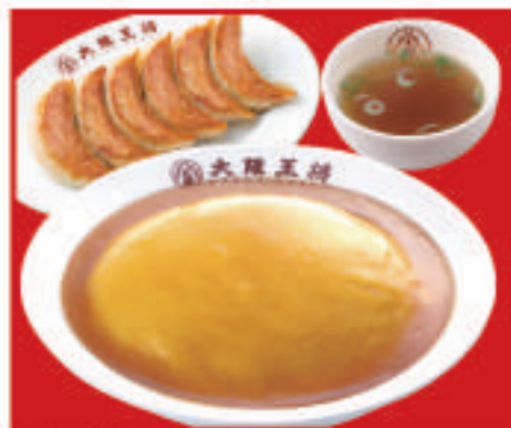
天津飯セット 850円(税込) 天津飯・スープ・餃子1人前