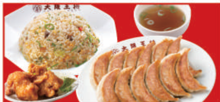
餃子セットダブル 1,510円(税込) 餃子2人前・五目炒飯・唐揚げ2個・スープ