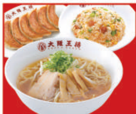
王将セット 1,310円(税込) 餃子1人前・醤油ラーメン・五目炒飯(小)