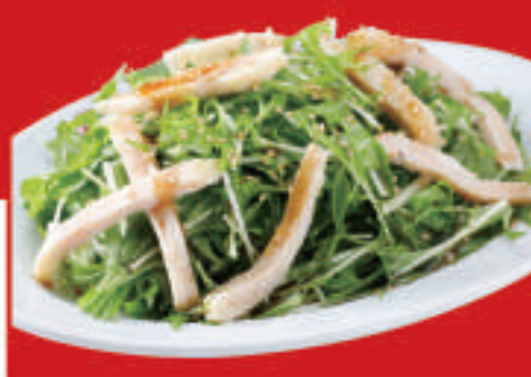
水菜と蒸し鶏のサラダ 610円(税込)