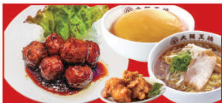
まんぷくセット 1,290円(税込) 天津飯(小)・唐揚げ2個・醤油ラーメン(小)・奥団子甘酢