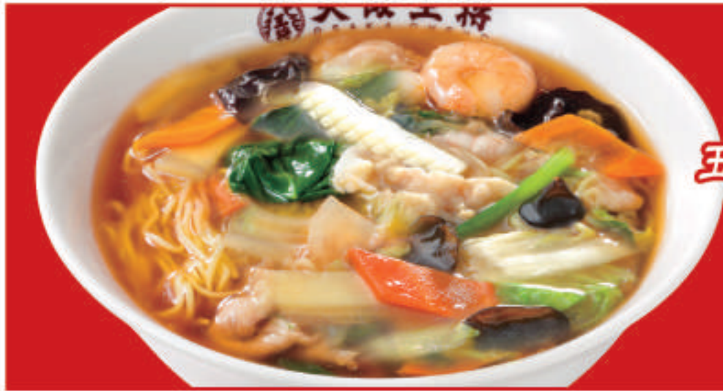
五目あんかけ ラーメン 880円(税込)