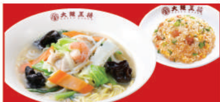
ちゃんぽんセット 1,250円(税込) ちゃんぽん麺・五目炒飯(小)