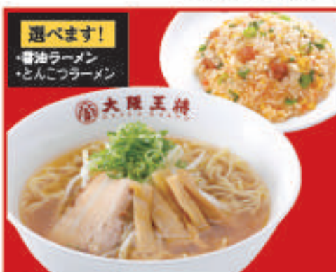
半チャンセット 1,040円(税込) 選べるラーメン(醤油orとんこつ)・五目炒飯(小)