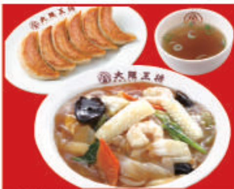
中華丼セット 1,040円(税込) 中華丼・スープ・餃子1人前