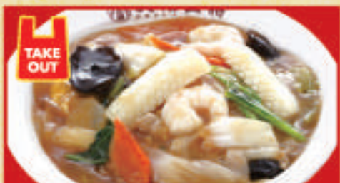
中華丼 700円(税込) 中華丼(小) 440円(税込)