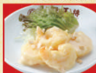
海老マヨネーズ(小)