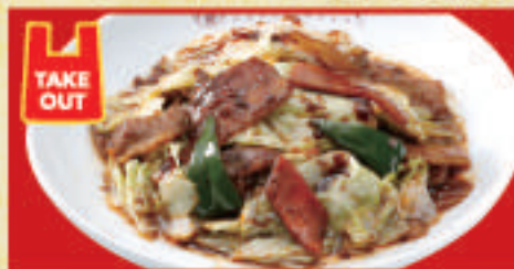
ごちそうキャベツの豚鍋肉