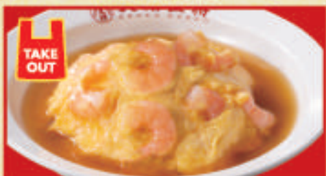
海老と天津飯 770円(税込)