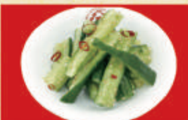
ねねき胡瓜 320円(税込)