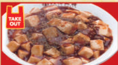
四川麻婆丼 690円(税込) 四川麻婆丼(小) 430円(税込)