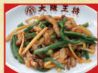
チンジャオロース(小)