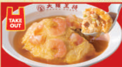
海老と天津炒飯 830円(税込)