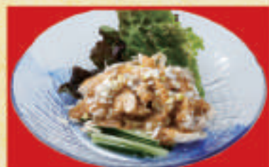
パンパンジー 550円(税込)