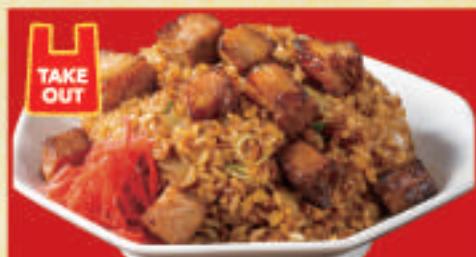
焼き豚炒飯 780円(税込)