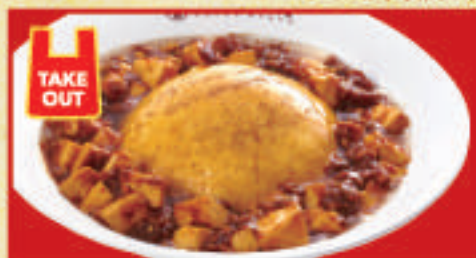
ふわとろ麻婆天津飯 850円(税込)