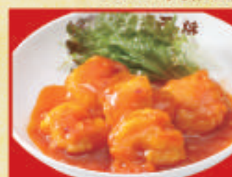
海老のチリソース(小)