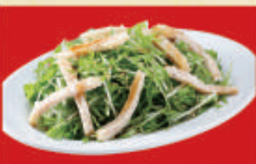
水菜と蒟蒻のサラダ 550円(税込)