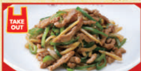
チンジャオロース