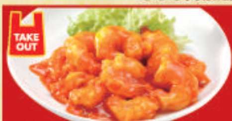
海老のチリソース