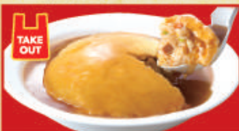
ふわとろ天津炒飯 830円(税込)