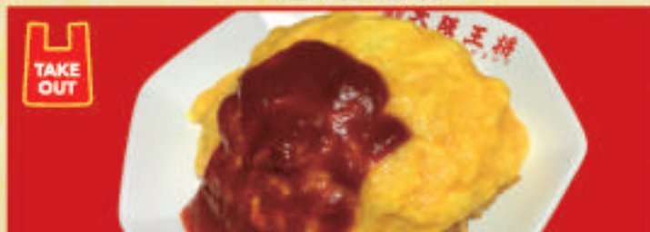
オムライス 790円(税込)