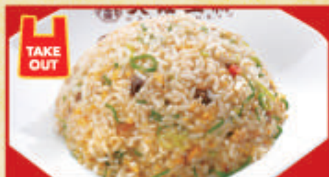
五国炒飯 590円(税込) 五国炒飯(小) 410円(税込)