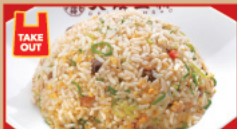
五目炒飯 税込590円 五目炒飯(ハーフ) 税込420円