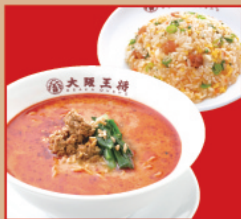
半チャンセット担々麺