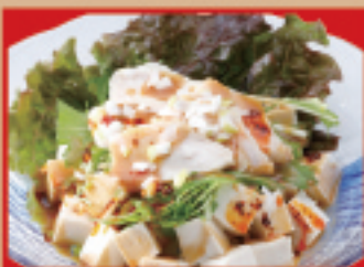
豆腐サラダ 税込530円