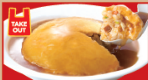
ふわとろ天津炒飯 税込740円