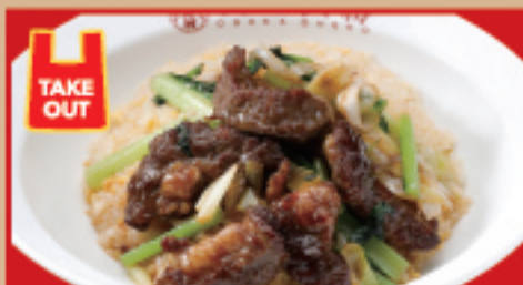
牛カルビ炒飯 税込990円