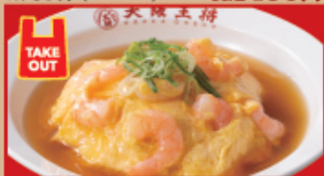
エビ玉天津飯 税込720円