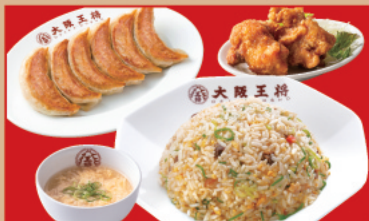
餃子セットシングル