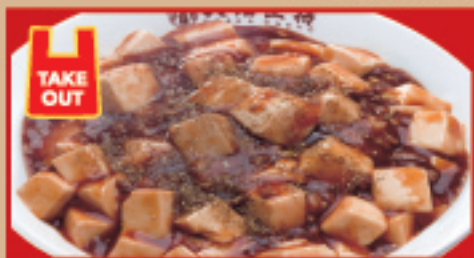
麻婆丼 税込730円 麻婆丼(ハーフ) 税込430円