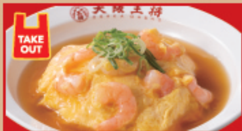
エビ玉天津炒飯 税込1,030円