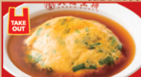
ニラ玉天津飯 税込690円