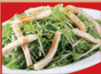
水菜と蒸し鶏のサラダ 税込530円