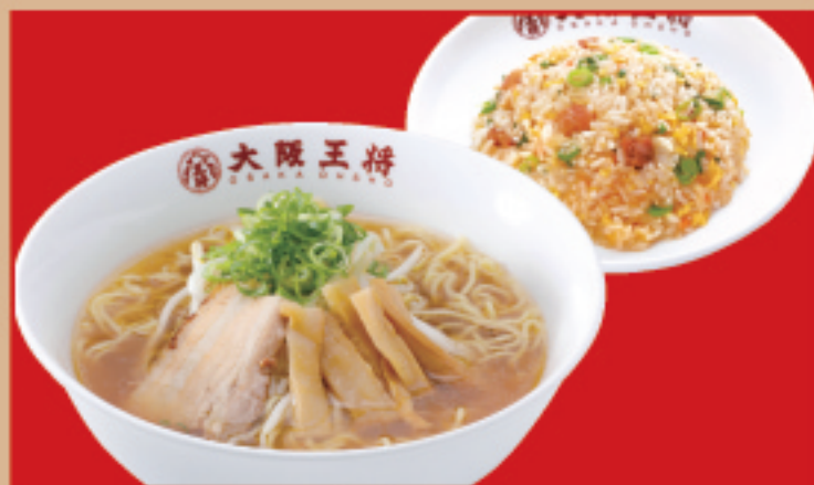
半チャンセット中華そば