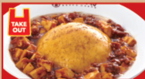
ふわとろ麻婆天津飯 税込810円