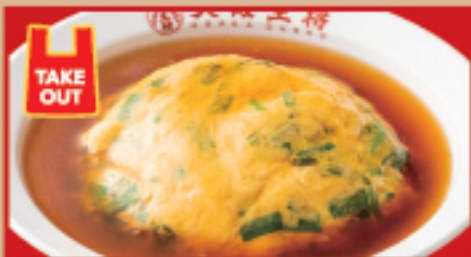
ニラ玉天津炒飯 税込940円