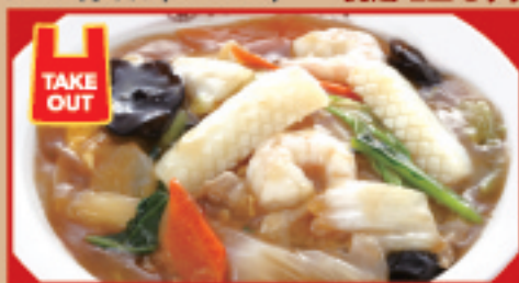
中華丼 税込730円 中華丼(ハーフ) 税込430円