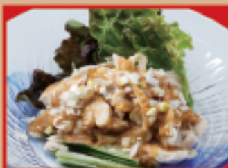
バンバンジー 税込530円