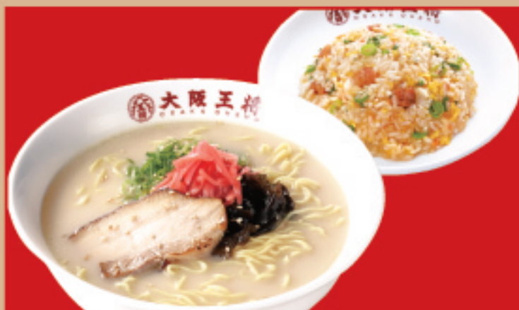
半チャンセットとんこつ