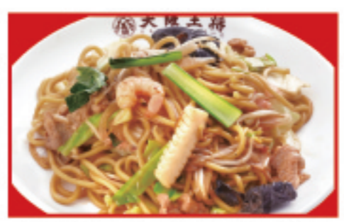
もちもち太麺の醤油焼きそば 税込760円