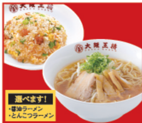
半チャンセット 選べるラーメン(醤油orとんこつ) 五目炒飯(小) 税込1,000円