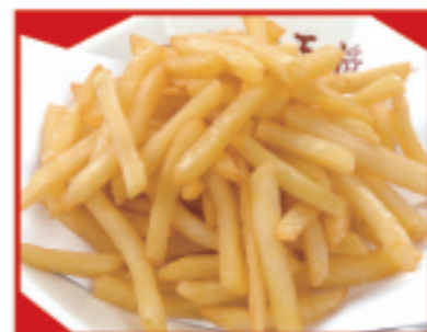
フライドポテト 税込400円