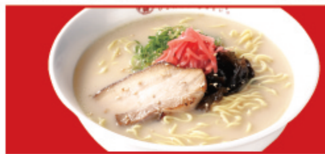
とんこつラーメン 税込700円