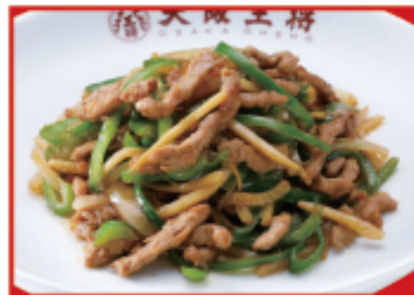
チンジャオロース 税込860円