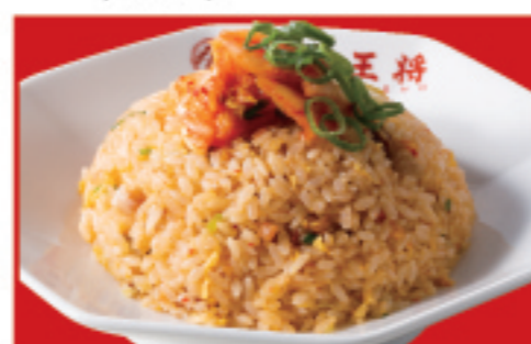
牛ムチ炒飯 税込730円