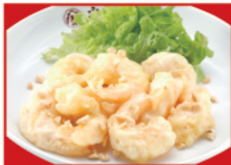
海老マヨネーズ 税込850円