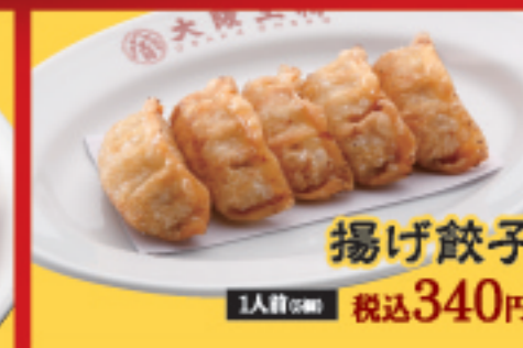
揚げ餃子 1人前(6個) 税込340円