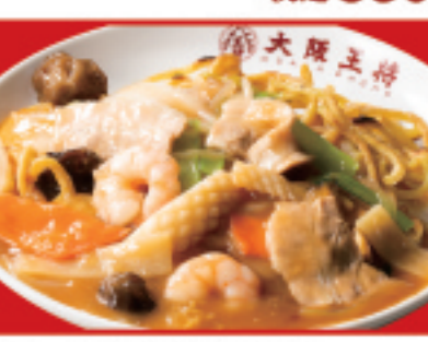
あんかけ焼きそば 税込880円