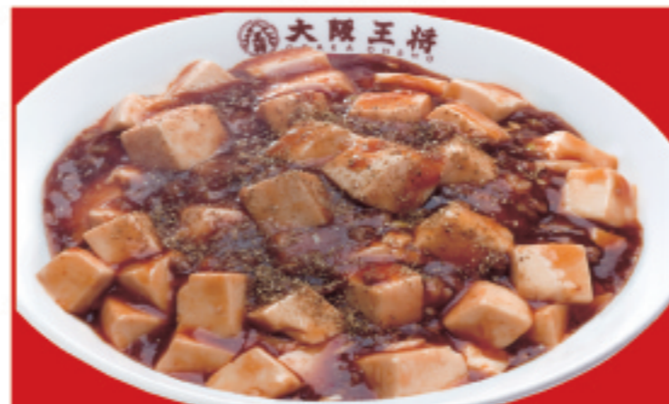
四川麻婆丼 税込780円 大辛 産れ1+税込100円 四川麻婆丼(ハーフ) 税込530円 激辛 産れ2+税込150円