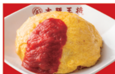
オムライス 税込900円