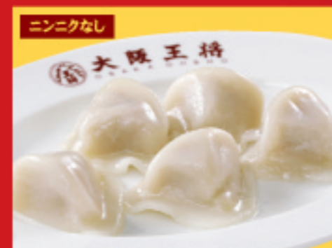
ぶるもち大粒水餃子 1人前(6個) 税込390円