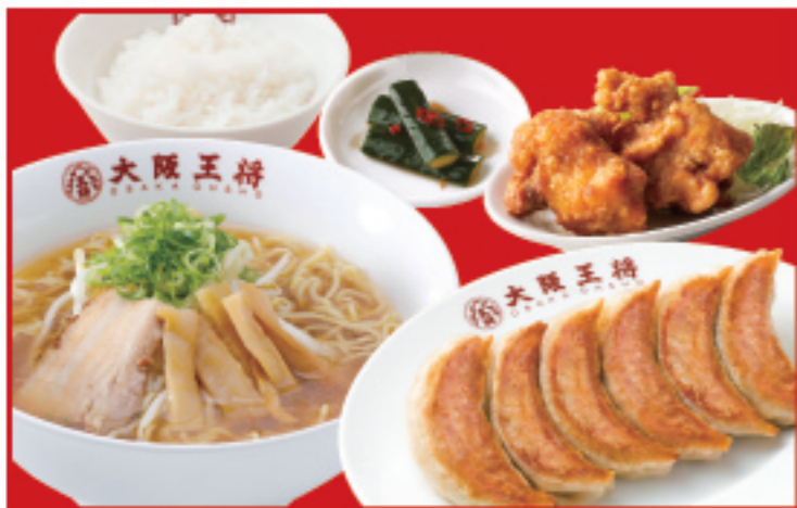
王将定食 餃子1人前・醤油ラーメン・ライス 唐揚げ2個・漬物 税込1,270円