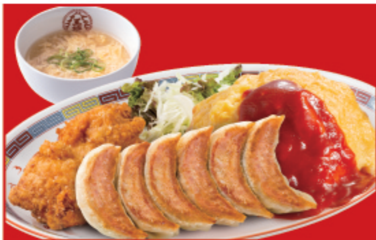
スペシャル定食 オムライス・餃子1人前・スープ・唐揚げ2個 税込1,520円