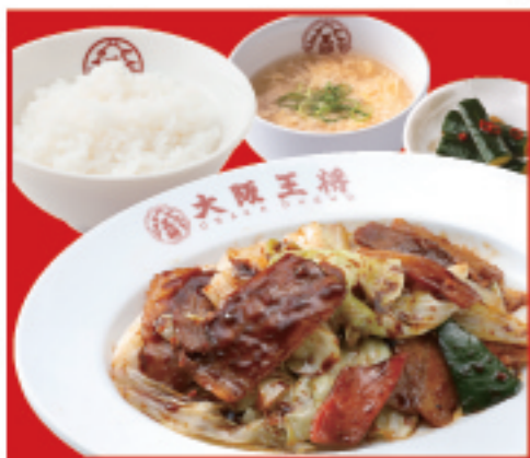
回鍋肉定食 回鍋肉・ライス・スープ・漬物 税込1,050円