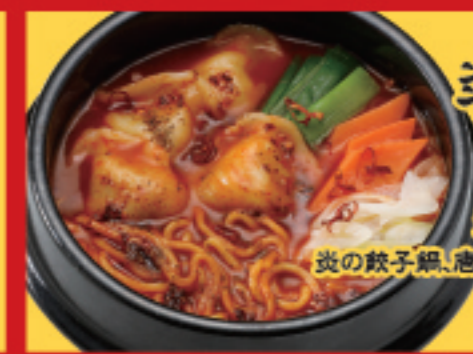
炎の餃子鍋 税込800円