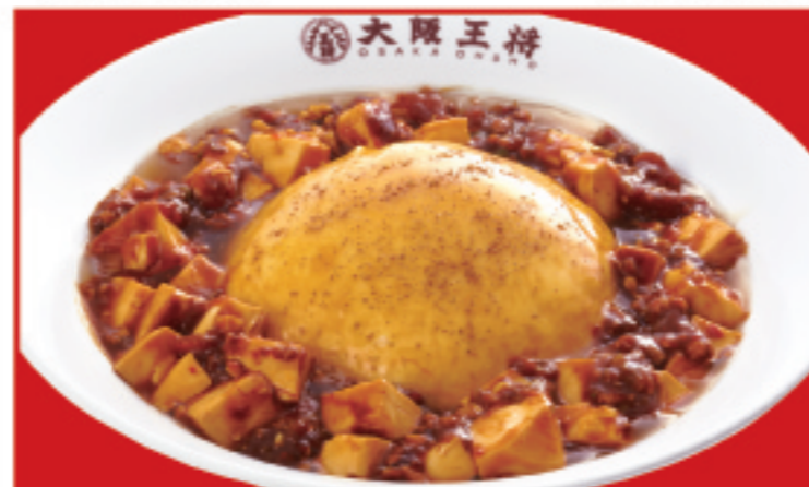
天津麻婆丼 税込880円 大辛 産れ1+税込100円 激辛 産れ2+税込150円