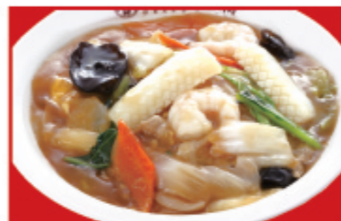
中華丼 税込750円 中華丼(ハーフ) 税込550円