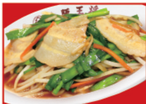
肉ニラ炒め 税込840円