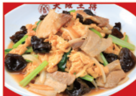
ムーシーロー 税込880円 (豚肉とキクラゲの玉子炒め)