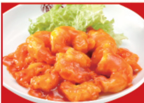
海老の子リソース 税込850円