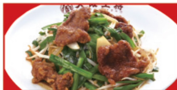
レバニラ炒め 税込840円