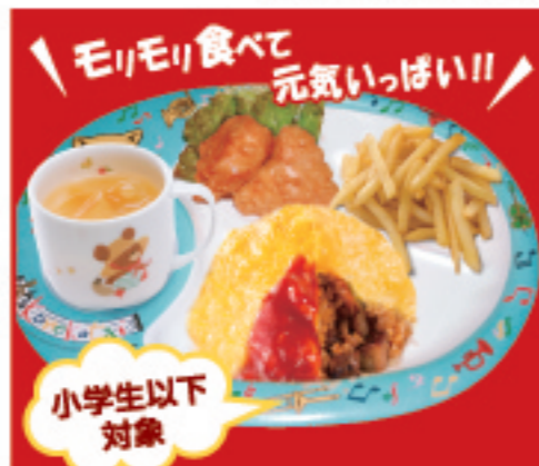
キッズプレート 小学生以下対象 オムライス・唐揚げ・ポテト オレンジジュース 税込700円