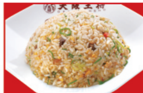
五目炒飯 税込600円 五目炒飯(ハーフ) 税込450円