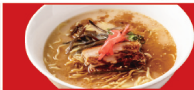
黒とんこつラーメン 税込740円