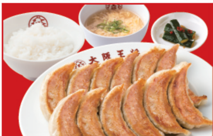
餃子定食 餃子2人前・ライス・スープ・漬物 税込1,020円