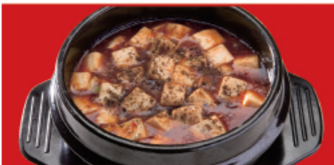
四川麻婆豆腐 大辛 薬味1辛み2 +税込100円 税込800円 激辛 薬味2辛み2 +税込150円