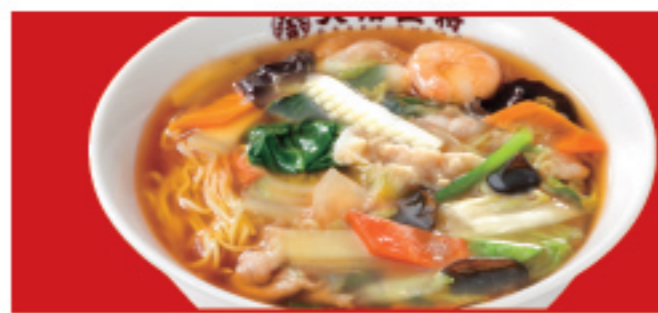
五目あんかけラーメン 税込860円