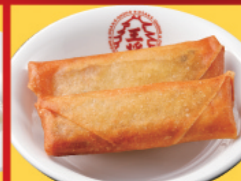
パリパリ春巻き 2本 税込330円