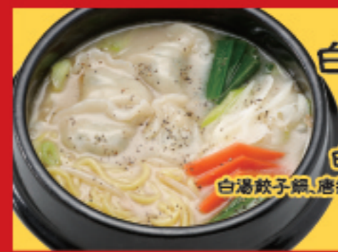
白湯餃子鍋 税込800円