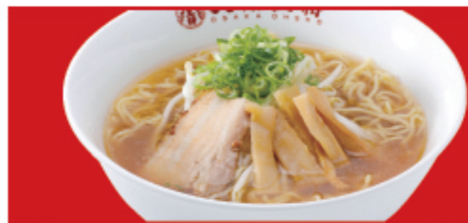
醤油ラーメン 税込650円 醤油ラーメン(小) 税込500円