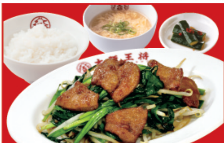
レバニラ定食 レバニラ炒め・ライス・スープ・漬物 税込1,050円