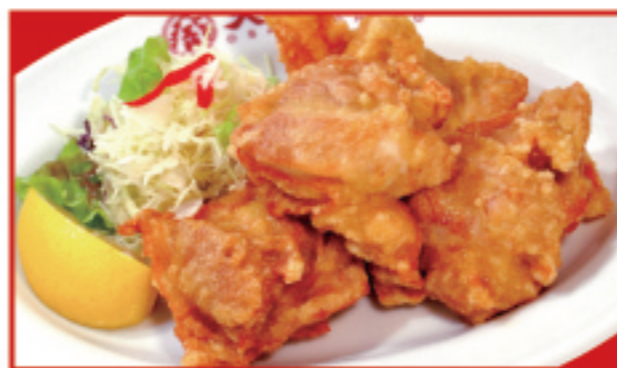
鶏の唐揚げ (5個) 税込750円