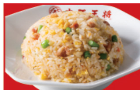
ガーリック炒飯 税込730円