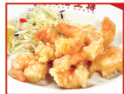
小海老の天ぷら (8尾) 税込750円 小海老の天ぷら (4尾) 税込480円