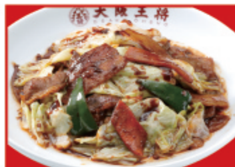
ごちそうキャベツの回鍋肉 税込840円