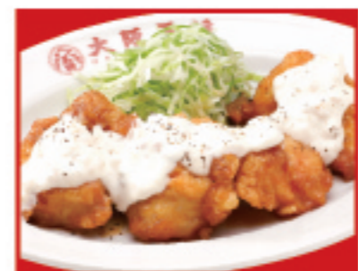
チキン南蛮 税込760円