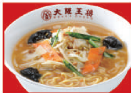
野菜たっぷり 味噌ラーメン