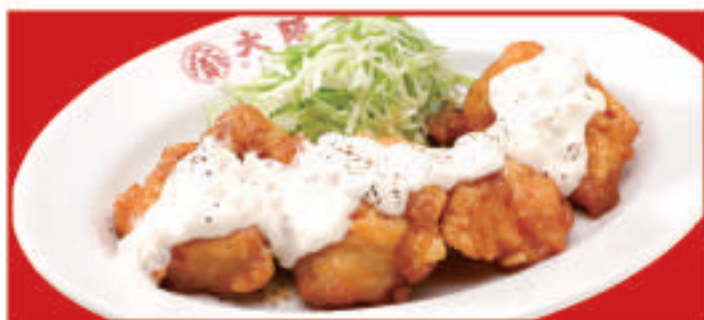
チキン南蛮 4個 730円(税込) チキン南蛮 2個 450円(税込)