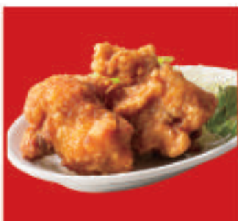
唐揚げ 2個 450円(税込)