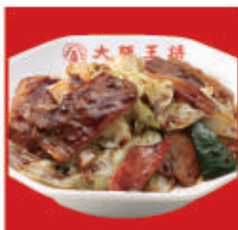
ごちそうキャベツの回鍋肉