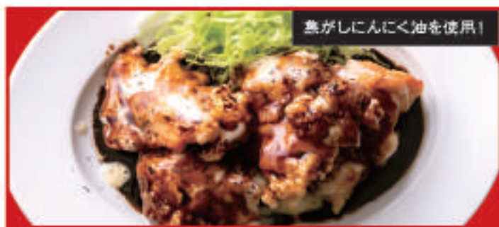
黒唐揚げ 4個 730円(税込)