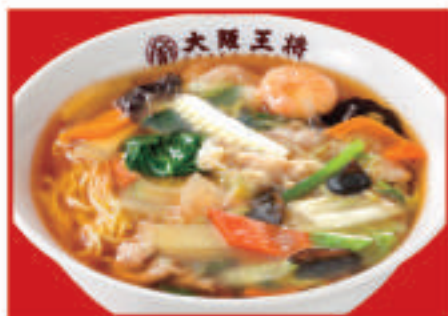
五目あんかけラーメン