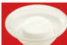
さわやか杏仁豆腐 350円(税込)