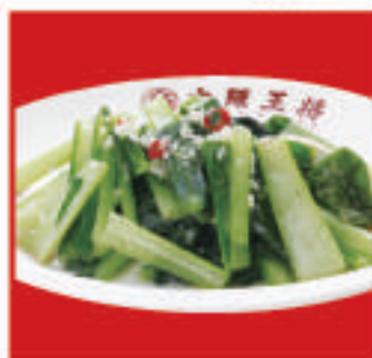
青菜のガーリック炒め