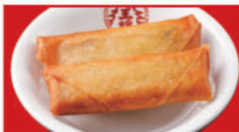
春巻き 2本 350円(税込) 春巻き 1本 200円(税込)