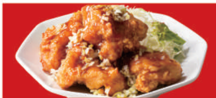
油淋鶏 4個 730円(税込) 油淋鶏 2個 450円(税込)