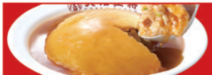
ふわとろ天津炒飯