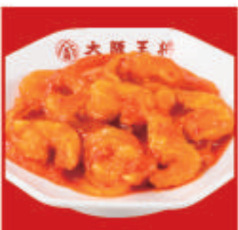
海老のチリソース