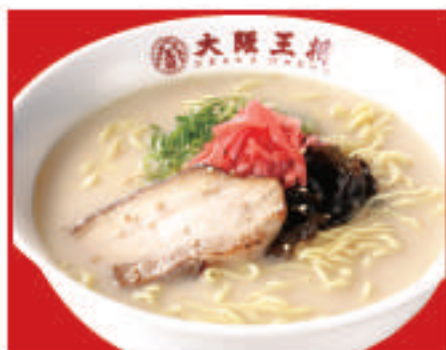
とんこつラーメン