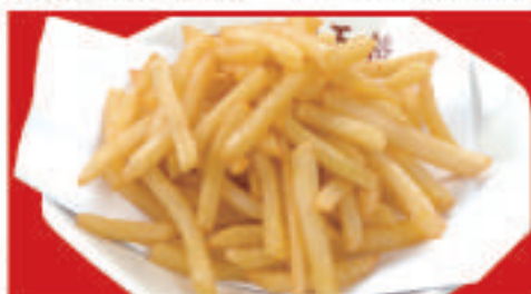
フライドポテト 350円(税込)