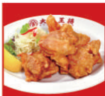
唐揚げ 5個 730円(税込)