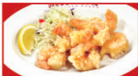
小海老の天ぷら 730円(税込) 小海老の天ぷら(小) 550円(税込)