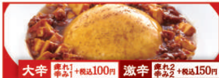
ふわとろ麻婆天津飯