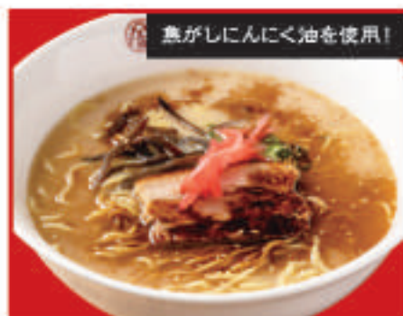
黒とんこつラーメン