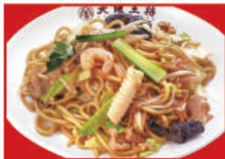
もちもち太麺の 炒め焼きそば