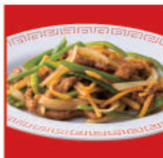
チンジャオロース